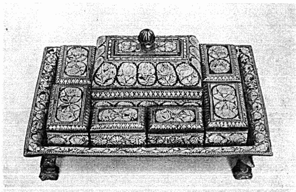
Fig. 4. Krydderisæt med sølvindlægning. Bidri-arbejde, 16.—17. årh.

Atter i år er samlingen af islamisk keramik blevet forøget med flere fremragende stykker. 1) Ny Carlsberg Fondet, der gang på gang har viist museet sin forstående interesse, har således skænket to skåle, af hvilke den ene repræsenterer den ret sjældne Minai-vare