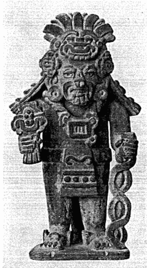
Fig. 6. Zapotekisk gravurne. México.

repræsentant Mogens Krause samt forskellige stenoldsager, der er indsendt fra Mineralogisk Museum sammen med de ovennævnte stykker fra Grønland. Bedre stiller sagen sig for de gamle, amerikanske kulturfolks vedkommende. Med Ny Carlsberg Fondets bistand er det lykkedes at erhverve dels en zapotekisk gravurne af