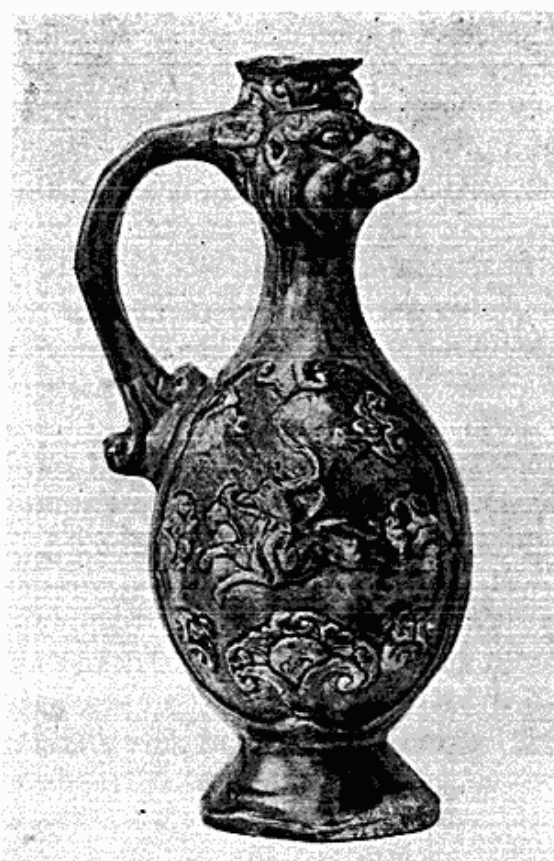
Fig. 1. Kinesisk lerkande. Form og dekoration stærkt persisk påvirket. T'ang-dynastiet (618—906).

Heller ikke fra Bagindien er tilvæksten særlig stor. Den ind-