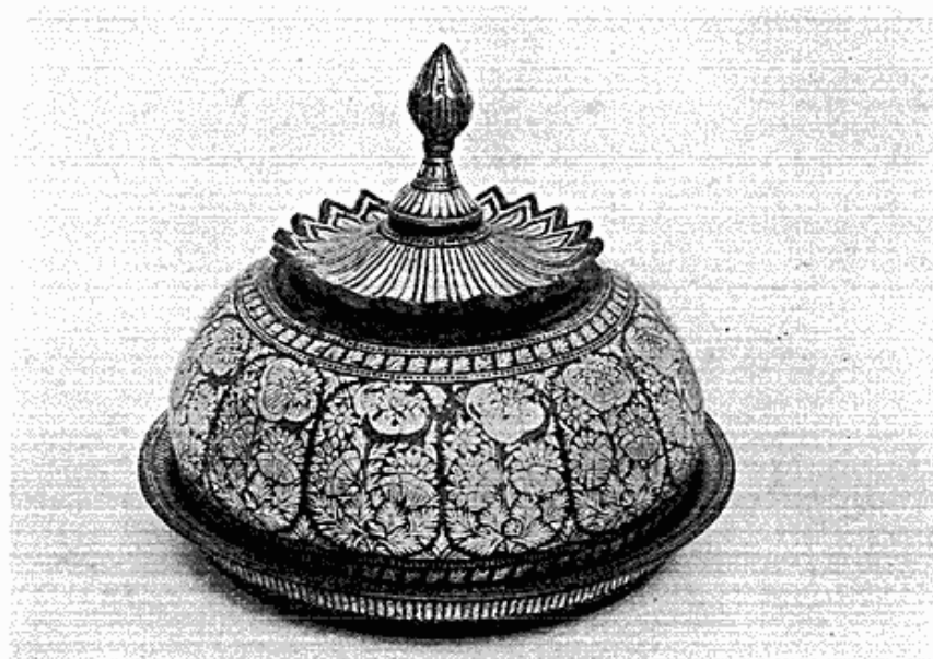
Fig. 3. Beholder med sølvindlægning. Bidri-arbejde, 16.—17. årh.

Allerede i forrige årsberetning var der lejlighed til at nævne forskellige sager fra Ceylon skænkede af forfatteren Hans Hartvig Seedorff Pedersen og frue. I år har de yderligere forøget deres gave med en del genstande fra deres sidste rejse på Ceylon. Særligt er der grund til at fremhæve et ildbor fra veddaerne (det første stykke i museet fra denne primitive junglestamme overhovedet) og et gammelt, formentlig juridisk dokument skrevet på kobberplader og