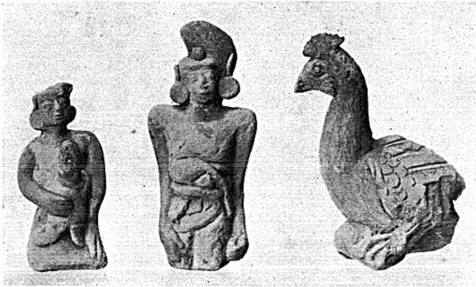
Fig. 2. Lerfigurer fra hindu-tiden. Java.

men også nogle dyrefigurer forekommer (fig. 2). Museet har fra tidligere tid nogle af disse sjældne stykker, men hverken så mange eller så fuldstændige som de nu erhvervede. Desuden omfatter den omtalte samling et par af de gamle, såkaldte Madjapahit-krise med fæste og klinge i eet stykke, flere hinduiske gudebilleder af bronze og enkelte nyere sager. Ved køb er der ligeledes indkommet nogle få genstande fra Philippinerne, en økse fra Sumatra er skænket af