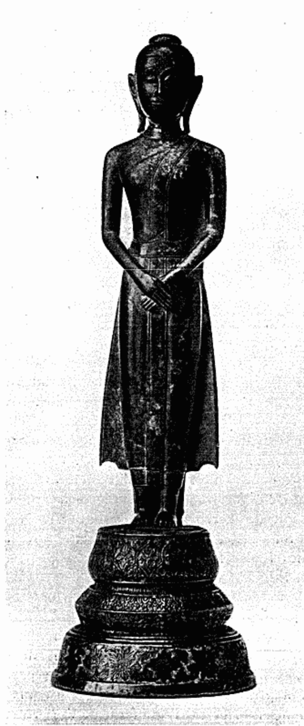
Fig. 1. Siamesisk Buddha udskåret i graagrøn Sten, staaende paa en Metalfod, indlagt med Emaille. 43 cm høj. Af H. kgl. H. Prinsesse Maries Samling.