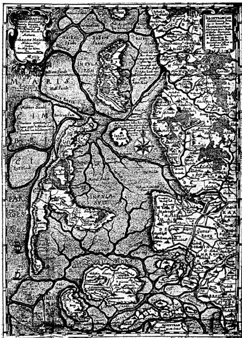
Fig. 1. Johs. Mejers Kort fra 1644.

er det bedst egnede til Sejlads fra det aabne Hav ind til Kysten, og som ogsaa gennem lange Tider var den vigtigste Indsejling paa