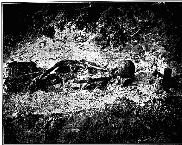
Fig. 4. Grav fra hustomt. Khaen-sale.

midten blev understøttet af fire stolper. Indgangen dannedes af en 2 m lang, tilsyneladende overdækket husgang. I midten af huset fandtes ildstedet. De fleste oldsager lå enten bag dette eller fortil nær indgangen. Der fandtes talrige knogler af sæl, fjældræv, isbjørn, ren, forskellige fugle samt af og til hvalros og hval, men altid ordnet i dynger efter art, f. eks. op mod væggen bag ildstedet mere end 30 hele og en stor mængde sønderslagne ræveskaller; utvivlsomt ligger der særlige, religiøse forestillinger bag denne skik. Jærn er overmåde almindeligt i fundet, ligeså ben (hval-