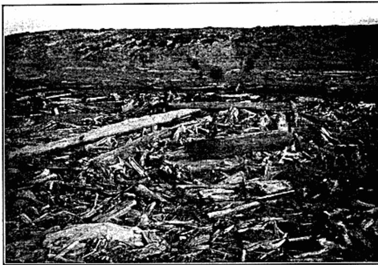
Fig. 2. Drivtømmer på stranden ved Malygin Strædet.

Den ene fundplads på Tiutei-sale ligger 2 km sydvest for halvøens nordspids. Fundene blev her gjort på de indvendige skråninger af et par delvis tilgroede klitter. Der blev fremdraget talrige knogler af hvalros og noget færre af sæl, mens knogler af ren og ræv hørte til undtagelserne. Af redskaber fandtes bl. a. en skraber af sandsten og en groft forarbejdet pilespids af sten. Endvidere forekom talrige potteskår (fig. 1 a). Karrene har været ret godt brændt, formodentlig rundbugede med en indsnævring under mundingsranden og langs denne forsynet med indtrykte ornamenter og pindstik. Rigdommen på sødyrknogler, den ringe mængde