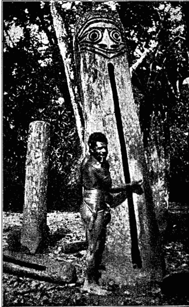
Fig. 1. Mand ved Slidsetromme. Syd Malckula.

vore Begreber var temmelig umagelige. Hist og her saa vi smaa Plantager, anlagt hvor Forholdene var gunstige, det var Bananer og Yams. Efterhaanden som vi nærmede os til Byen, saa vi talrige Vexler lavet af Svin. Disse Dyr var de første levende Væsener vi traf paa, fraregnet Myggene. Selve Landsbyen var indhegnet, dels