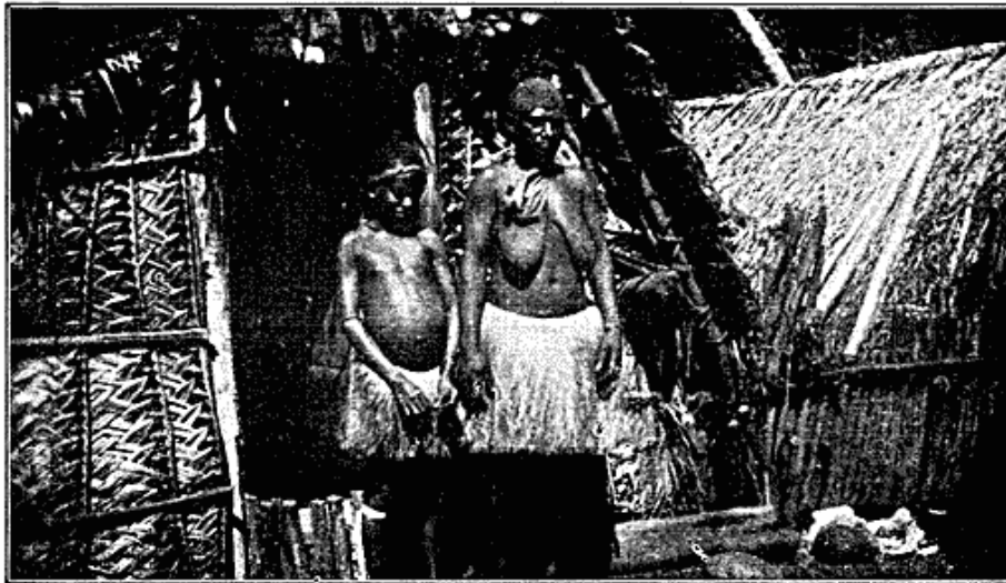
Fig. 3. Kvinder fra det indre Ambrym.

Assyrere. De var fine og slanke af Legemsbygning. Klædedragten var den samme, blot brugtes et Penisfuttal af en lille flettet Maatte, der som Lerkarrene var importeret. Kraftig Bemaling i rødt og sort brugtes ogsaa til Hverdag. De saaes ofte bevæbnede med Bue og Pil eller en Kølle, der samtidig tjente som Stok. Enkelte havde Geværer. Kvinderne bar Græsskørter, Straa bundet til en Snor. De bandt det ene uden paa det andet, til Tider en Snes Stykker, saa det stod brusende om Hofterne. Det yderste kunde være farvet rød-violet i Mangrovefarve. Haaret bar de tæt afskaaret i