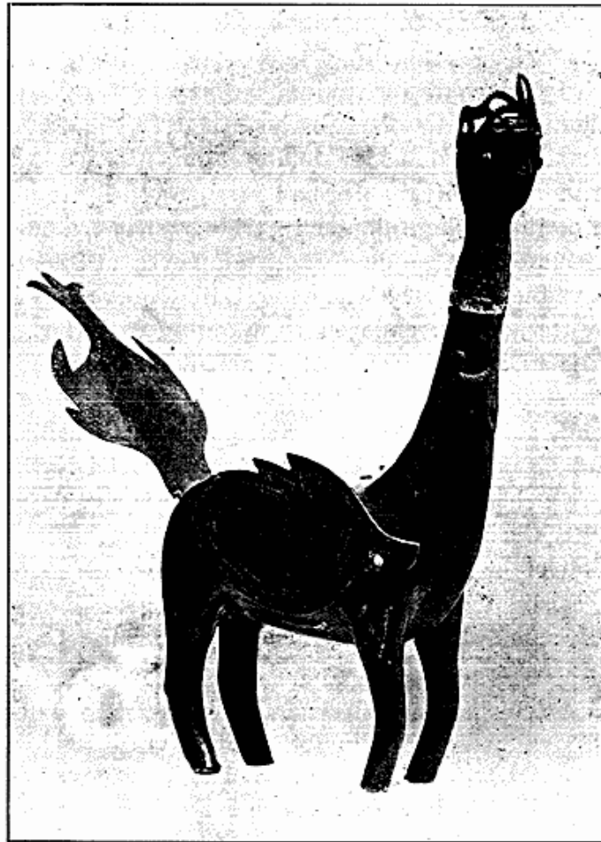
Fig. 3. Bronzefigur fra Sumatra.

men ogsaa Øerne Bali, Sumatra, Celebes og Borneo er repræsenterede. Blandt de javanske Sager maa særlig fremhæves en større Ganesafigur af Sten, et Minde fra Øens hinduiske Tid; endvidere en udskaaren og malet Trædekoration fra en Baad, udskaarne Dørprydelser og et Par meget store Masker. En interessant Bronzefigur, forestillende Burak, det vingede Dyr, der fører Muhammeda-