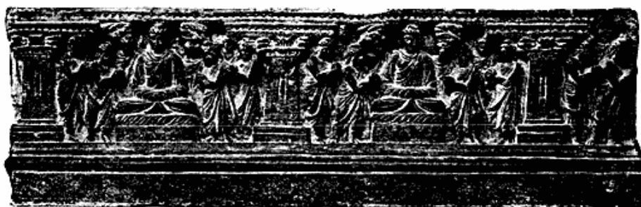
Fig. 4. Stenrelief fra Forindiens buddhistiske Periode.

Fra den kinesiske Kulturkreds hidrører en Jernplanke og nogle udskaarne Træstykker fra det samme Tempel i Mukden, hvorfra Museet tidligere har modtaget en Række Sager, bl. a. en meget stor