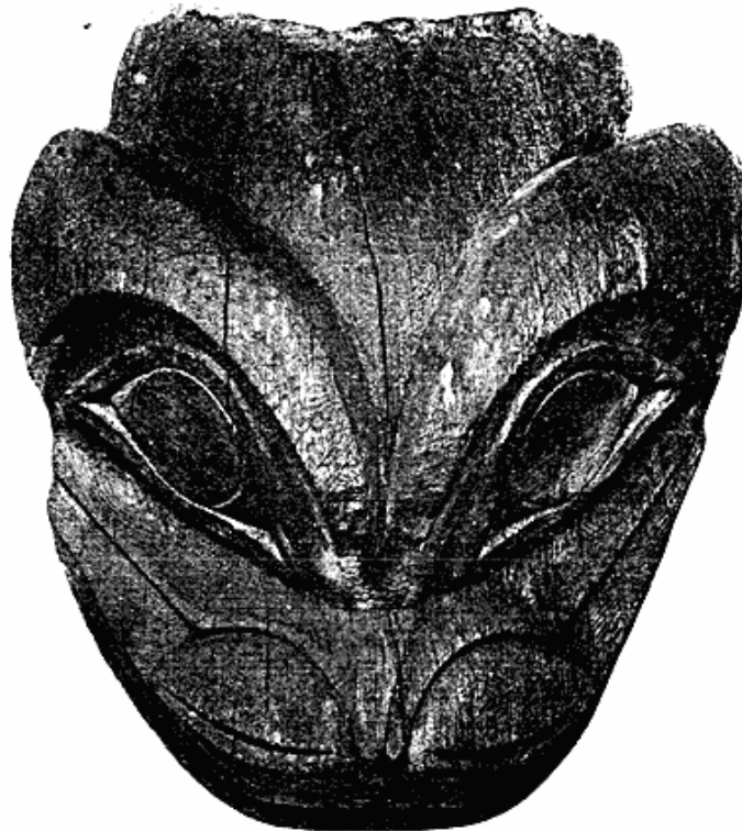
Fig. 5. Træudskæring fra en Husstolpe fra Haidi-Indianerne.