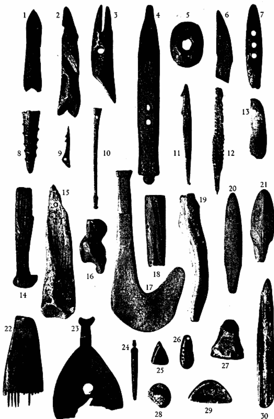
Fig. 2. Typer fra det 18. Aarhundrede. Misigtoq. Maalestok ca. 2/3. 1—3. Harpunspidser. 4—6. Dele til Harpuner. 7. Stykke til Bugsertøj. 8. Bagende til Fuglespydspids. 9—10. Fiskekrog. 11. Lystertand. 12. Benpind, udflækket ved Drilboring. 13. Remknap. 14. Knivskaft. 15. Øksehoved. 16. Dril- bor-Mundstykke. 17. Krog til at fiske Tang med. 18. Naalehus. 19. Ajagaq. 20—21. Knivblade. 22. Kam. 23. Ske. 24—26. Smykkesager. (25. af Klokke- malm). 27. Skraber. 28. Glasperle. 29. Legetøjslampe. 30. Lampepind.