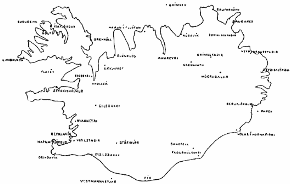
Fig. 1. Anvendte meteorologiske Stationer. Perioden 1874—1929.

Det er altsaa en stor Del af Stationerne, der har Observationsrækker paa kun 1 eller 2 Aar; for Januar beløber det sig til 27,6 % af samtlige Observationsrækker og for Juli til 26,1 %. Selvfølgelig betyder denne Omstændighed et væsentligt Minus ved Udfærdigelsen af Isotermekortene, idet disse yderst korte Observationsrækker ikke har kunnet anvendes til Fastlæggelse af Kurverne. De lidt længere