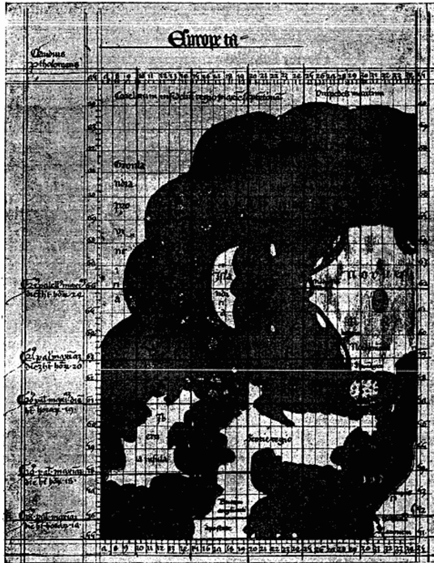
Fig. 2. Nancykortet. Fillastre's Kopi fra 1427 af Claudius Clavus' første Kort. (Medd. om Grøn. XLVIII).

til Svalbarde. Dette Antal Døgn angives til 4, saa at disse Afstande bliver ca. 300 Sømil 1) ). Denne Afstand er der fra Snæfellsnes mod Vest til Øerne Øst for Angmagsalik, og fra Langanes mod NNØ. til Jan Mayen og mod NNV. til Scoresby Sund.