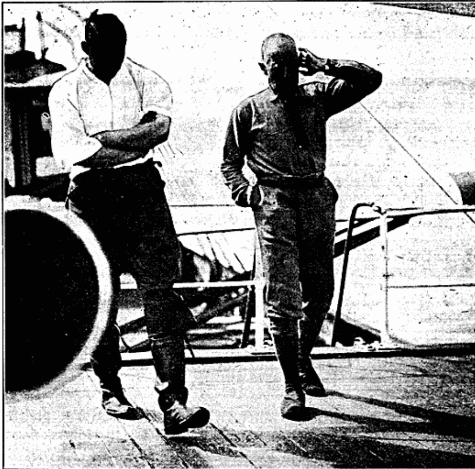
Amundsen (t. h.) og Riiser-Larsen drøfter Situationen.

Transporten af Flyvebaadene til Kingsbay var meget vanskelig; Amundsen drog et Lettelsens Suk, da de stod monterede paa Isen. Han gav Meddelelser om Meteorologernes Arbejde, Ekspeditionens