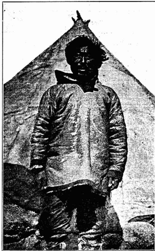
Fig. 2-3. Midaldrende Mand foran sit Telt. Padlimiut, Eskimo Point.