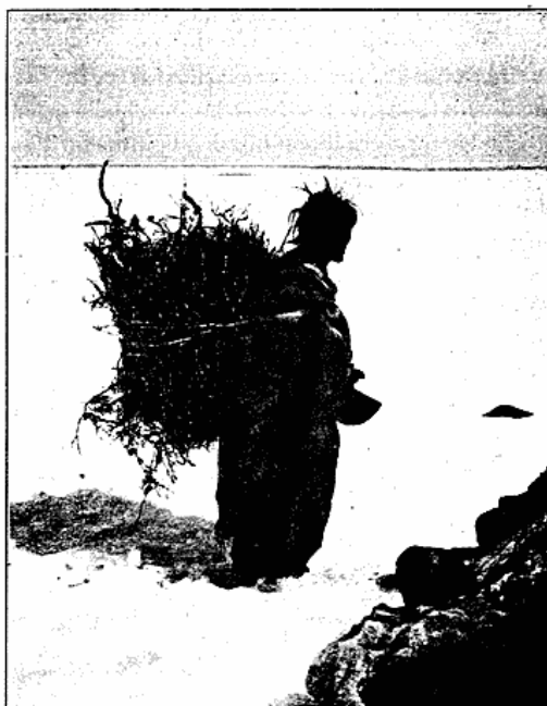
Fig. 9. Kvinde med Risknippe. Padlimiut, Hikoligjuaq.

Slags ureskimoisk Kultur fra den Tid, da Omdannelsen til en Kystkultur endnu ikke havde fundet Sted. Men jeg mener absolut ikke, at denne Omdannelse er sket ved Hudson Bay. Det maa erindres, at Renvandringerne foregaar her parallelt med Kysten og ikke kan lede en oprindelig Indlands-Befolkning ud til Havet, og at Kysten desuden i sig selv ikke indbyder til en Kulturtilpasning, fordi det lave Vand maa gøre Isfangsten ret vanskelig. Desuden viser de arkæologiske Fund en allerede fuldt udviklet Kystkultur. Hvis jeg paa dette Tidspunkt skulde vove en Hypotese om Eskimo-Kulturens Udvikling, skulde det foreløbig være denne: