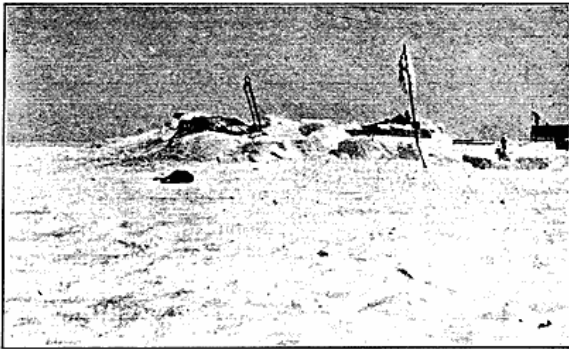
Fig. 6. Snehytter, hvis Tag er brudt ned paa Grund af Smeltningen og erstattet med udspændte Skind. Chesterfield.