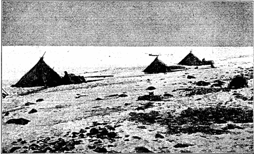
Fig. 7. Renskinds-Telte ved Stranden. Padlimiut, Eskimo Point.

Det vil da ogsaa støde paa store Vanskeligheder at forklare deres Kultur som en Aflægger af den gamle Kystbefolkning, naar vi nærmere betragter denne selv. Ganske vist maatte en Del af dens Bestanddele falde bort i Indlandet af geografiske Grunde; men hvorfor skulde man opgive at bruge Bola og Fuglekrog, Fiskenet, Tværøkse, det „vingede“ Naalehus m. m., der laves inde i Landet lige saa godt som ude ved Kysten? Og hvorfor skulde man opgive at skaffe sig Spæk fra Kysten? Det er vanskeligt at tænke sig en Stamme, som engang har benyttet Spækklamper, flytte ind i Landet og uden Forsøg paa at afhjælpe Forholdene tilbringe Vintre med \pm 50^{\circ} C. i ganske uopvarmede Snehytter, som de faktisk er det paa Barren Grounds.