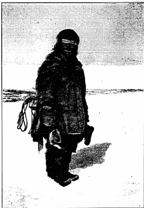
Fig. 8. Sælfanger, med Snebriller paa Grund af Lysskæret, vender hjem til Lejren. Padlimiut, Eskimo Point.