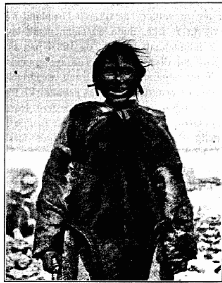
Fig. 4-5. Kvinde i Vinterdragt, men uden det almindeligt baarne Pandesmykke af Messing. Padlimiut, Eskimo Point.