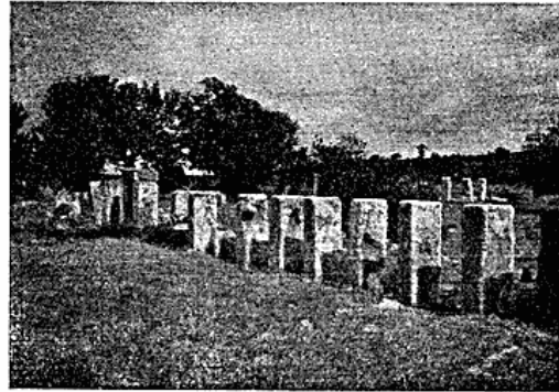
Fig. 4. Ruinerne af Messa.

nærmere at bese Ruinerne af Messa, der ligger paa en lille Hævning i Terrainet ved en sprudlende Kilde. Af den tidligere rige og blomstrende Stad findes nu kun Fundamentterne af offentlige og private Bygninger. Byen synes at have været Centrum i en blomstrende Agerdyrkningskoloni, en Slags Haveby, thi Ruinerne strækker sig milevidt, ikke ordnede i regelmæssige Gader, men spredte i Grupper, hvorefter Vejene snor sig. Staar man paa Ruinerne af Forum, ser man, saa langt Øjet naar, Rækker af omtrent 2 Meter høje Stenblokke rage op som Monoliter, alle med en indbyrdes Afstand af 2—3 Meter. De fleste er Levninger af Kornmagasinernes Piller, mellem hvilke der har været lette Murstensvægge, som nu er helt forsvundne; enkelte er Resterne af Pumper, der hørte til de gamle Olje- og Vinperser.