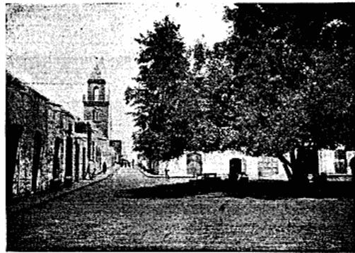
Fig. 3. Torvepladsen i Merg.

Paa Byens Hovedgade ligger Moskeen; desuden en Del Butikker, hvis Indehavere næsten udelukkende er Jøder, samt nogle arabiske Kaffehuse. Midt paa Torvet staar et ældgammelt Morbærtræ, der med sin brede Krone danner som et Tag over det meste af Pladsen. Her sidder Araberne og de italienske Soldater timevis og nyder deres Kaffe. Omkring Torvet koncentrerer hele Handelen sig, saa her kan Beduinerne, naar de kommer ind fra Landet, afgøre deres Forretninger.