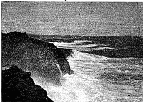
Fig. 1. Brænding ved Klipperne ved Hania. Typisk Kystparti.

Den Del af Landet, der kan komme i Betragtning ved Spørgsmaalet om Kolonisering, er egentlig kun den nordlige Del af Kystplateauet, o: den store Halvø, der strækker sig ud i Middelhavet, begrænset mod Øst af Sollum-Bugten, mod Vest af den store Syrte og mod Syd af Vandskellet mellem Middelhavet og Ørkenstepperne, der efterhaanden gaar over i Ørkenen Sahara. Terrainet hæver sig jævnt op fra Ørkenen, breder sig over et Kalkstens Underlag ud til et Plateau og sænker sig derefter terrasseformigt ned mod Havet. Paa nogle Steder naar Plateauet med stejle Skrænter tæt ud til Havet, paa andre Steder er der en mer eller mindre bred, flad Kyststrækning, der f. Eks. i Egnen om Bengasi udvider sig til en stor Slette.