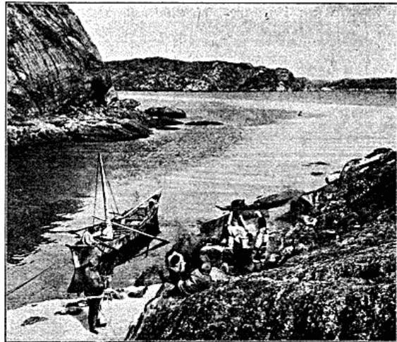
Typisk Landskab fra Egedesminde's Skærgaard. Vi holder Hvil paa Vej til Sarfaq. I Hjørnet ses en Rest af Vintersneen.

ler Solen over det blikstille Vand; Dag efter Dag bader de fattige, arktiske Planter sig i dens Lys, og de har sandelig al Grund til at skynde sig med at gro, for selv nu, paa de første Dage af Avgust, træffer man mange Pilebuske med kun halvt udfoldede Knopper og andre, der først staar i Blomst. Og Dag for Dag kæmper vi mod Myggene! Jeg som troede, at jeg fra min Rejse i Syd-Grønland vidste, hvad Myg var, og som ikke huskede paa, at vi dengang tilbragte en stor Del af Dagen paa den aabne Fjord! Myggene staar som én eneste tæt Sky over Pladsen, og selv flere af Grønlænderne optræder med mere eller mindre fantastiske Hovedtøjer af Tørklæder o. l. I vort Telt er det nu helt