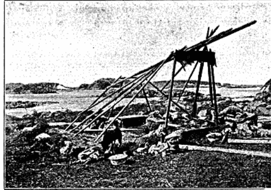
Teltstel af erqulik -Typen, Taseralik. Skindene er fjærnede for at tørres.

Som vi snart opdager, er Roerne ikke af allerførste Sort; men Humør er der i dem. Under ustandselige, gensidige Tilraab glider vi frem, og det er sandelig Friluftsvittigheder, der falder! Damerne tager det som noget selvfølgeligt og ler med. Anstændighed er nu engang noget ganske