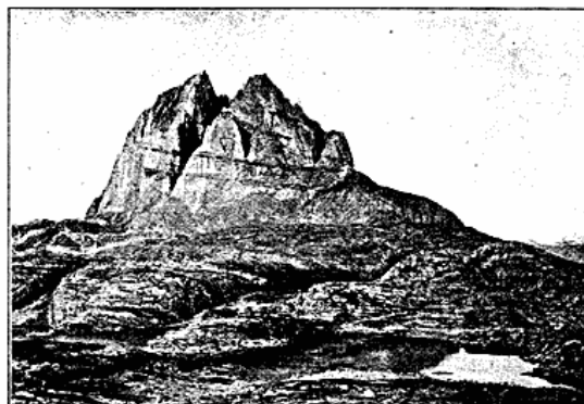
Ūmánaq-Fjældet ved Kolonien Ūmánaq. De mørke Baand er Hornblende-Skifer.