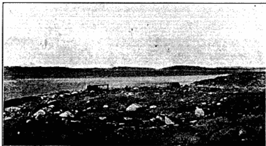
Udsigt over Sarfaq. I Forgrunden Teltpladsen og Bærestedet Qiterdleq.

En Dag satte Grønlænderne en stor Idrætsfest i Scene. En og anden Læser kender maaske fra Hans Egede's Værk om »Det gamle Grønlands nye Perustration eller Naturel-Historie« (Kbh. 1741) den morsomme, gamle Illustration, der forestiller forskellige Former for eskimoisk Idræt. Det var som at se denne lyslevende for sig. Mellem en Klippeafsats og nogle oprejste Konebaads-Aarer blev der udspændt et Par Kobberremme, og hængende over dem forsøgte man forskellige Slags »Rulning«. Den ægte, grønlandske Gymnastik er næsten altid en eller anden Form for »Rulning« over udspændte Remme. — Det skal navnlig være paa Fangstpladserne om Foraaret, at de unge Mænd kappes paa denne Maade.