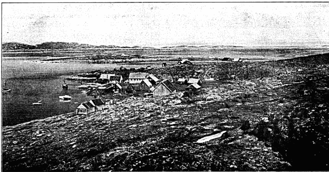
Kolonien Egedesminde. I Mellemgrunden ses Tørve-Øen og i Baggrunden Manitsoq.

Kolonien Egedesminde blev anlagt i 1759, men oprindelig langt sydpaa i Distriktet, hvorfra den dog blev flyttet til sin nuværende Plads inden Aarhundredets Udgang. Alle de omgivende Fjælde er lave og afrundede og Farvandet roligt som en Indsø; ti det er afspærret fra den aabne Disko-Bugt ved en Række Øer. Lige uden for Kolonien findes en lille Holm, ejendommelig ved sin overvældende rige Tørvedannelse. Foden synker her dybt ned i det metertykke Mostæppe, der i ikke engang Halvdelen