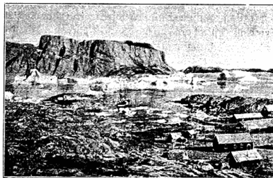
Kolonien Ūmánaq med Storøen i Baggrunden Farvandet er opfyldt af Isfælde.