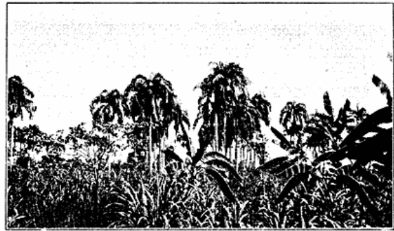
Ved Vejen imellem Port-au-Prince og Leongame.

Med Hensyn til Religionen, som altsaa egentlig er Katolicisme, er der fra en Del andre Trosretninger blevet arbejdet gennem Missionærer, saaledes bl. a. af den episkopale Missionsvirksomhed