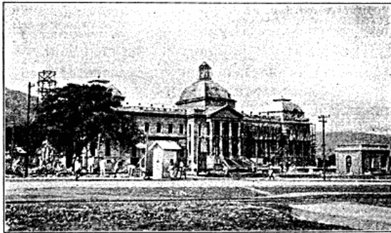
Præsidentens nye Palads under Bygning i Port-au-Prince.

Medens det oprindeligt, da Europæerne kom til Øen, var Guld og lignende Kostbarheder, man var paa Jagt efter, gik man snart over til Plantagedrift for at udnytte Jordens rige Muligheder, thi