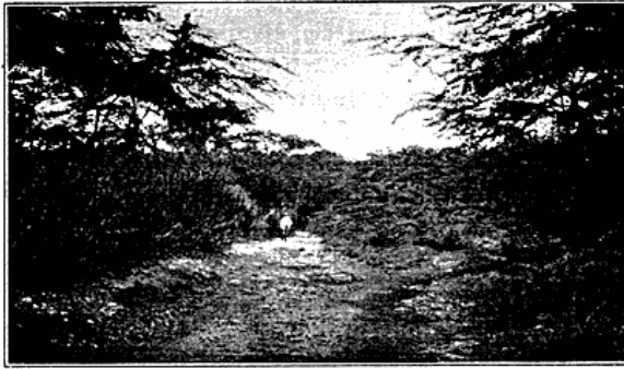
Vej i Cul-de-saç.

strækker sig store Sletter, som gødes ved alluviale Aflejringer fra Vandløbene. De er derved i Tidernes Løb blevet dækket med et flere Meter tykt Lag humus, som gør dem overordentlig frugtbare.