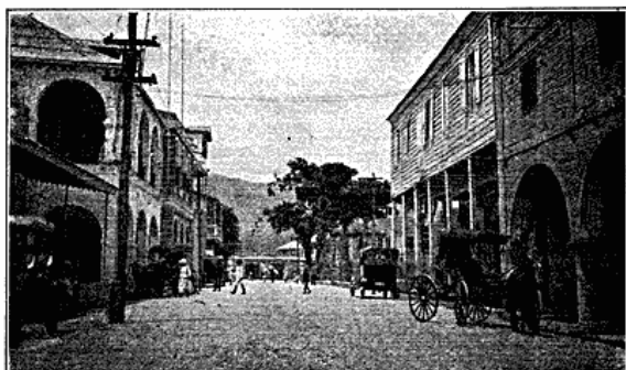
Fra Forretningskvarteret i Port-au-Prince.

paa selv at faa Udbytte af sit Arbejde, idet de stadige Revolutioner vendte op og ned paa alt. Uvillie mod de hvide gav sig bl. a. Udtryk i en Lov om, at ingen hvid maatte eje Jord, et Forhold der først for et Par Aar siden var forandret. Vejene er forfaldne, det glimrende franske Vandingsystem med store Bassiner oppe i Bjærgene og Kanaler, der førte ud over Sletterne, er fyldt op og sandet til, Plantagerne passedes ikke, Bygningerne faldt i Ruiner, som endnu ses rundt omkring i Bjærgene. Som Eksempel kan nævnes, at i 1793 udførtes for 20 Mill. Dollars Sukker, medens der indtil for ganske nylig er bleven indført Sukker til Øens eget Brug. Der er nu for nylig startet et stort amerikansk Kompagni, der har anlagt Sukkermøller i