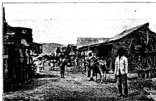
Fra Negerkvarteret i Port-au-Prince.

Byens Markedsplads ligger paa en vældig aaben Plads foran den katolske Domkirke. Der findes ogsaa store overdækkede Markeder, men paa den aabne udfolder der sig det rigeste og interessanteste Folkeliv. Overhovedet er Folkelivet i Port-au-Prince som overalt i Troperne overordentlig morsomt. Det