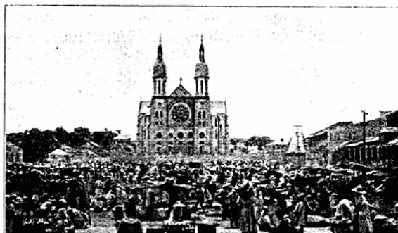
Markedspladsen i Port-au-Prince og den katolske Domkirke.

Den letteste Forbindelse til Haiti er med Damper fra New York, det er 5 Dages Sejlads. Naar man kommer Nord fra, passerer man først nogle af Bahamaerne, bl. a. Watling Iland, der ligger lige ved San Salvador. Skibets Ankomst er i Almindelighed beregnet saaledes, at man kommer til Port-au-Prince tidligt om Morgenen. Den foregaaende Eftermiddag ser man allerede Haitis Bjærg tone