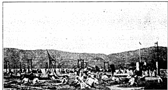
Kaffe haandrenses i Jacmel.

Den Kaffe, man i Almindelighed faar i Europa, er hyppig kun Machiné, d. v. s. maskinrenset, hvilket ikke befrier den for Smaasten, knækkede Bønner, sorte Bønner etc. Den fineste Kaffe er haandrenset, hvilket foregaar ved at Kaffen hældes ud i Bunker paa store Cementgulve i det fri, hvor Negerkonerne sætter sig ned i Bunken og piller alt fra, saa kun de hele, rene Bønner bliver tilbage. Jeg har forresten truffet Folk, der efter at have set det ikke mere vilde drikke Kaffe.