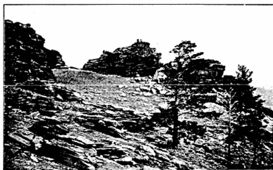
Skiferklipper i Transbajkalien.

Fordelingen af russisk og indfødt Befolkning er overordentlig ulige i de forskellige Landsdele og varierer fra 4—8 Procent indfødte i de vestlige Guvernementer, 10—20 i Guv. Irkutsk, 25 i Transbajkalien, 50 og mere i Terr. Semipalatinsk og Akmolinsk, indtil Maximum ca. 90 Procent i Terr. Jakutsk. Som Helhed gælder, at Procenten af indfødte er nogenlunde omvendt proportional med Befolkningstætheden, selv om Russere og indfødte i Reglen holder sig hver paa sine Omraader. Taget under ét er Russernes Antal nu om Dage det langt overvejende, men det er først i de senere Aar og navnlig siden Jærnbansens Anlæggelse, at det er kommen saa vidt. Aar 1800 regnede man, at der i Sibirien fandtes 800,000 hvide, altsaa Russere, medens de indfødtes Antal vel dengang ikke var meget mindre end nu, d. v. s. omkring 2 Millioner. I 1883 var den samlede Befolkning steget til godt