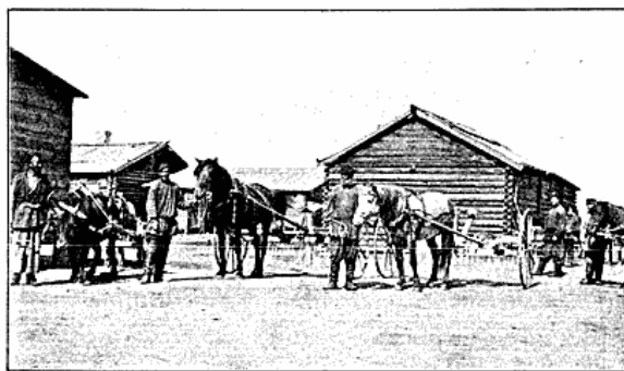
Udrykning til Markarbejde.

tigste Genstande i et Bondehus den store murede Ovn, der kan optage indtil en Fjerdedel af Rummet og i egentligste Forstand er Hjemmets Arne, tjener baade til Opvarmning, til varmt Leje om Vinteren og til Lørdagsbad, samt den uundgaelige Samovar. Senge derimod findes ikke; Lejet bestaar af et Stykke Filt eller en Pels paa Gulv eller Bænk. Yderdørene er klædte med Filt mod Vinterkulden, og Vinduerne er dobbelte. Maaltiderne er 3 om Dagen, og de er alle forbundne med Tedrikken; Kødsuppe, Kaal, Vælling, Brød, Bagværk, Mælk, sur Fløde og Æg er Maaltidernes vigtigste Bestanddele; i de mange og lange Fasteperioder træder Fisk i Stedet for Kød. Stenhuse forekommer næsten aldrig i