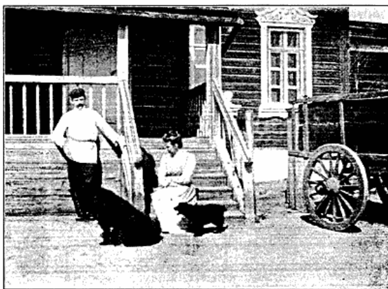
Et dansk Hjem i Sibirien.

Bebyggelse og Levevis. — Kommer en fremmed til Sibirien med den internationale Luksusekspres,