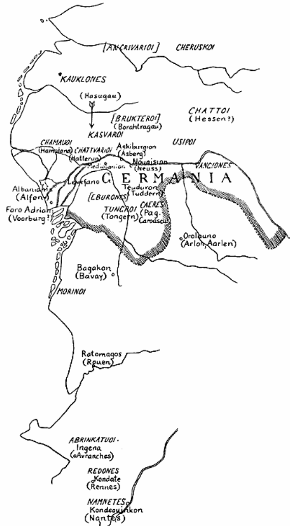
Fig. 3. Navne fra Prototyp C fordelt over et Kort med rigtige Omrids.

Nye positive Oplysninger faar vi ikke gennem det fremdragne Originalkort. Det vigtigste Resultat