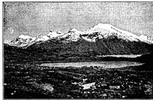
Fjældparti fra Sermersoq.