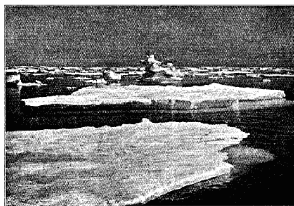
Storis ud for Arsukfjord, Juni Maaned.

nede, svagere Is har rundet Kap Farvel allerede i Januar, kommer den egentlige Storisen som Regel i Begyndelsen af April, et Tidspunkt der med Længsel imødeses af Grønlænderne, for da er Vinteren, Sultetiden, til Ende; thi umaadelige Masser af fed Klapmyds følger altid med Isen. Paa den Tid flytter alle Beboerne af det sydlige Julianehaabs Distrikt ud paa de ellers folketomme Kitsigsutøer, og i den korte Tid, der forløber, før Klapmydsen søger til Havs for at kaste sine Unger og parre sig, er disse Øer i den Grad Brændpunktet for hele Omegnens Liv, at Udliggeren i Ilua (Pamiagdruk) maa lukke Butikken og selv flytte ud til Nunarssuaq paa Kitsigsut for at handle her. I 1912 var der temmelig store Masser af Is, saa meget, at Grønlænderne