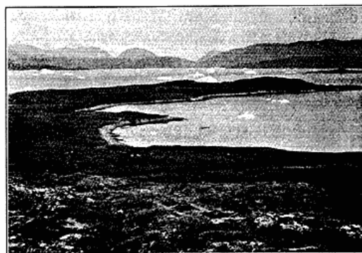
Udsigt over Isua, Tugtutök. De eskimoiske Ruiner ligger i Bunden af den nærmeste Vig. Kalvis fra Niaqornaqs Sermilik.

Fra Akuliarutseq flyttede vi til Nordostpynten af den store Ø Tugtutök, hvor vi var saa heldige at finde en højst interessant Ruinplads. Øen ender her i et lavt, stærkt forvitret Næs, Isua, inden for hvilket der findes en beskyttet Havn. Stedet er bevokset med Lyngmark og enkelte Steder ved Ruinerne med tæt, frodigt Pilekrat og saftigt Græs. Ruinerne, som var saa ødelagte og overgroede, at kun Grundplanen nogenlunde kunde erkendes, laa dels paa Ydersiden af Næsset ud mod Farvandet mellem Bredefjord og Skovfjord, og de stammede efter Formen at dømmes fra Nordboerne — dels laa de ind