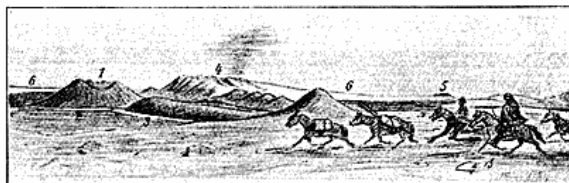
Udsigt mod Vatna-Jökulls Rand fra Egnen N. for Fagridalur. (Skitse af Daniel Bruun).

Allerede herfra kan man se Røg hæve sig fra Solfatarerne i Toppen af Kverkfjöll, ligesom Fjældene i den østlige og sydøstlige Del af Ódáðahraun ojnæs. Især er Herðubreið's smukke Top (1600 m. o. H.), der hæver sig V. for Jökulsá, dominerende; men ogsaa en Mængde andre Fjælde som Herðubreiðarfjall, Herðubreiðartögl, Kollóltadýngja, Dýngjufjöll o. s. v. synlige. I Højde med Nordenden af Herðubreið forener Kreppa og Jökulsá sig, og her var aabenbart i fordums Dage Færgesforbindelse, som benyttedes af Folk, der ikke skyede et Ridt gennem Ódáðahrauns Lavamarker til Egnen mod Vest og Nordvest. Her ligger, Sydvest for Mödrudal og paa den vestlige Side af Jökulsá et Fjæld, som benævnes Ferju-