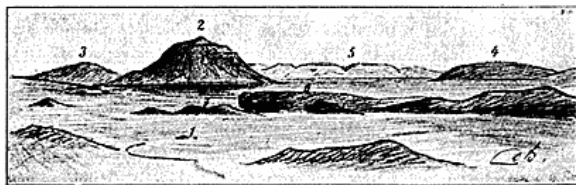
Udsigt fra Fjældene Øst for Mödrudalur imod Vest. (Skitse af Daniel Bruun).

For at rekognoscere Strækningen mellem Vatna-Jökulls Nordrand og Mödrudalur