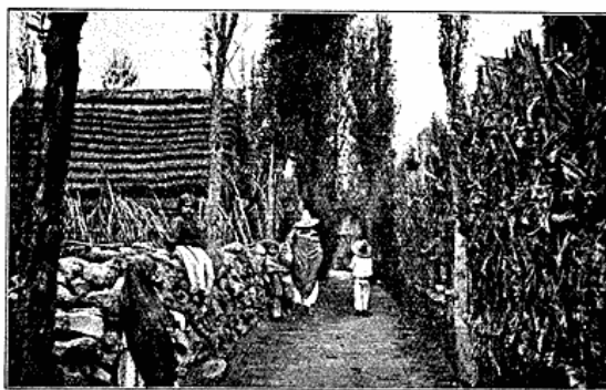
Gade i Xochimilco.

Paa dette Bud blev »Tenoxtilan«, Grundlaget til Hovedstaden Mexico, bygget.