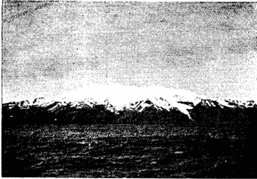
Öræfa-Jökull, set fra Havet.

nævnes »Góuþrællinn« (26. Marts) som den Dag, da Ulykken skete. Dette stemmer jo godt overens med Traditionen.