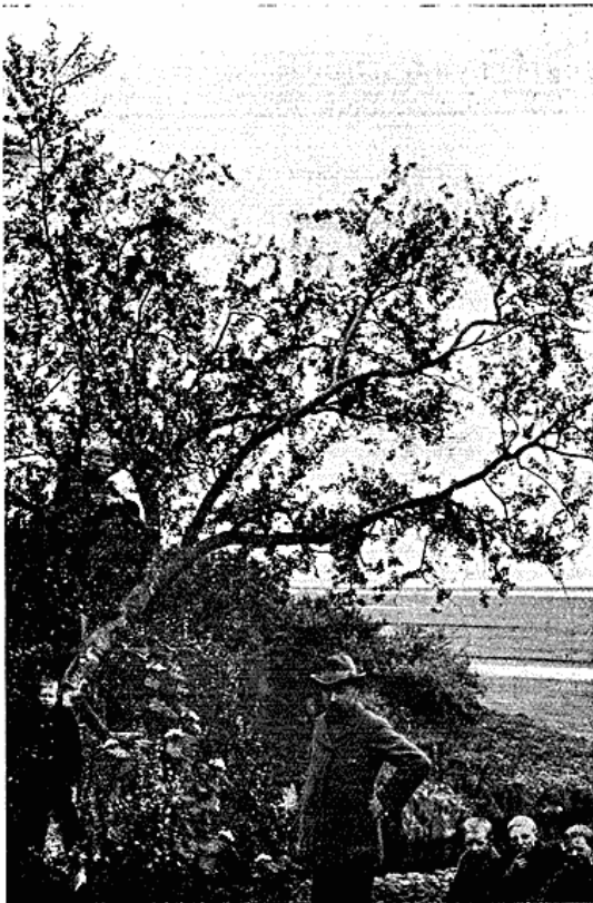
Fra Udkanten af Birkeskoven ved Skaptafell. Skeiðarársandur i Baggrunden.

Jökull, en Arm af Vatna-Jökull. Oven for Gaarden hæver sig Randfjælde, der skærmer den mod Isstrømmene fra Vatna-Jökull og dens sydlige Udløber, den høje Öræfa-Jökull. Fra Gaarden skyder Morsaadalen (Morsárdalur) sig ind i Fjældene. Den har smukke Skove af Birk, som endnu den Dag i Dag afgiver Ved til Beboerne. Selv om Stammerne