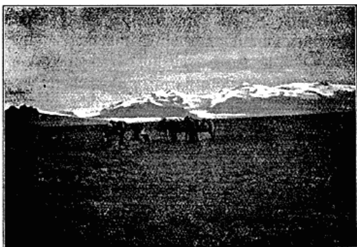
Öræfa-Jökull, set fra Vest. Skeiðarársandur i Forgrunden.

At Jöklen allerede kan befares i Juni Maaned, beviste Koch jo i 1912. Efter denne hans lykkeligt tilendebragte Jøkelrejse kan der næppe være Tvivl om Rigtigheden af de gamle Beretninger — i alle Tilfælde i Hovedsagen, hvilket Koch ogsaa udtrykkelig bemærker i sin Beretning.