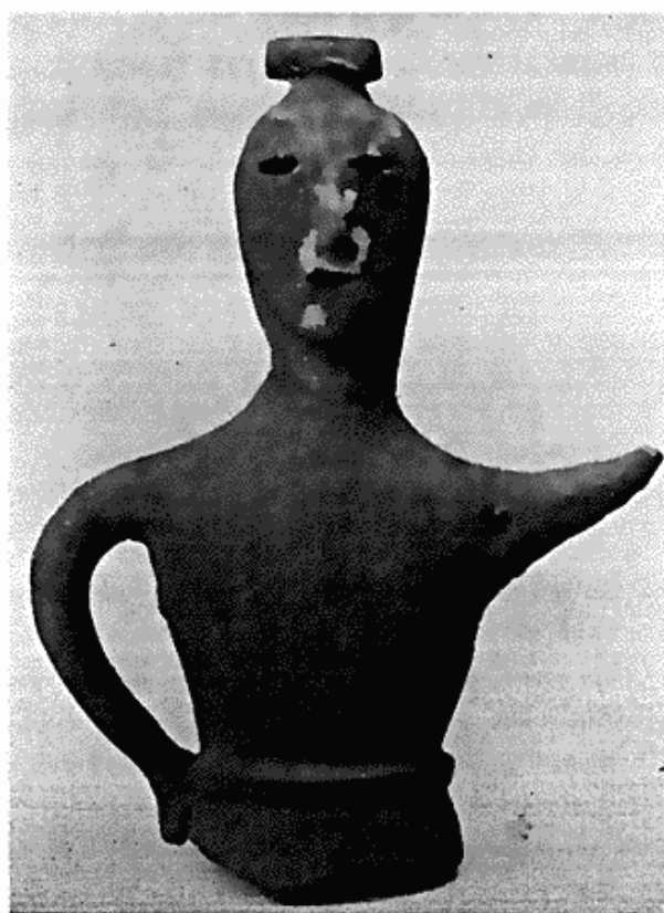
Fig. 3. Kvindefigur (haniwa) fra Yayoi-perioden. Japan.

østasiatisk kunst, vilde det for øvrigt befinde sig i en vanskelig situation; men heldigvis har det ofte med held kunnet henvende sig om støtte til sine velyndere. Det gælder selvfølgelig i første række Ny Carlsbergfondet og selskabet Etnografisk Samlings Vener. Også i år har der været rig anledning til at føle taknemlighed over for disse to institutioner, hvis redbonne hjælp det skyldes, at museet har været i stand til at indlemme fire prægtige malerier, nemlig tre kinesiske og eet formentlig koreansk, i sin østasiatiske afdeling. Det sidst nævnte forestiller en præst eller lærd, der er søgt ud i naturens stilhed, mens de andre er portrætter. De to af disse stammer fra Ming-perioden (1368—1644) og tilhører den gruppe, der betegnes som ying-hsiang , d. v. s. ceremonielle billeder, der i regelen er malet posthumt. De forestiller bægge højtstående embedsmænds hustruer, den ene civil af 3. rangklasse, den anden militær af 1. klasse, og udmærker sig lige så meget ved deres monumentale holdning som ved deres indtrængende karakteristik. Det tredje billede er lidt yngre og formodentlig et livsportræt, hsing-lé-t'u , forestillende en mandarinfrue af 1. rangklasse sammen med