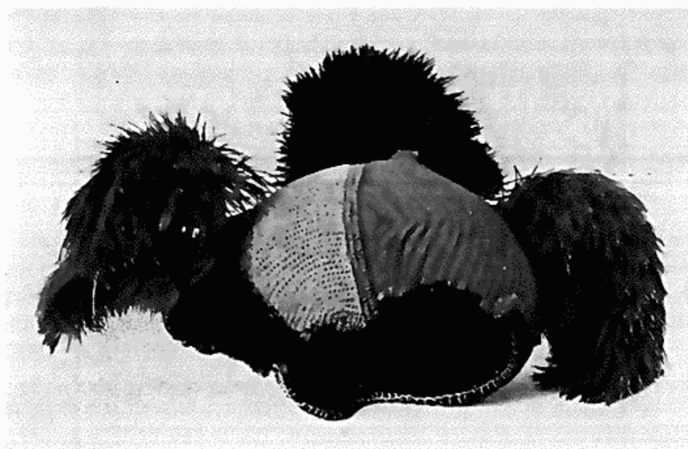
Fig. 4. Hovedtøj, udvendig dækket med malet ler og besat med strudsfjer, fra karamodjong.