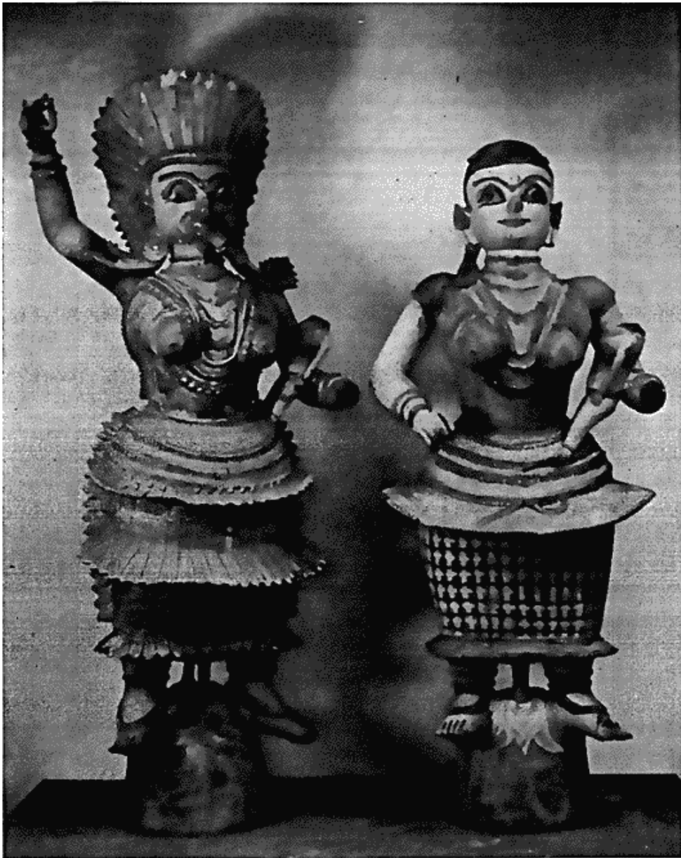
Fig. 2. Store votivfigurer forestillende gudinden Issaki. Travancore.