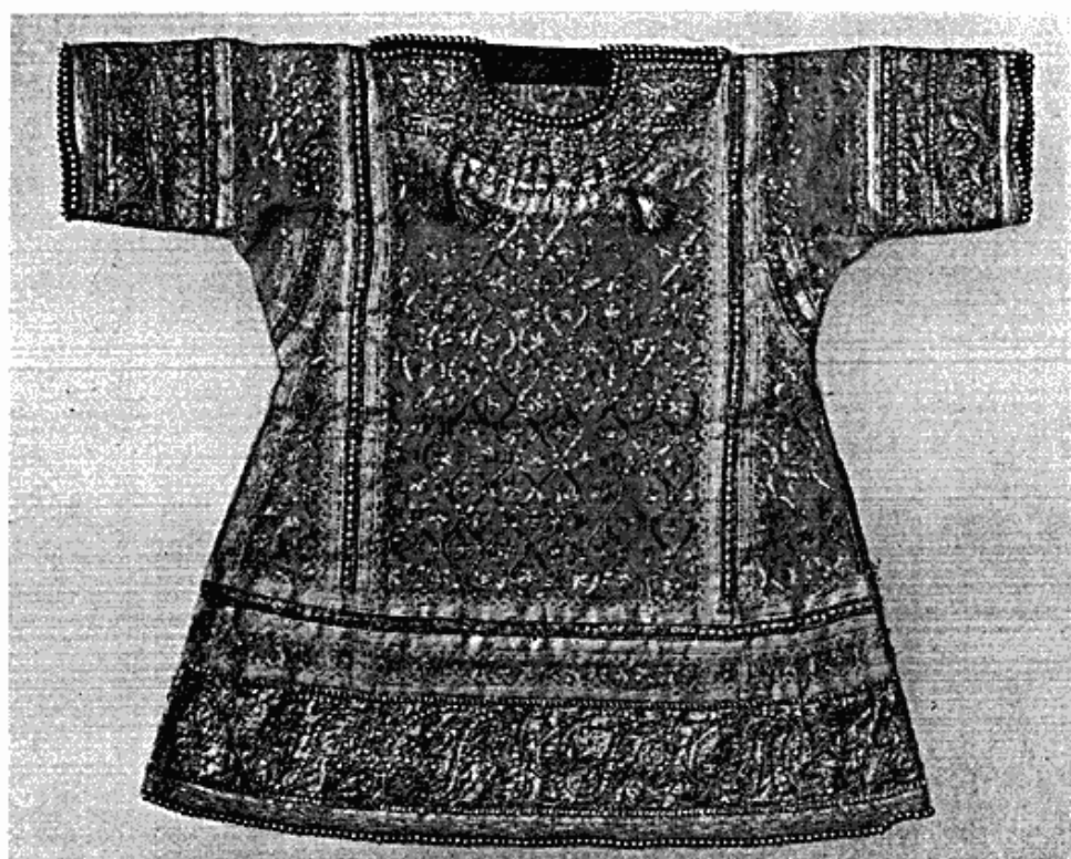
Fig. 3. Guldbroderet barnedragt fra Madras, Indien.

rejst over en buddhistisk relikvie, der er opført i sidste halvdel af det 8. århundrede e. Chr. og nu, skønt en ruin, udgør Javas største og skønneste mindesmærke fra den tid, da hinduisme og buddhisme satte deres præg på øen. De to andre stykker stammer ligeledes fra Javas middelalder, nemlig et par relieffer fra Prambanam, der var de hindu-javanske kongers residens 860—915 e. Chr. Alle tre kunst-