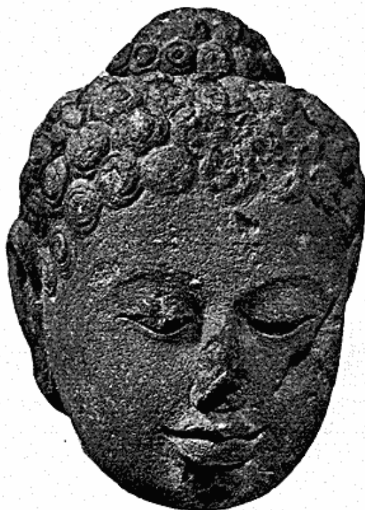
Fig. 1. Buddha-hoved fra slutningen af 8. årh. e. Chr. Borobudur, Java. (Gave fra Ny Carlsbergfondet).

Som før nævnt har H. K. H. Prins Peter med vanlig interesse og sagkundskab fortsat sine indkøb af tibetanske sager i Kalimpong,