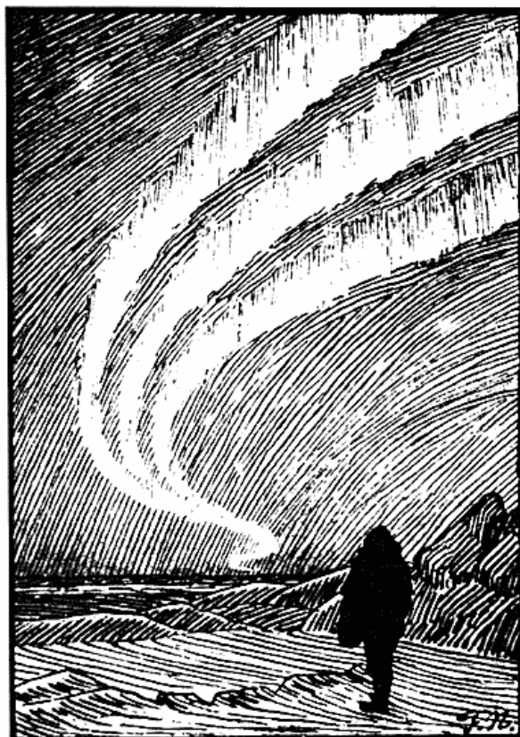
Fig. 2. Nansen-tegning af Johansen uden for vinterhulen en polarlys nat.

Nansen var lige ved tres år og var i gang med havforskning med henblik på norsk erhvervsfiskeri. Han lod sig overtale, og hans indsats reddede millioner af mennesker