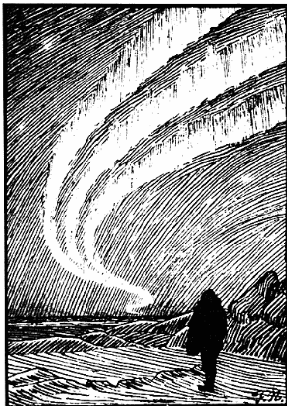
Fig. 2. Nansen-tegning af Johansen uden for vinterhulen en polarløst nat.

Nansen var lige ved tres år og var i gang med havforskning med henblik på norsk erhvervsfiskeri. Han lod sig overtale, og hans indsats reddede millioner af mennesker