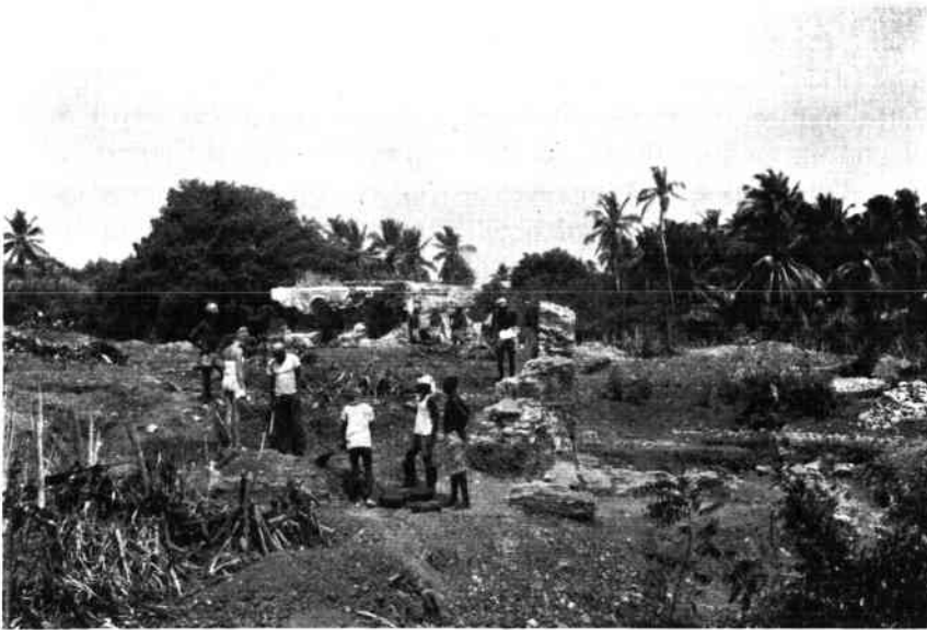
Fig. 2. Fra udgravningerne ved fortet Fredensborg. Disse udgravninger gennemførtes af stud. mag.erne Claus Malmros og Nanna Noe-Nygaard.

Fig. 2. A view of the excavations at the fort Fredensborg near Ningo, Ghana.