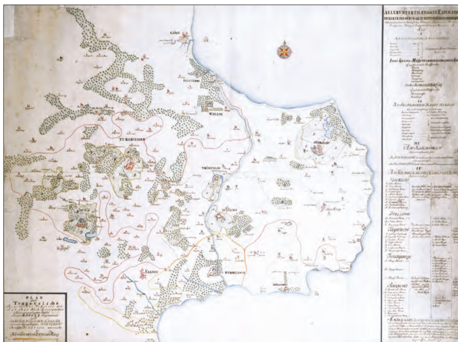
Fig. 5: Willars Rytterdistriktkort over Tryggevælde, 1722, var blandt kortene i samlingen fra Vilh. Borgens arvinger (Det Kongelige Bibliotek, Kort- og Billedafdelingen).

geografiske biblioteker i Århus og Ålborg er også nedlagt og i enkelte tilfælde er overført kort eller atlas biblioteket ikke havde i forvejen.