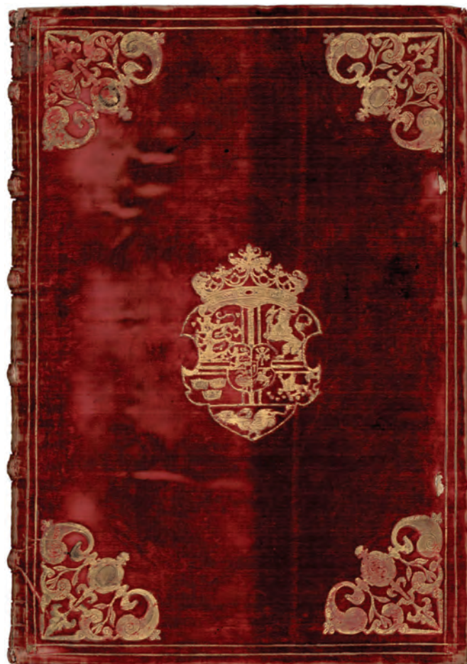
Fig. 2: Waghenaer: Speculi marini , 1586. Specialudgave med rødt fløjls og særligt fine koloreringer udfærdiget til Frederik 2. (Det Kongelige Bibliotek, Kort- og Billedafdelingen).

Udover Civitates -bindet, som vi ved stammer fra Frederik 2., findes et andet værk med særlig dedikation til kongen, nemlig Lucas Janszoon Waghenaer: Speculum Marinum , Leiden 1586. Anden del er i en speciel indbinding med rødt fløjls og nogle fantastiske håndkoloreringer af de enkelte kort. 8