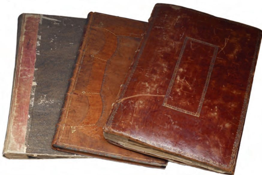
Fig. 4: Fra venstre mod højre: Holsteins Atlas , Frederik 5. Atlas og Atlas Major (Det Kongelige Bibliotek, Kort- og Billedafdelingen).

livet. Ved hans død forelå en kortsamling bundet ind i 55 bind på i alt 3535 kort. Mange var håndtegninger enten som forlæg for trykte kort eller håndtegnede kort der aldrig blev stukket. Atlasset har været kendt i biblioteket lige siden dets indlemmelse engang efter kongens død i 1766. I den systematiske katalog, der blev påbegyndt i 1817, er det således kun dette atlas der figurerer og ikke de tidligere nævnte atlas fra Holsteins samling.