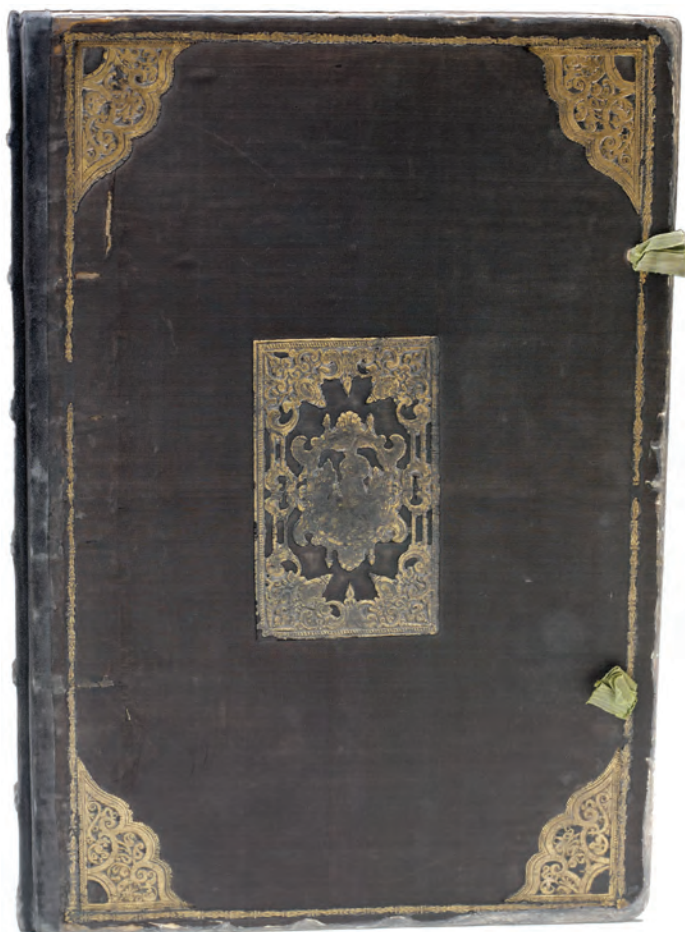
Fig. 1: Braun & Hogenberg: Civitates Orbis Terrarum vol. IV, 1588. Specialudgave dedikeret Frederik 2. Indbundet i sort fløjl, da monarken døde inden overrækkelsen.

Det Kongelige Bibliotek har en udgave af Gerhard Mercators atlas, 7 hvori rækkefølgen er helt speciel. Mercators sønner skrev en helt speciel dedikation til Henrik Rantzau i forordet til bindet hvori Henrik Rantzau takkes og berømmes for sin deltagelse i værket. I denne udgave findes denne del forrest uden at det er bevis på tilhørsforholdet til Rantzaus bibliotek.