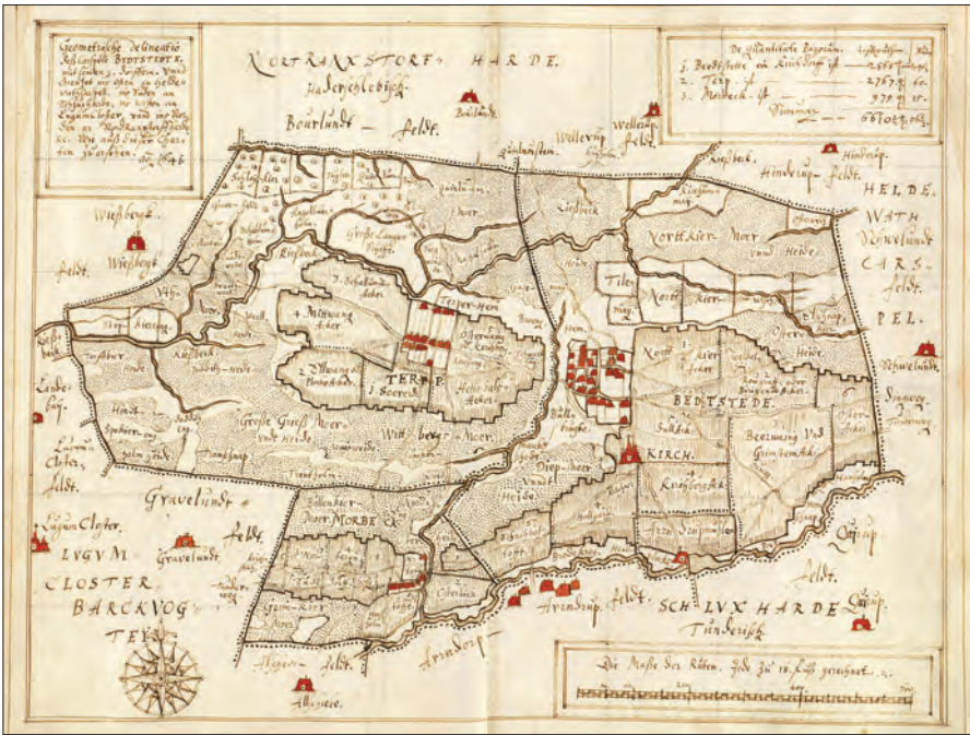
Fig. 3: Johannes Mejer: Kort over Slesvig, 1642. Afleveret til Frederik 3. (Det Kongelige Bibliotek, Kort- og Billedafdelingen).

delingen, men enkelte kort heriblandt hans kort over hele Danmark ligger i Kort- og Billedafdelingen.