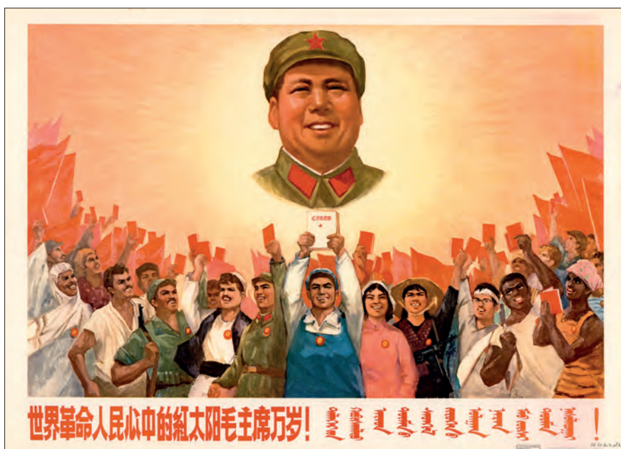
Fig. 1. "Alle revolutionære folk i verden ønsker af hele hjertet den røde sol, formand Mao, et langt liv!". Titel både på kinesisk og mongolsk. Hohhot, 1969. (OA 102-2007-pl. 2).