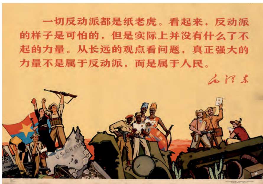
Fig. 11. "Alle reaktionære grupper er papirtigere" (citat fra Mao Zedong). Shanghai, 1967. (OA 102-2010-pl. 7).

Mao som solkonge blev ligeledes anvendt på de røde omslag på bøger med Maos skrifter og i Mao-emblemerne, som alle rødgardister skulle bære synligt på tøjet. En anden, måske lidt mindre populær form for Mao-plakater var gengivelser af hans citater i hans egen kalligrafi. De blev som regel gengivet i rødt på hvid baggrund, således at rødgardisternes røde farve fik budskabet til at stå ekstra stærkt frem. En anden metode til at fremhæve Maos person var at udgive plakater, hvor Maos fødested i 韶山 (Shaoshan) optræder enten i form af et gengivet fotografi eller som et maleri med eller uden beundrende tilskuere.