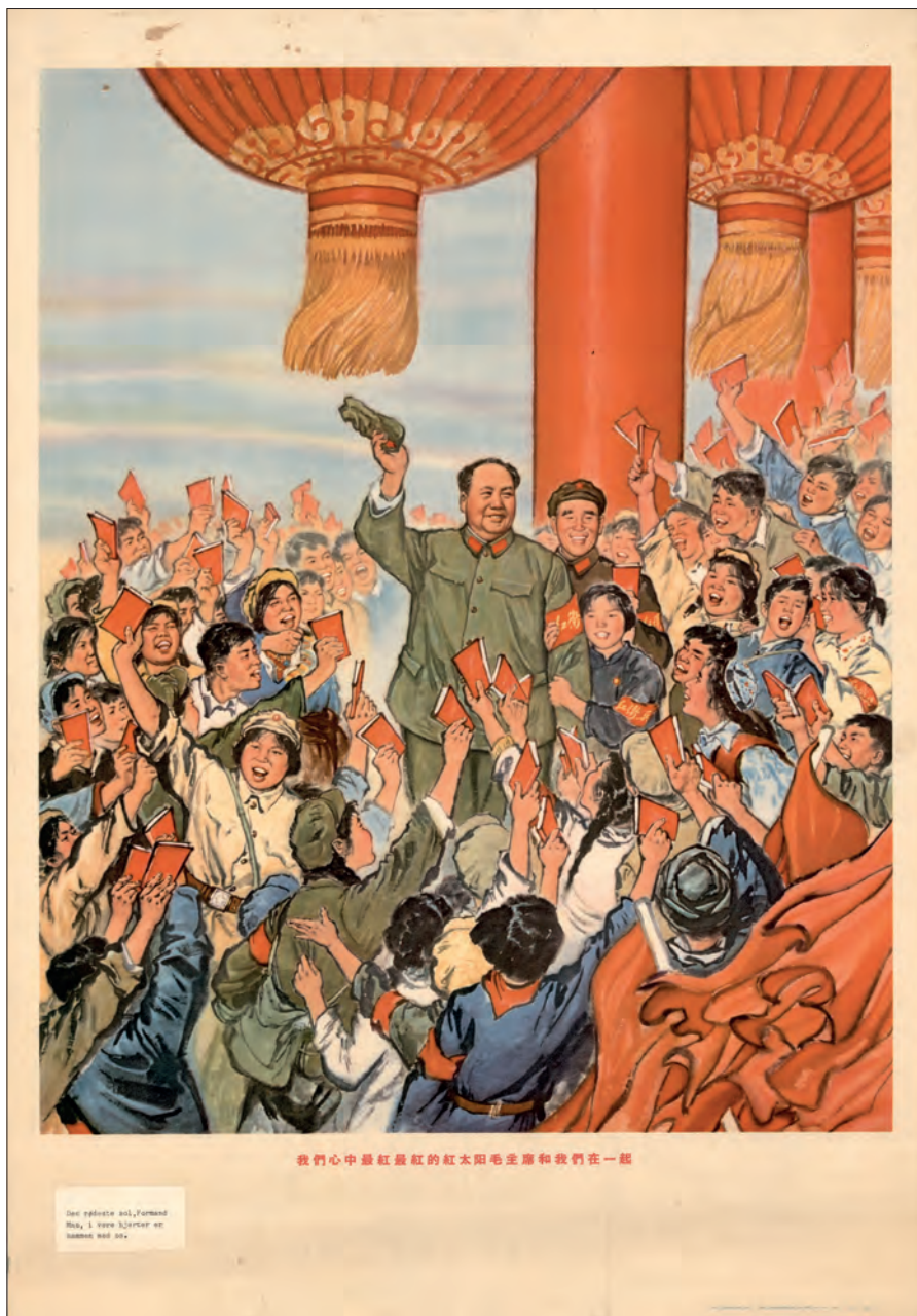
Fig. 12. "I vore hjertes er den røddeste sol, formand Mao, sammen med os!". Kunstners navn er ikke oplyst. Hangzhou, 1968. (kob-kin-pl. 66).