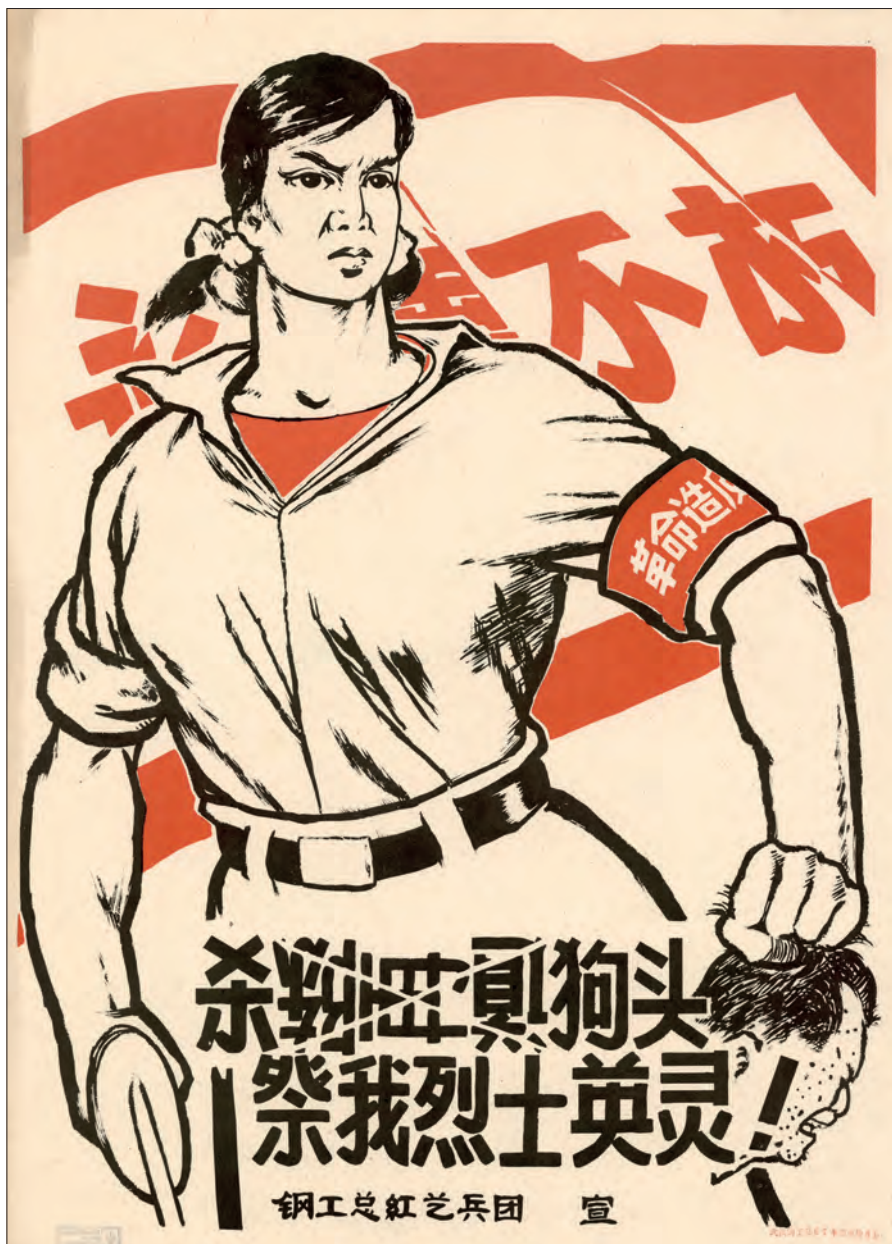
Fig. 7. "Dræb Guo Zaidao, der med sine usle handlinger ofre vor martyrs ånd". Guo Zaidao (1909-1993) var en general, der militært gik imod rødgardisternes udskjelser i Wuhan juli 1967. (OA 102-2005-pl. 1).