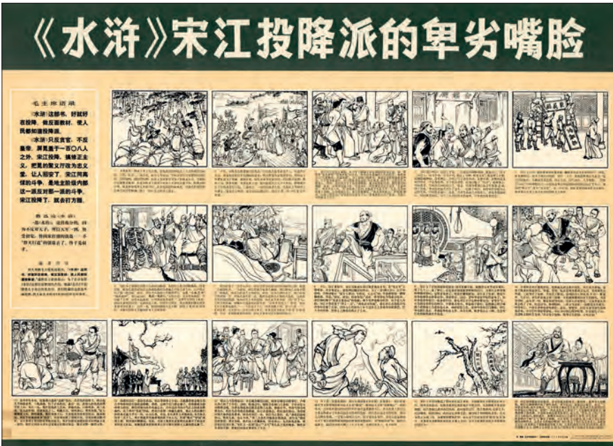
Fig. 16. "I 'Shuihu' afslører Song Jiang de kapitulerede gruppers beskidte kneb". Del af tegneserie fra en berømt historisk heltebog. Redigeret af Ren Mei. Beijing, 1975. (kin-pl. 78).

Selvom den kaotiske tid under rødgardisterne var forbi led udviklingen af landbruget og industrien stadig under dårlig vejledning og ringe organisering. Derfor mente partiets ledelse at man skulle starte en ny kampagne – denne gang dog ikke som et 'stort spring fremad' som tidligere. I stedet udvalgte man to byer, der skulle stå som mønster for henholdsvis landbruget "大寨" (Dazhai) fra 1972 og industri, oliebyen "大庆" (Daqing) fra 1971. Mange plakater fik slogan som "Landbrug, studér Dazhai!" og "Industri, studér Daqing!" eller "Arbejdere, bønder og soldater, studér Dazhai og Daqing!". Man udgav dog også andre typer af patriotiske plakater i form af navngivne helte eller dydige borgere. Det blev ofte gjort gennem en tegneserieagtig opsætning enten i form af en serie plakater, hver med et motiv fra heltes liv, eller som en serie med seks til otte billeder pr plakat. Som regel er der en titel øverst og billedtekster under hvert enkelt billede. En sådan serie kunne bestå af en til seks plakater. De fleste af denne type af plakater