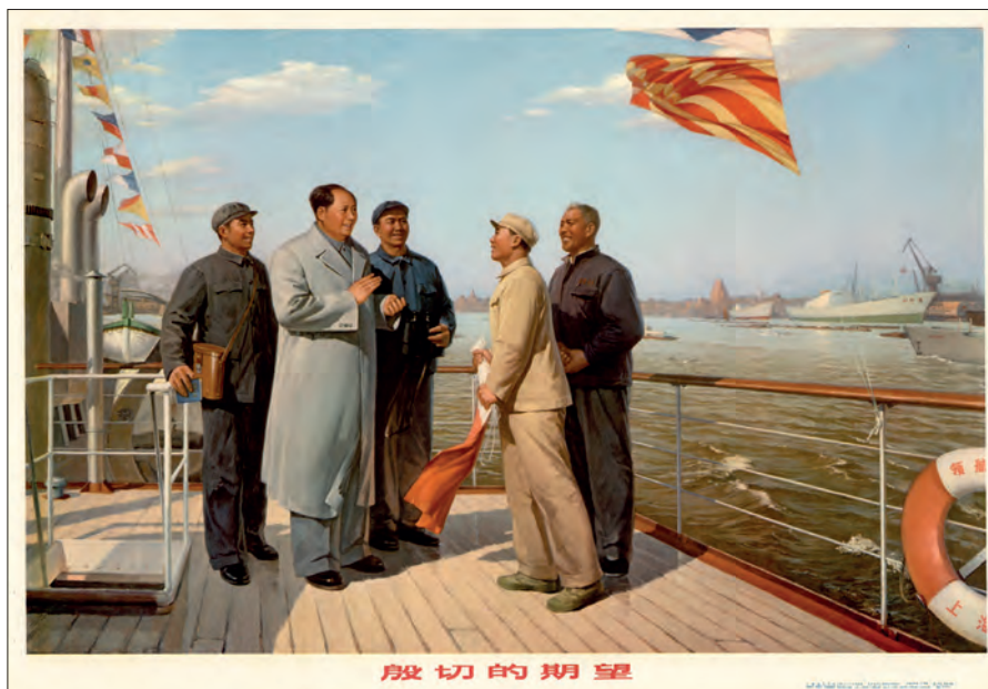
Fig. 20. "Det store håb". Gengivelse af et maleri af Sun Xikun, Shen Zhaorong og Zhai Zuhua. Shanghai, 1973. (kin-pl. 27).

Der var ligeledes plads i produktionen af plakater til instruktions- eller informationsformål. Denne type af plakater er designet som en plakat, ofte med en blanding af fotografier og tegnede billeder. Det kunne f.eks. være instruktioner i svømning eller taiji øvelser, hvor man illustrerer rækkefølgen af bevægelserne. Det kunne også være små fotografier eller tegninger placeret enkeltvis omkring en central genstand for instruktionen som f.eks. om anvendelsen af insektgift i landbruget. En plakat fra 1973 har en kinesisk gris aftegnet i farver i centrum på en hvid baggrund. Omkring grisen er alle de produkter man kan fremstille af en gris placeret i grupper på en beigefarvet baggrund. Produkterne spænder fra spiselige produkter til hårbørster, gødning og skind. Alle produkter er illustreret i farvelagte tegninger. Nogle plakater blev udgivet i en lille serie på to til otte ark, hvor man f.eks. informerede om magnetisme, olieraffinaderi og vandkraft. En mere propagandistisk informationsplakat ser man f.eks. i form af opfordring til fødselskontrol. På en plakat fra 1974 er baggrundsfarven rødlig lilla, teksten øverst i små tegn er i gul mens titlen med hovedbudskabet ("Støt revolutionen gennem planen for fødselskontrol!") er i hvidt. I midten af billedet står