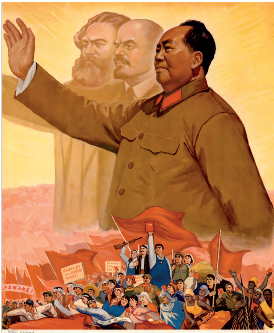
Fig. 14. "Længe leve de sejrriige marxistiske, Leninistiske og Maoistiske tanker". Beijing, 196-? (OA 102-2010-pl. 19).

lighed som Lu Xun (1881-1936), der var betydningsfuld i udviklingen af den moderne kinesiske litteratur. Den portrætterede person kunne også være en udlænding, der havde tjent den kinesiske kommunistiske sag før den endelige overtagelse af magten i 1949. En sådan person var