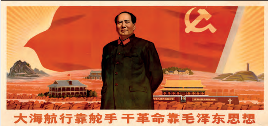
Fig. 3. "På det oprørte hav lader vi os styre af en rorgænger – ligesom vi støtter os på Mao Zedongs tanker i revolutionen". Beijing, 197?- (OA 102-2007. pl. 19).

I samlingen er der et eksempel som er sammensat af tre delplakater. Den viser formand Mao Zedong stående foran det kinesiske flag og nogle bygninger, som er vigtige i den kinesiske revolutionshistorie. Disse bygningsværker er placeret på hver side af Mao i et imaginært landskab med lysende solstråler i baggrunden.