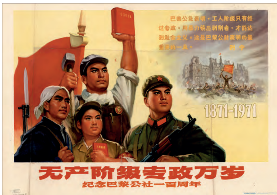
Fig. 15. "Længe leve proletariatets diktatur". Beijing, 1971. (OA 102-2010-pl. 5).

Opbygningen af en plakat var ofte meget enkel med gengivelse af et allerede eksisterende billede påført et eller flere slogans, inde i billedfladen eller udenfor, som regel nederst på plakaten. Nogle plakater havde dog en lidt mere kompliceret opbygning, hvor f.eks. en gruppe bestående af en bonde, en arbejder, en ung kvindelig soldat og en mandlig soldat står foran en rød fane, der dækker billedfladen fra midten til venstre side. I øverste højre hjørne gengives et socialrealistisk billede fra Pariserkommunen 1871 holdt i grå, brune og hvide toner bortset fra en rød fane midt i scenen. En gul tekst over billedet af Pariserkommunen forklarer kort om den tidlige revolutionære kamp. Udformningen af denne plakat forsøger at skabe et visuelt budskab for at underbygge ideen om et forenet folk, der står sammen og forsvare socialismen. Teksten forneden og udenfor motivet er i oversættelse: "Længe leve proletariatets diktatur – erindringen af 100 årsdagen for Pariserkommunen".