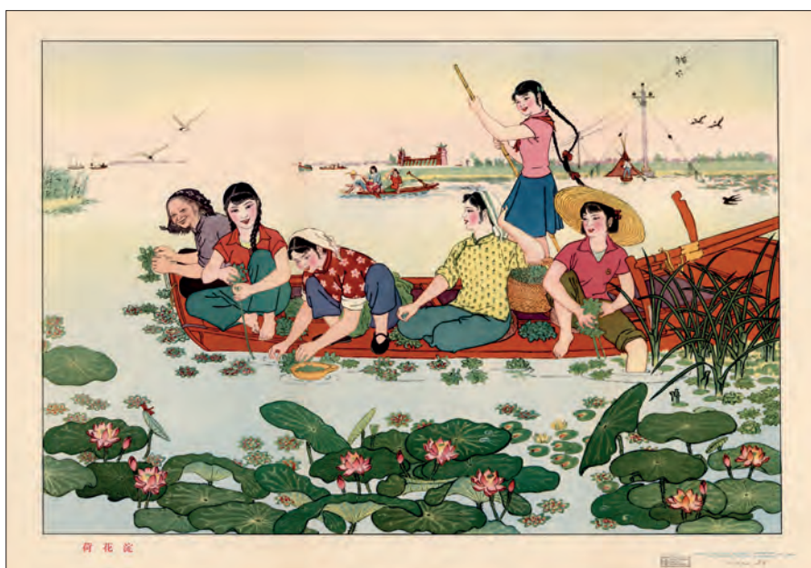
Fig. 6. "Lotusplantning" Maleri i 'Nytårstryk stilen' af Zhao Xinfang (1927-). Shijia zhuang, 1964. (OA 102-2006-pl. 14).

Udviklingen af samfundet efter "Det Store Spring fremad" fortsatte i et roligt tempo. Dette afspejlede sig også i plakater, der dels viste glade børn og voksne i idylliske landlige omgivelser og dels angav en revolutionær ånd. Motiverne koncentrerede sig om at vise de gode resultater af et socialistisk liv eller det gode samspil mellem medlemmerne af det socialistiske samfund.