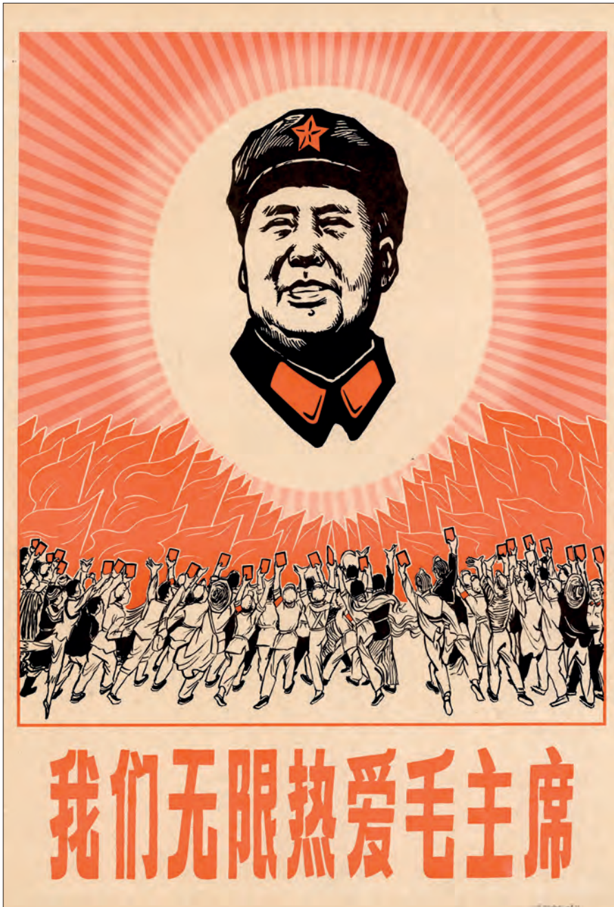
Fig. 10. "Vi elsker formand Mao grænseløst". Beijing, 1971-? (OA 102-2004-pl. 4).