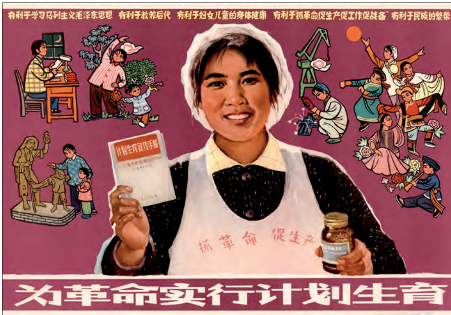
Fig. 19. "Støt revolutionen gennem planen for fødselskontrol!". Shanghai, 1974. (kinpl. 13).

i luften. Forneden til venstre ses iturevne skrifter, som er ved at blive skovlet og fejlet væk. Skrifterne symboliserer Konfucius' og Lin Biaos uønskede ideer. Budskabet kan næsten ikke blive mere stærkt. En anden type plakat fra samme kampagne viser grupper, der er aktive i at kritisere Konfucius og Lin Biao, men altid med én til tre personer som fokuspunkt. I samlingen er denne type repræsenteret med en plakat, hvor en ung mand med rygsæk og skuldertaske går aktivt frem. Hans venstre arm strakt frem så at hans håndflade hviler over en hob papirer og et hoved af Konfucius. Både papirbunken og Konfucius er gengivet i sort og hvidt mens hovedfiguren er sepiafarvet. Bag ham ses to grupper af mennesker der deltager i diskussionsmøder, hvor Konfucius og Lin Biao kritiseres. Motiverne er tegnede og er ligesom hovedpersonen holdt i sepia. Desuden er der et lysindfald fra venstre, som giver en hvid stribe hen over nederste del af billedfladen og næsten visker detaljerne på den unge mands frakke ud. Lyset må symbolisere resultatet af kampagnen: ud med de kontrarevolutionære. Dette er produceret direkte til plakatbrug og er ikke en afbildning af et maleri.