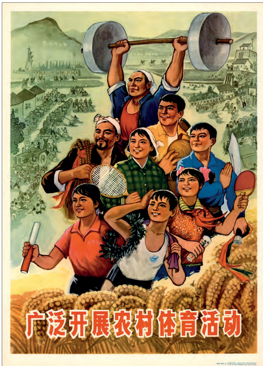
Fig. 21. "Lad os udvikle de fysiske aktiviteter i landsbyerne". Gengivelse af et Huxian bondebillede af Zhao Kunhan. Beijing, 1975. (kin-pl-72).