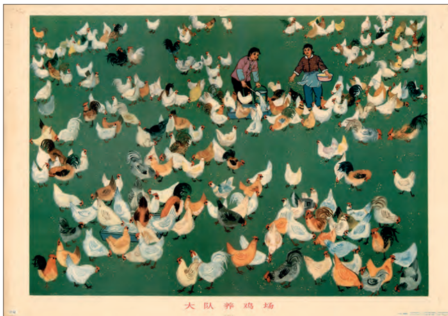
Fig. 17. "Produktionsbrigadens hønsegård". Gengivelse af Huxian bondemaleri. Beijing. 1973. (kob-kin-pl. 49).

smalle og aflange billedruller beregnet til ophængning. Motiver, der blev tilladt, gengav altid i de skønne naturomgivelser mindst én ting, der viste samfundets fremgang, som f.eks. en bro over en kløft, højspændingsmaster, en gruppe bønder på vej til arbejde med en rød fane blafrende i luften. Andre plakater fra 1974 viser ligeledes idylliske situationer enten med personer i harmonisk samvær med hinanden f.eks. en fader, der sidder hjemme ved spisebordet med nogle arbejdstegninger sammen med sine to lykkeligt legende børn. De kan også portrættere grupper af personer, der udstråler tilfredshed med deres arbejde: en skolelærer, der underviser børn eller en kvindelig barfodslæge, der vaccinerer glade børn. Også lykkelige og glade arbejdere i fuld gang med deres opgaver var hyppigt anvendte motiver.