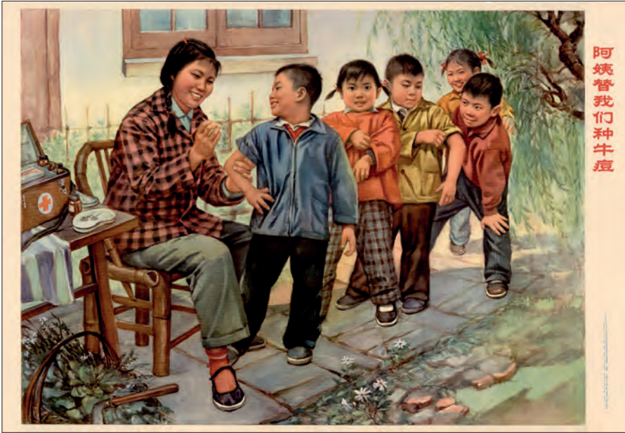
Fig. 27. "Sygeplejersken beskytter os mod kopper". Gengivelse af maleri af Ma Yuequn. Shanghai, 1974 (kin-pl. 41).

alene, ses de oftest i gang med at vedligeholde, reparere og høste eller i lettere industriarbejde som f.eks. i tekstilproduktionen. 5