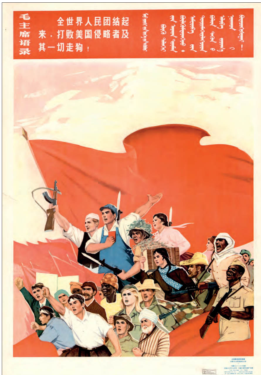
Fig. 2: Forskellige folkeslag synger revolutionære sange. Første plakat i serien: "Bil- leder med folkets luftforsvar" udgivet af forsvarskommissionen i Det Indre Mongoliet. Hohhot, 1973. (OA 102-2006 pl. 1).