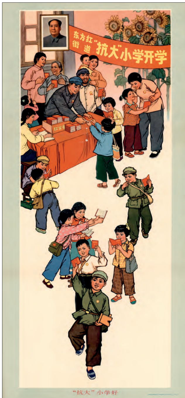
Fig. 13. “Lad os rigtigt studere ‘Kangda’ skolens resultater”. Kunstnerens navn er ikke oplyst. Jinzhou, 1971. (OA 102-2005-pl. 5).