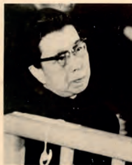
Fig. 28. “Biografi over Jiang Qing”. Beijing, 1981. (OA 102-2010-pl. 14).