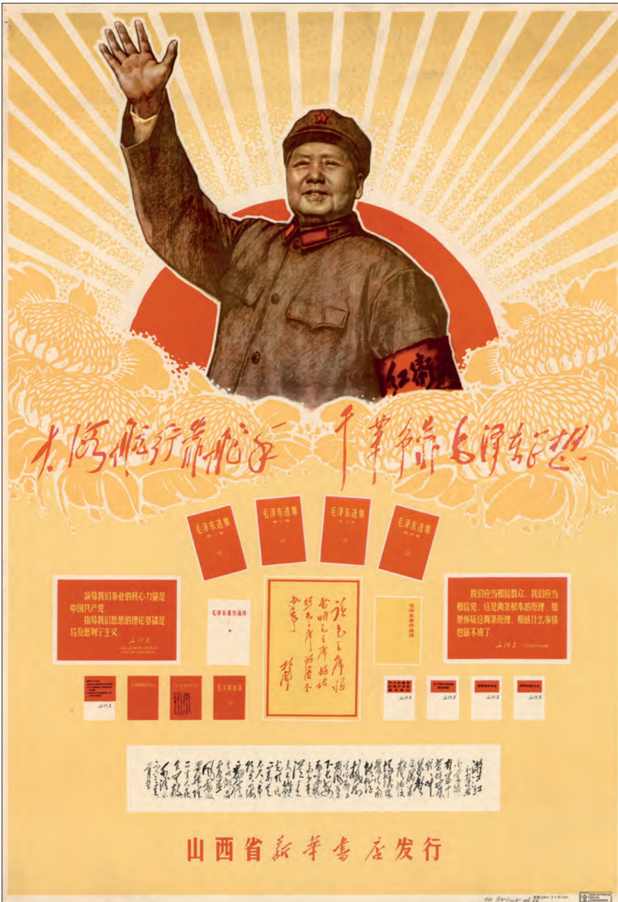
Fig. 9. "På det oprørte hav lader vi os styre af en rorgænger – ligesom vi støtter os på Mao Zedongs tanker i revolutionen". Taiyuan, 1968. (OA 102-2007-pl. 27).