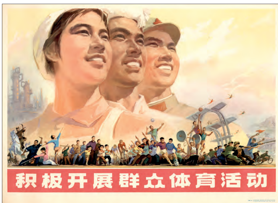
Fig. 22: "Deltag positivt i udviklingen af fysiske øvelser". Formgivet af Wang Chunyan. Beijing, 1975. (kob-kin-pl-112).

En anden form for placering af delelementer ses på plakater, hvor personer i forgrunden, ligesom titelbåndet, er gengivet i klare, realistiske farver, men i lille format. Resten af billedfladen er så forbeholdt store motiver eller personer gerne holdt i lidt svagt tonede farver. Dette giver en balance mellem de aktive i forgrunden og de store mere passive elementer i mellem- og baggrunden. De store figurer svæver over de små figurer, og de kan ses som en slags skyggebilleder af forgrundens fysiske anstrengelser. Man kunne sige at de afspejler essensen af mange menneskers bestræbelser. Dette kan ses i en plakat fra idrætsbevægelsen fra 1975.