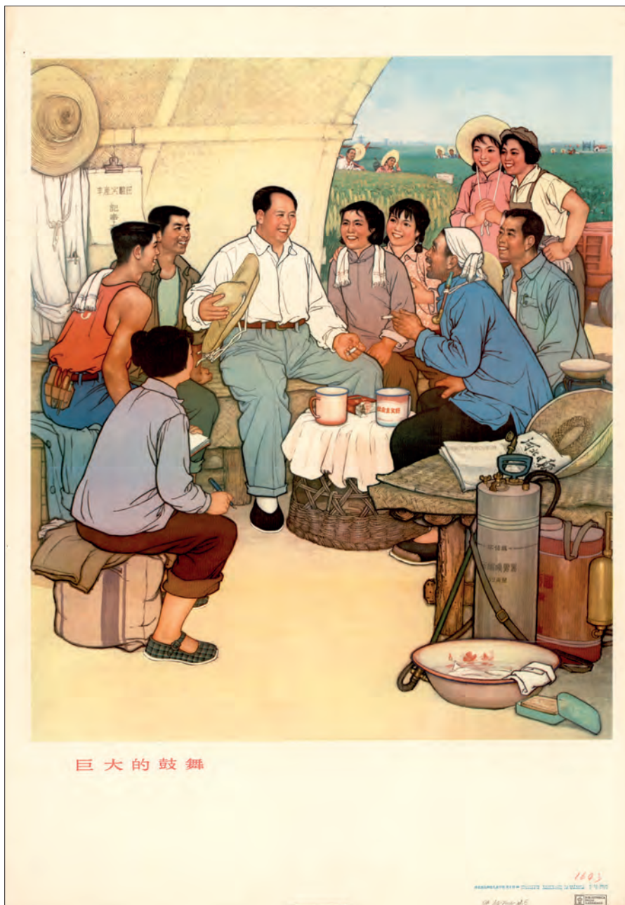
Fig. 24: "En fantastisk inspiration". Shijia zhuang, 1973. (OA 102-2006-pl. 5). Dette er en gentagelse af et billede med Mao i samme situation som fig. 23.