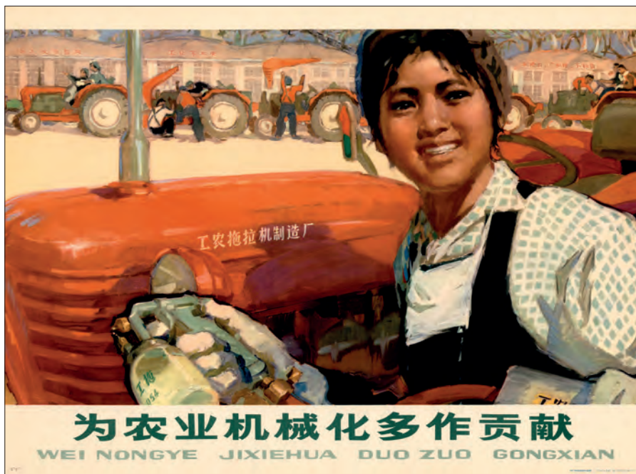
Fig. 26. “Mekaniseringen af landbruget yder stor nytte”. Beijing, 1973-? (kob-kin-pl. 134).

ganske enkelt at kvinder ikke evnede at bestride vigtige stillinger, da de naturligt var svagere, mindre intellektuelle og kreative end mænd. Desuden havde de en tendens til at have et vekslende følelsesregister. Dette afspejlede sig mere eller mindre tydeligt i den måde hvorpå de blev gengivet på plakaterne. De fleste portrætterede kvinder er unge, ved godt helbred, stærke og de foretager sig maskuline ting og er besluttsomme. Under kulturrevolutionsperioden er kvinderne endda klædt og fremført som mænd. Alligevel er ligestillingen kun overfladisk og i perioden op til 1966 så man gerne kvinder og pigebørn som feminine væsner, der udfører let arbejde eller assisterer mænd. I den første del af kulturrevolutionsperioden kom kvinderne mere frem på plakaterne som vigtige aktører bl.a. pga. deres meget aktive adfærd indenfor rødgardisterne ligesom Jiang Qing også steg i graderne indenfor partiet. (opfordring til at dræbe en general der er imod nogle rødgardister (se fig. 7). Dog bliver kvinderne stadigvæk afbildet som assistenter, eller under en myndig mands overvågning. Selv i plakater, hvor kvinder står