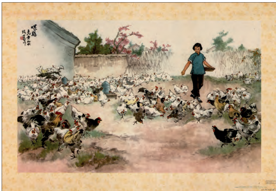
Fig. 5. "Fodring af høns". Guohua-maleri af Zhang Shijian (1926-). Shijia zhuang, 1961. (OA 102-2006-pl. 13).

Der er en hårfin balance mellem ønsket om at videregive informationer eller instruktioner og propaganda. En plakat fra 1960 viser en ung mand gøde en rismark og i baggrunden ses en ung kvinde sprøjte insektgift. Kvindens placering hentyder til at manden har den dominerende rolle i samfundet. Teksten er i hvidt og placeret inde i selve billedet øverst til venstre i samme plan som den unge kvindes sprøjte