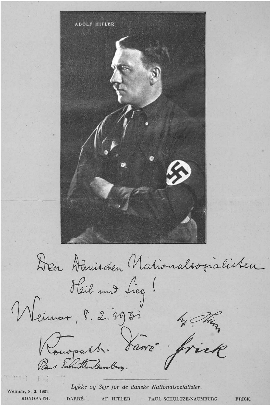
Fig. 1: Foto af Hitler med dedikation til de danske nationalsocialister. Hagekorset , 1. årg. nr. 7, 1931, s. 1