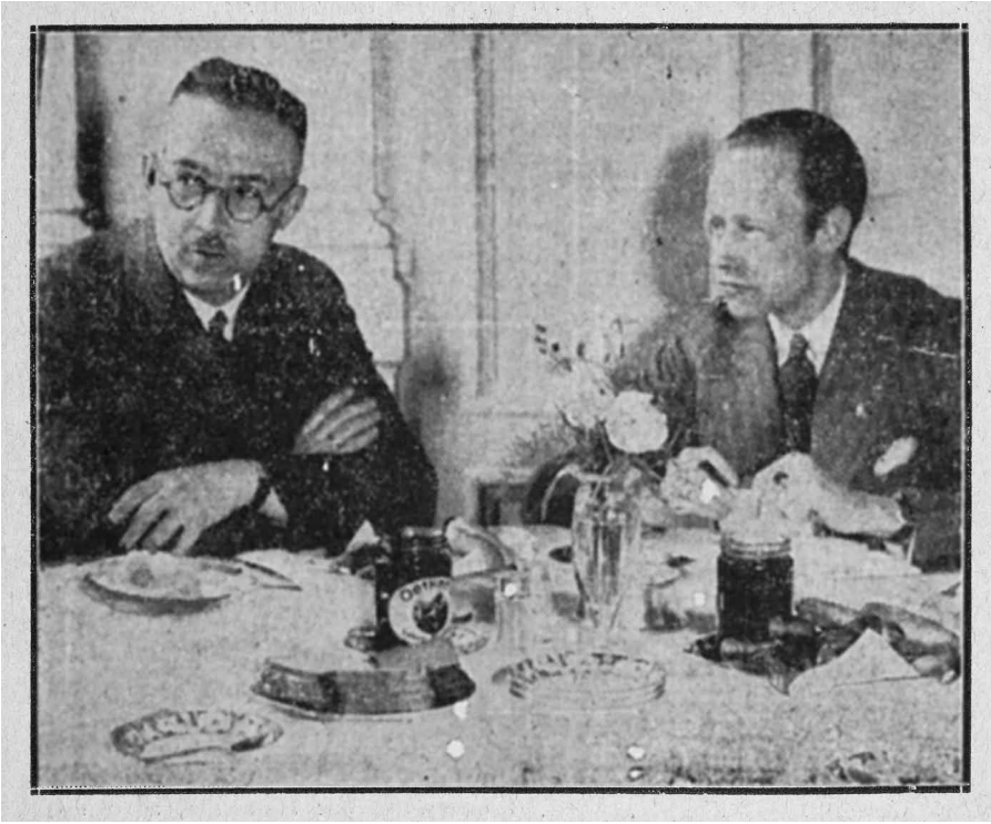
Fig. 4: "Vor udsendte Korrespondent interviewer den øverste S.S. Fører, H. Himmler ved Morgenkaffen paa 'Kaiserhof'." Fyens Stiftstidende 11.4.1932.

maa man ikke umiddelbart overføre tysk Nazisme på udenlandske Forhold. Den bærende Ide vil højst sandsynlig vinde Indpas udenfor Tysklands grænser, men paa nationalt særpræget Grundlag for hvert enkelt Land. For de nordisk prægede Lande er Nazismen naturlig, som Fascismen har været det for Italien og Polen."