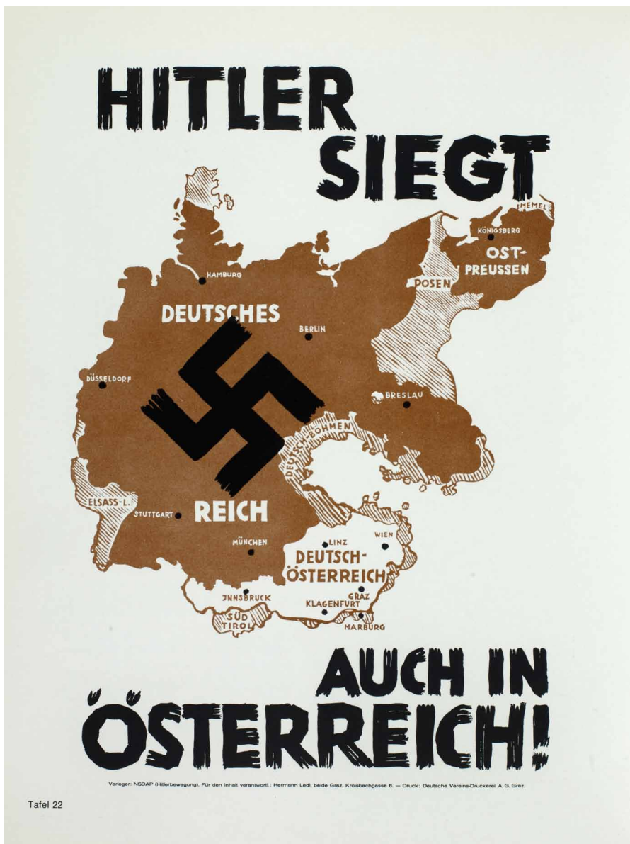
Fig. 3: "Hitler siegt auch in Österreich!". Propagandaplakat 1930. Gengivet efter Ludwig Jedlicka & Rudolf Neck (Hg.): Vom Justizpalast zum Heldenplatz. Studien und Dokumentationen 1927 bis 1938 , Wien 1975, Tafel 22. Det var ikke kun i Østrig, at Hitler skulle sejre, men også bl.a. i Sønderjylland, hvis det stod til såvel de østrigske som de overbeviste nazister i det tyske mindretal i Sønderjylland.