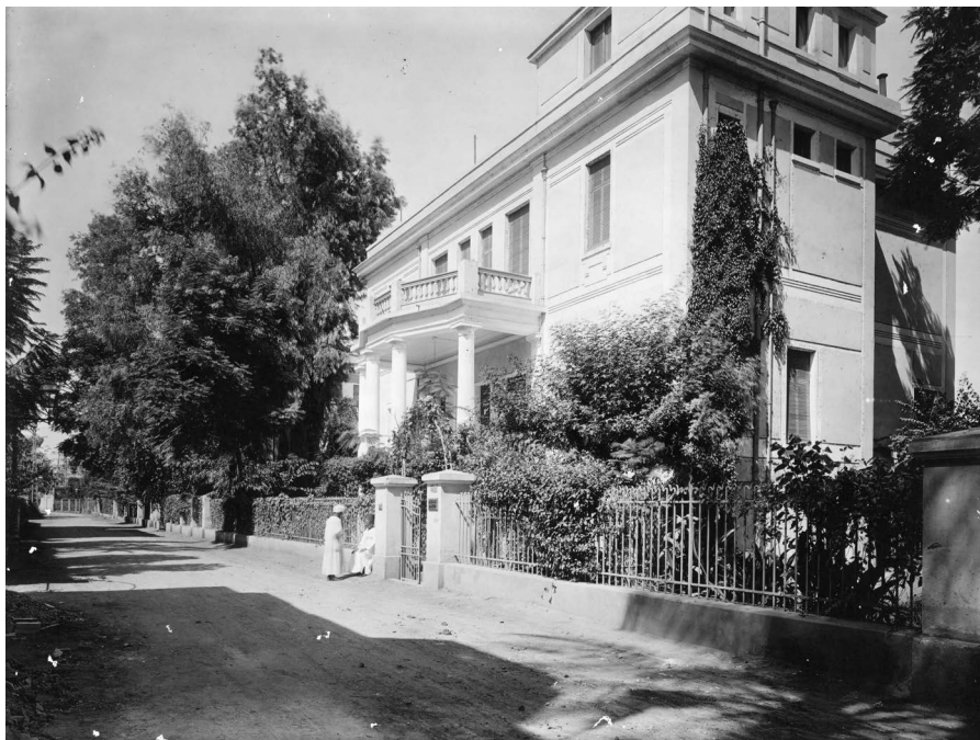
Ludwig Borchardts institut i Kairo-bydelen Zamalek. Bygningen rummede tidligere ‘Kaiserlich Deutschen Instituts für Ägyptische Altertumskunde’ (idag ‘Schweizerisches Institut für Ägyptische Bauforschung und Altertumskunde in Kairo’).

rigsminister P. Munch, og dagen efter fulgte en længere redegørelse til Munch om Borchardt og Langes forhold til kollegaen. Lange var ikke i tvivl om tilbuddets betydning: