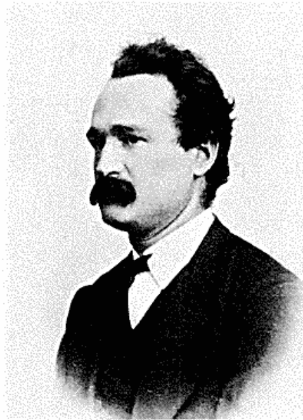
Theodor Philipsen fotograferet ca. 1872 af Offenbergh i Amsterdam. Lidt forstørret.