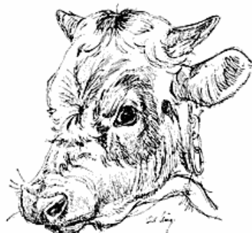
J. Th. Lundbye. Af et studieblad fra Vognserup med ko- og kalvehoveder tegnet den 19.-20.8.1844. Kobberstiksamlingen.

den har levet videre i kunstnerkredse, indtil den unge dyremaler Theodor Philipsen en snes år senere trådte i Lundbyes fodspor. Philipsen kan have hørt den af ældre kunstnerkammerater – han kan endda have hørt den af Høyen selv. Af Karl Madsens bog ved vi, at Philipsen har været i berøring med Høyen. Hvor det i bogens begyndelse omtales, at Philipsen „har set paa Lundbyes ‘Malkeplads’“ tilføjer Madsen: „Han har endog – med Høyens Billigelse – paa Kristiansborg malt en Kopi af Billedets Forgrundsgruppe.“