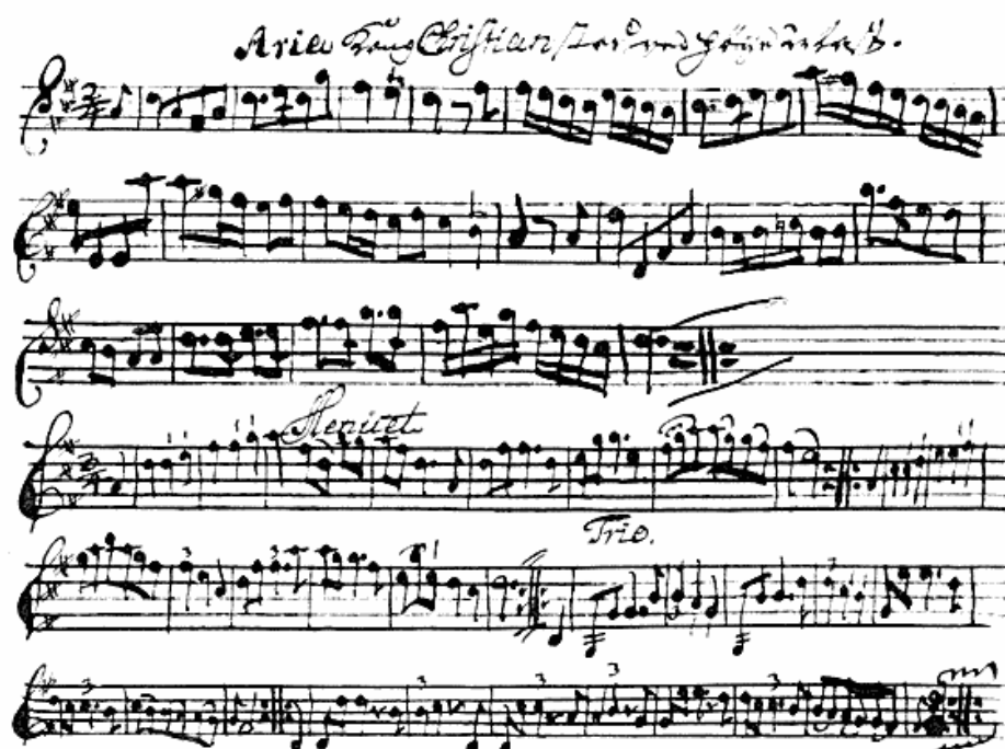
Den håndskrevne melodioptegelse i brødrene Basts nodebog (Kgl. Bibl. C II, 5). Overskrift: Aria Kong Christian stod ved høje Mast . Originalens størrelse: 14,5 × 20 cm.

begyndte sit ophold dør, og at Paul Danchel måske har lagt den til side, efter at han i 1782 var blevet præst i Næstved. Hovedparten af melodierne kan således være indført mellem 1763 og 1782; ved fremtidige undersøgelser over „Kong Christian“-melodien vil det dog nok lønne sig påny at udforske brødrene Basts nodebog: melodierne, de forskellige håndskrifter og optegnelserne i bogen kan sikkert give flere oplysninger fra sig.