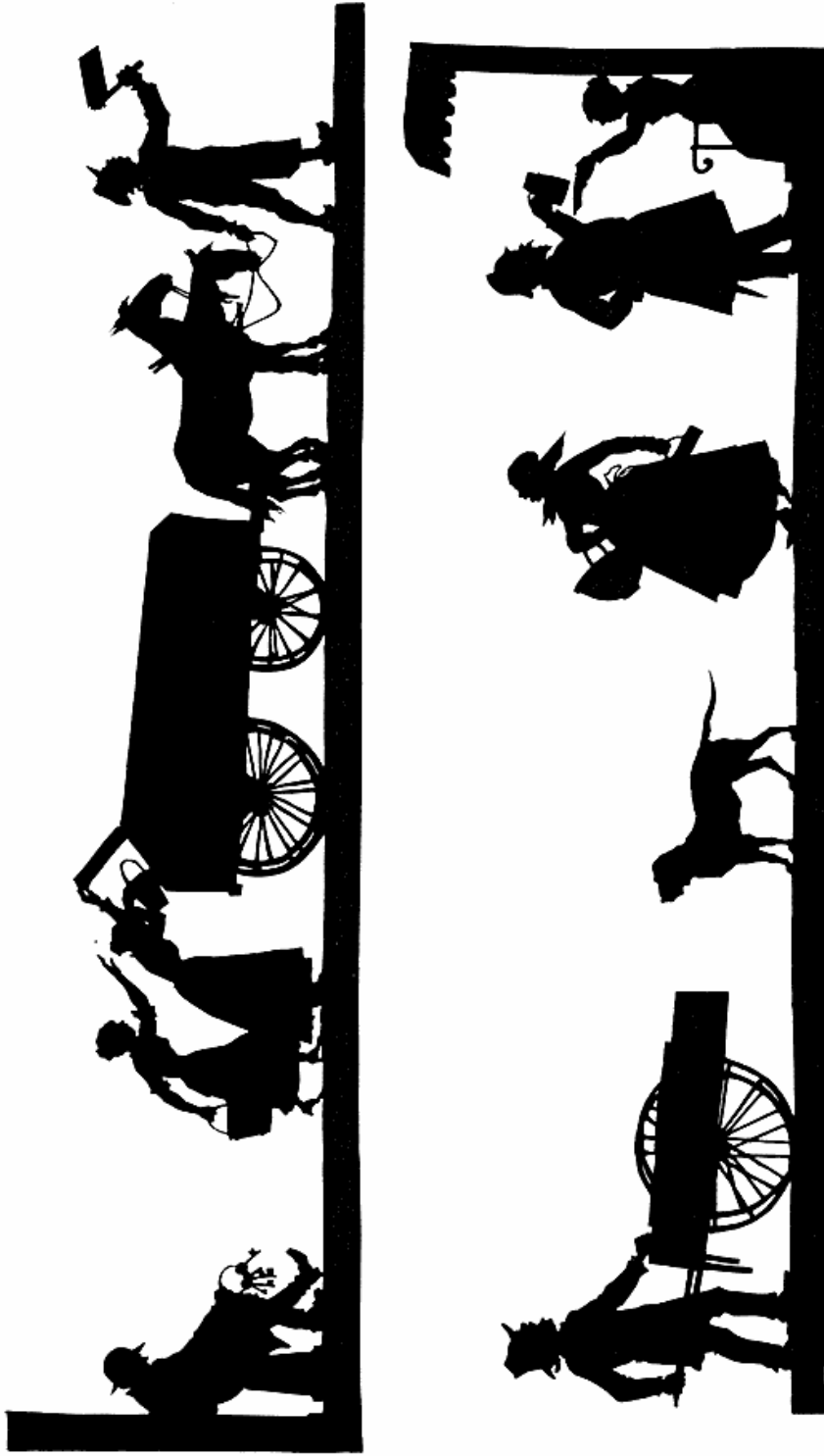
Gadetyper fra firsernes København: Den søvnige portner har lukket op for pigerne, der løber ud på gaden for at tømme spandene i skraldevognen; fra Gammel Strand kommer sildemanden og rejekonen og råber for den store hund, mens gadebejanten får sin øl stukket op fra kælderbevertningen. Illustreret Tidning 13.9.1884.