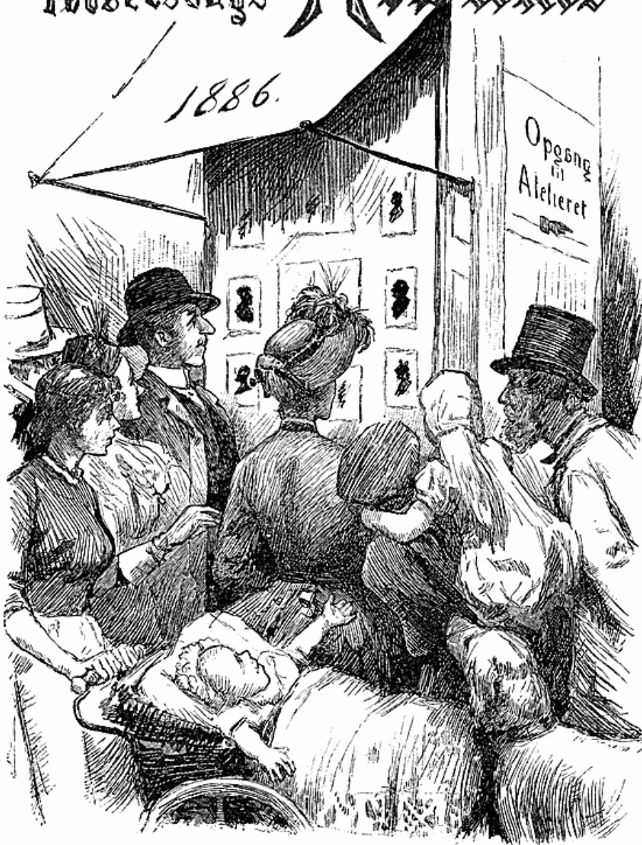
Forsiden af den omtalte attrap. Orig. størrelse.