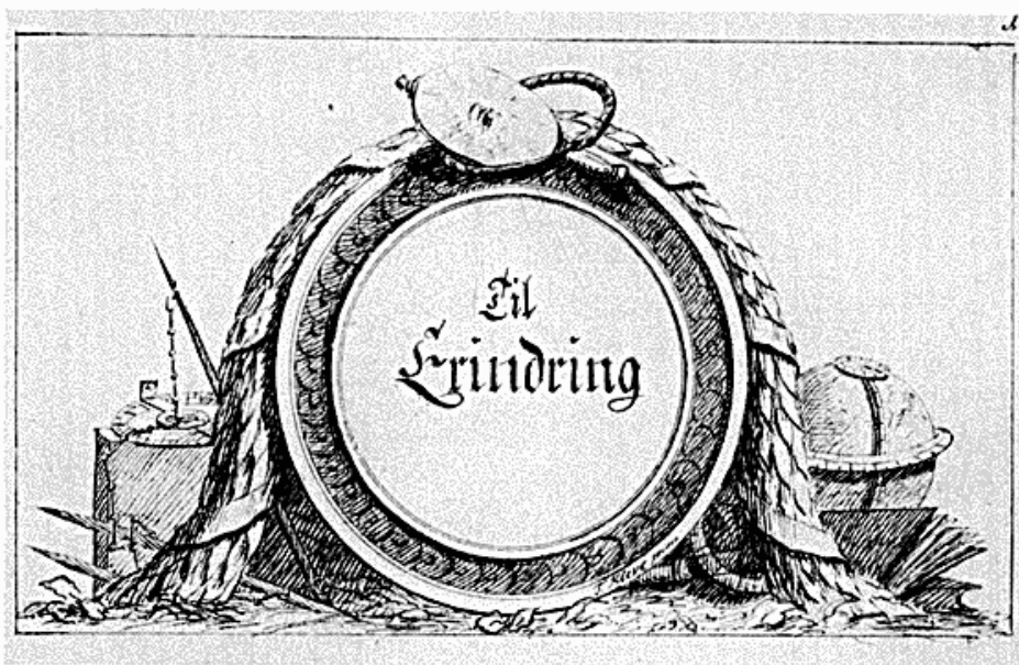
Pennetegning af kobberstikkeren Terkel Kleve, som titelblad til Sejer Olrogs stambog, Ny kgl. Saml. 387 i 8°.

ker ud over landets grænser. Ved overgangen til 1800-tallet forstærkes imidlertid de tegn, som er særegne for poesibøger: en snævrere personkreds og indholdsmæssig ensformighed med ennemæssig begrænsning. Der findes dog stadig enkelte stambøger, hvor den gamle tradition lever videre, men sådanne bliver stadig færre, og fra midten af 1800-tallet får poesibøger, ofte ført af børn, og gæstebøger, hvor fine navnetræk som regel er tilstrækkelige, næsten eneret på at repræsentere denne skik. Kgl. Bibl.s samlinger indeholder også et pænt antal stambøger fra tiden efter 1800, således over 60 påbegyndt i tiden 1801-50. Over halvdelen af dem er ført af kvindelige ejere, de fleste i en ret snæver venne- og navnlig venindekreds. De kan naturligvis også være interessante og afspejler mange samtidsstrømninger, men der er et så langt spring fra dem til de rejsestambøger, som indledte skikken i 1500-tallet, at jeg har valgt efter en rejse på omtrent 250 år at standse her, på tærsklen til romantikken og nationalismen. Da jeg for snart 20 år siden fattede interesse for dette emne, var det på grund af det materiale, disse små bøger indeholder om udenlandsrejser. Ved hjælp af stambøger kan mange oplysninger i universitetsmatrikler og rejseberetninger verificeres og suppleres. Denne motivering falder nu bort, idet stambøgernes udvikling har ført dem ind i en anden problemkreds, som kun en sjælden gang berører udenlands-