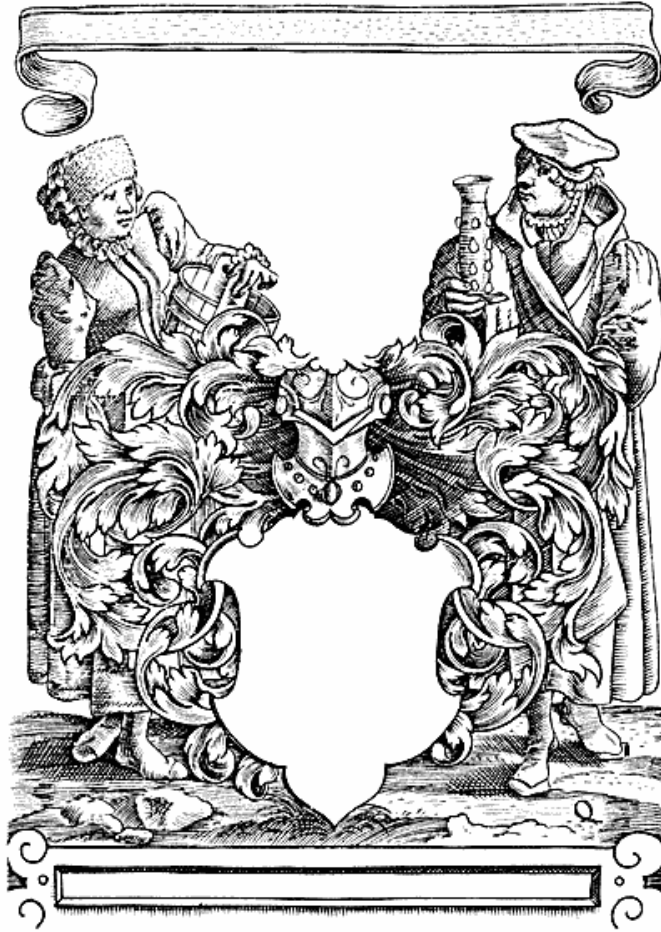
Kobberstik i New Stam oder Gesellenbuch, Köln 1588, med (ubenyttet) plads til våbenudfyldning, navn etc. Tage Thotts stambog, Ny kgl. Saml. 681 8°.

den samme bredde som stambøgerne i Kgl. Bibl. Dertil kommer, at i modsætning til andre samlinger, hvor stambøger fra det 18. årh. er i over-tal, stammer de fleste af Kgl. Bibl.s stambøger fra tiden før 1700. Stam-bøger påbegyndt senest 1600 er repræsenteret med 47 numre, deraf 14 med danske og norske og 3 med slesvigske ejere. Næsten halvdelen eller nøjagtigt 22 er baseret på trykte bøger, dertil kommer enkelte slagtede stambøger fra autografsamlinger.