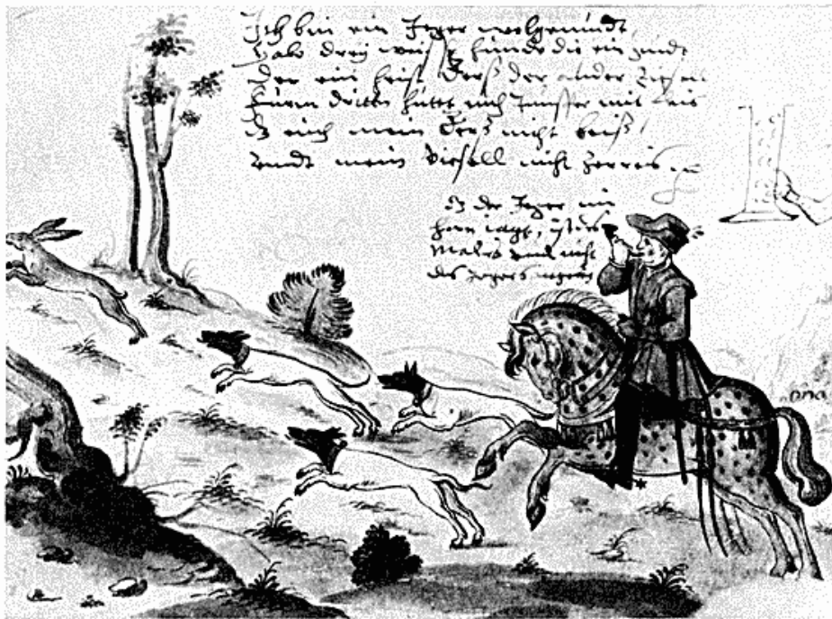
Jagtscenen indgår som del af stambogshilsen fra Otto von Mandelslo 1601 i Tage Thotts stambog, Ny kgl. Saml. 681 8°. Akvarellen måler 13,5 × 19 cm.

Disse rejser har dog ikke efterladt sig spor i hans egen stambog, som kun undtagelsesvis er benyttet til enkelte indførsler, således 1614 i Landskrona og 1626 i Zeitz. I denne fornemme stambog med mange farvelagte våbentegninger og adskillige andre illustrationer udgør de talrige adelige og borgerlige navne en passende blanding, hvilket bidrager til dens alsidighed.