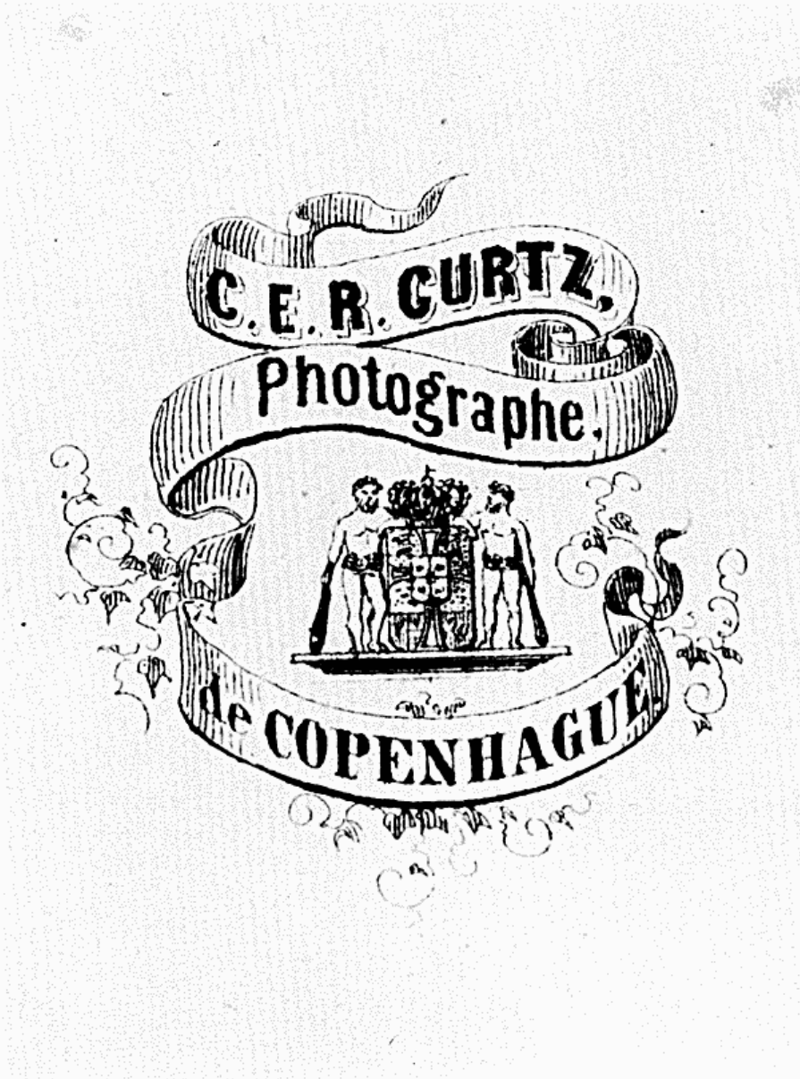
Curtz: visitkortsporträttens typografiska utstyrsel poäntrade köpenhamnsk bakgrund.