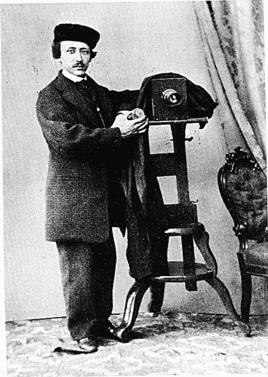
Charles Riis i egen ateljé i Björneborg på 1860-talet. – Visitkortsfotografi, Satakunta Museum, Björneborg.