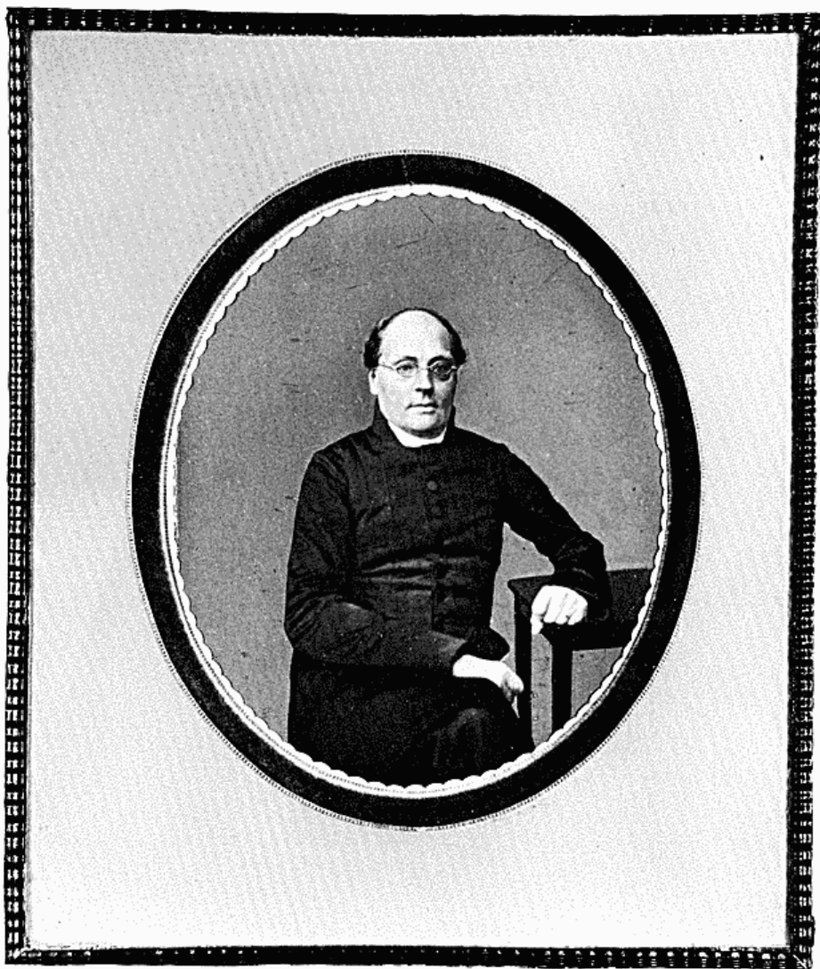
Philipsens porträtt av Runeberg i originalfattning i skaldens hem i Borgå.