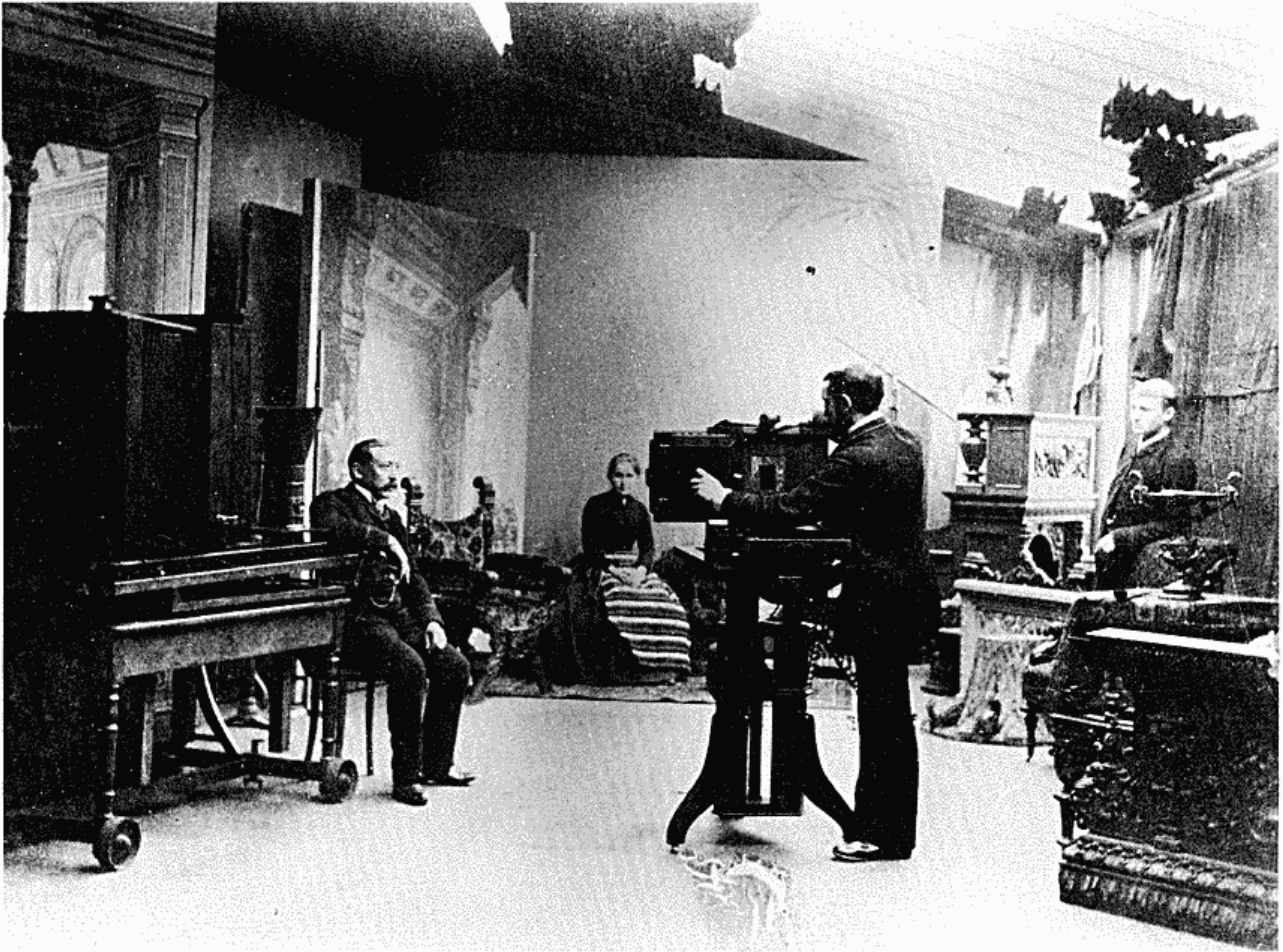
Charles Riis som etableret societetsfotograf i Helsingfors c. 1890. Kulisser och stil- möbler finns att välja på, tak- ljuset kan regleras. Till vänster förstoringsapparat på hjul. Helsingfors Stadsmuseum.