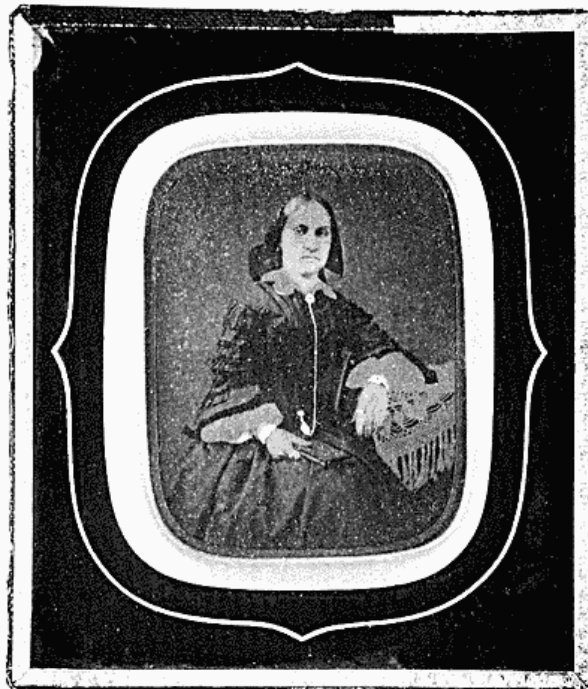
Okänd dam, ambrotyp av Völcker. - Privatägo, foto Museiverket, Helsingfors.

Neupert & Co porträtterar i Finlands huvudstad, tonen är anspråksfull på alla sätt. Helsingfors Tidningar 15.7.1848.