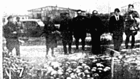
1) Bygningen i nærheden af KLUBA, hvori Gaskamrene ligger. 2) En af Kamrene, her ses en af Kamrene, der er blevet brugt. 3) Døgnlige Mærkeskiltene, som er blevet brugt. 4) Døgnlige indholdende Ben og Hår, som er blevet brugt. 5) Døgnlige indholdende Hår og Ben, som er blevet brugt. 6) Døgnlige indholdende Hår og Ben, som er blevet brugt. 7) Døgnlige indholdende Hår og Ben, som er blevet brugt.

Den illegale presses oplysninger om de nazistiske udryddelseslejre blev mere veldokumenteret, som de allierede hære rykkede frem, hvor lejrene lå. I november 1944 bragte Dansk Presse et nummer med billeder fra lejrene.