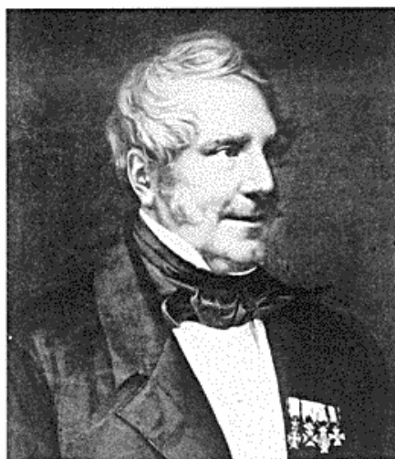
Fig. 2. Vivat Victorius Franciscus Nachtégall (1777-1847). Dansk gymnastik-pædagog, blev krumtappen i Frederik VI's bestræbelser på at indføre den tyske gymnastik i hæren og skolen.

derligt påagtet i dansk idræthistorisk forskning. Det samme gælder det utrykte, håndskrevne manuskript på 186 sider – hjemmehørende i Den Collinske Brevsamling – med titlen Kortfattet Fremstilling af min Virksomhed for Gymnastikkens Indførelse og Udbredelse fra den første Begyndelse i Aaret 1799 indtil Udgangen af Aaret 1840 . Begge disse værker er, trods deres åbenlyse mangler, guldgruber for den idræthistoriske forskning – både som levninger og som beretninger.