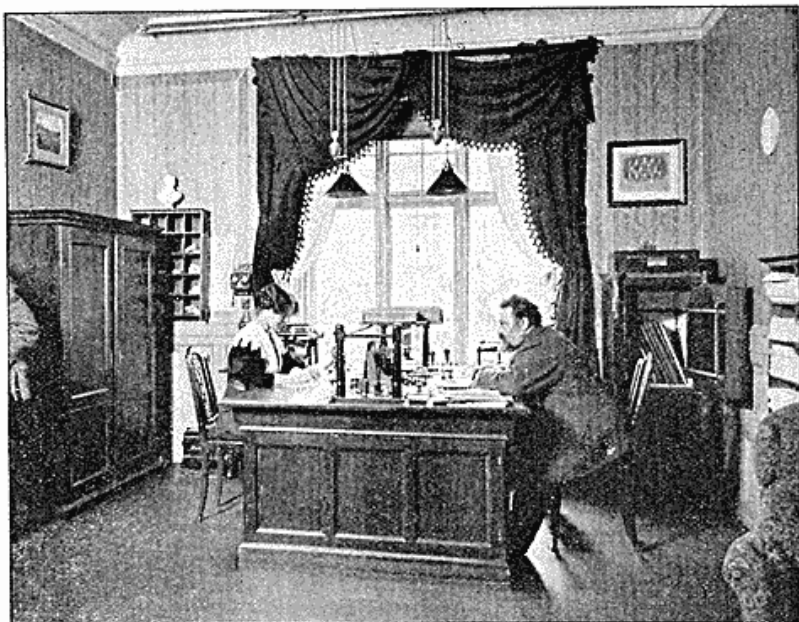
„Dansk Tonekunstner-Forening's Sekretariat og Kontor