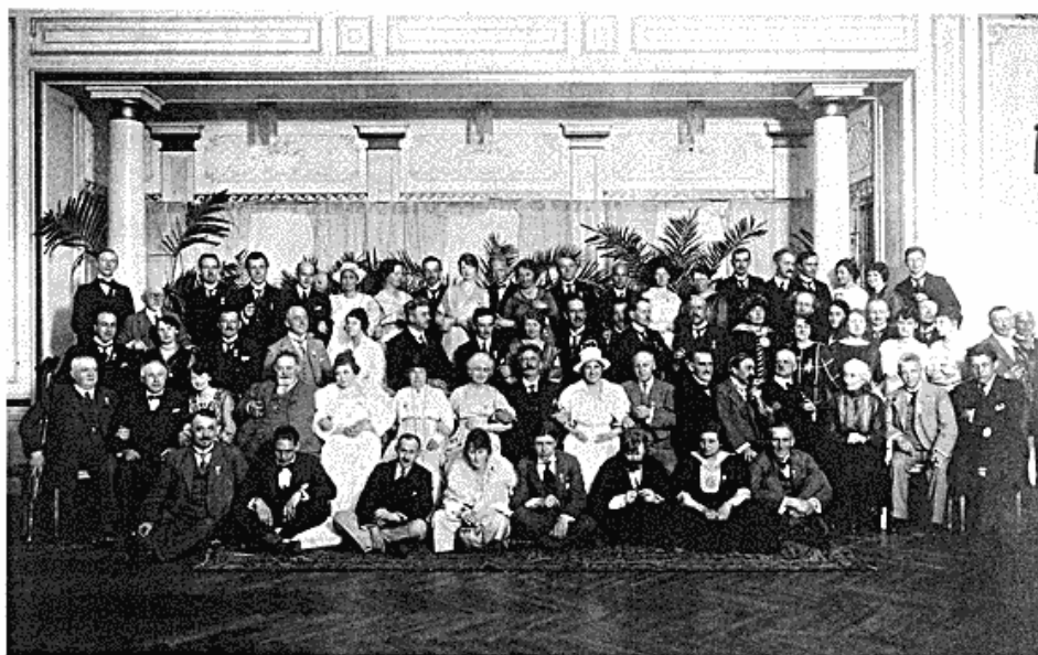
Ved den nordiske musifest i København i sommeren 1919, umiddelbart før Charles Kjerulfs død, blev dette gruppebillede taget. Også kritikeren Kjerulf, siddende i anden række som nr. 4 fra venstre, var en del af familien.

ligefrem indeholdt musik af komponisten Charles Kjerulf. 70 Dynastiet Kjerulf kunne man ikke komme udenom.