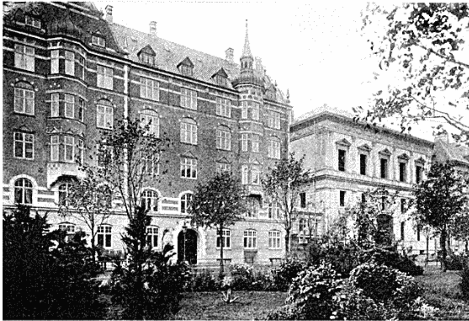
Den danske musiks „dobbelrepræsentation“: Til venstre Dansk Tonekunstnerforenings sekretariat og bibliotek, Vestre Boulevard 38 (nu H. C. Andersens Boulevard), til højre det ny Kgl. Danske Musikkonservatorium.