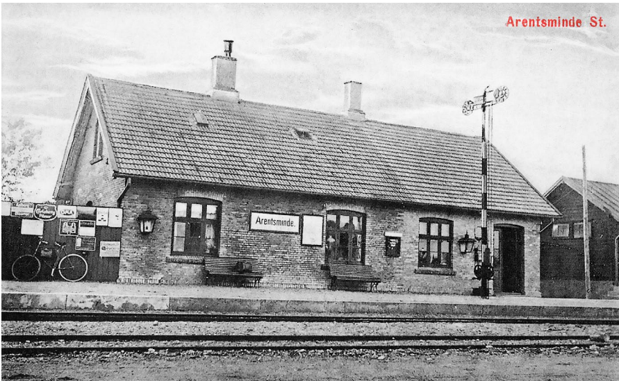
Ill. 3: Arentsminde Station nær Brovst, ca. 1916. Hovedbygningen blev opført i 1897, hvor stoppet blev udvidet fra billetsalg til station. I 1969 blev stationen nedlagt, og i 2014 blev bygningen revet ned efter flere års forfald. 31 Den topografiske postkortsamling rummer en stor mængde fotomateriale fra lokaliteter rundt omkring i Danmark, der enten ikke findes længere eller har ændret udseende og funktion.

Den topografiske postkortsamling viser et Danmark, der engang var; et Danmark, hvor selv de mindste landsbyer havde en købmand, hvor mejerier, savværker og møller lå drysset ud over landskabet, og hvor fremtiden kom buldrende i form af utallige små og store togstationer rundt omkring i landet. Samlingen bliver på den måde et fantastisk vidnesbyrd om både den udvikling og afvikling, det danske samfund gennemgik fra midten af 1900-tallet, og dermed den modernisering, der – på godt og ondt – kom til at forme det samfund, vi lever i i dag.