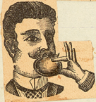
Fantaren-Trompete aus feinem Aluminium.

at I ogsaa skal dermed mange Gang endnu! Saa vi kan være sammen i Trøj og Gammen — hvad vi havde glødet os saa meget til.