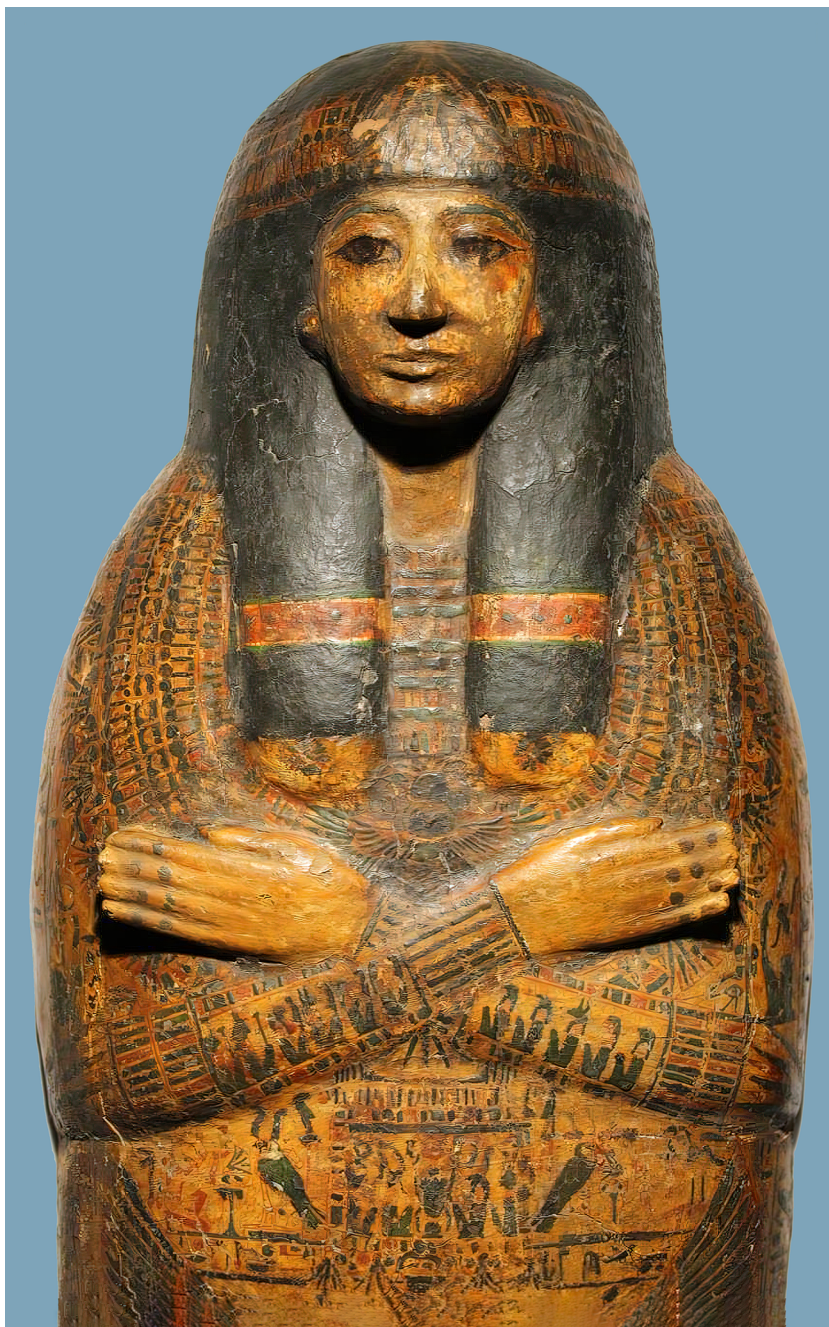
III. 8: Udsnit af Taubastis kiste (Antikmuseet, O 303).