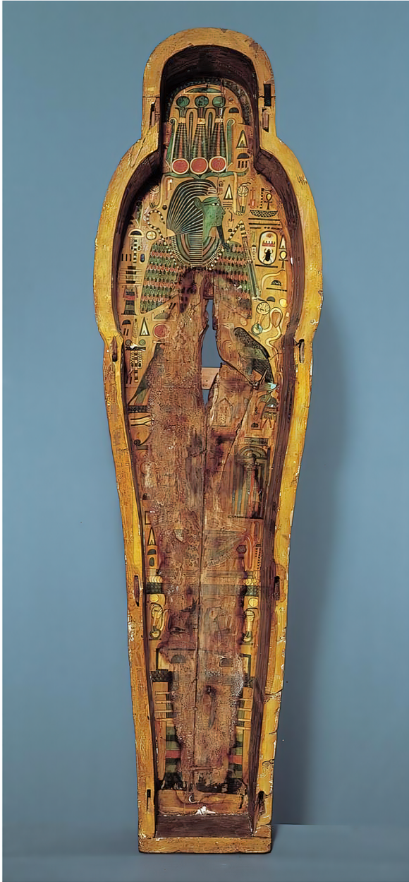
Ill. 6: Afbildning af Osiris malet i bunden af Khonshoteps kiste (Ny Carlsberg Glyptotek, ÆIN 1069).