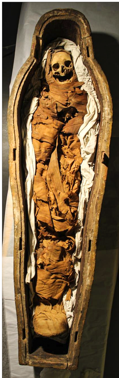
Ill. 11: Taubastis mumie, som den tager sig ud i dag (Antikmuseet, O 303).