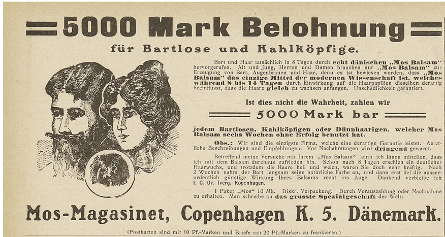
Ill. 4: Annonce for Jenny Andersens mosbalsam. Ill.: Lustige Blätter – schönstes buntes Witzblatt Deutschlands , 22/8, 1907, s. 15.