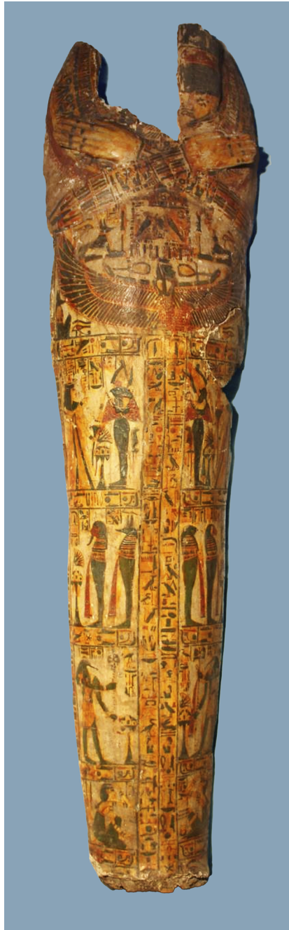
III. 9: Taubastis mumiebræt (Antikmuseet, O 303).