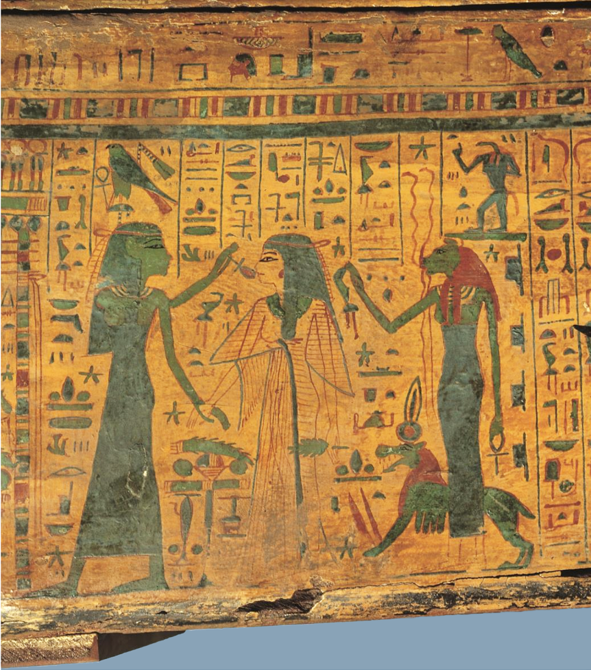
Ill. 10: Maleri på venstre side af Khonshotepe's kiste, der afbilder hans unavngivne hustru (Ny Carlsberg Glyptotek, ÆIN 1069).