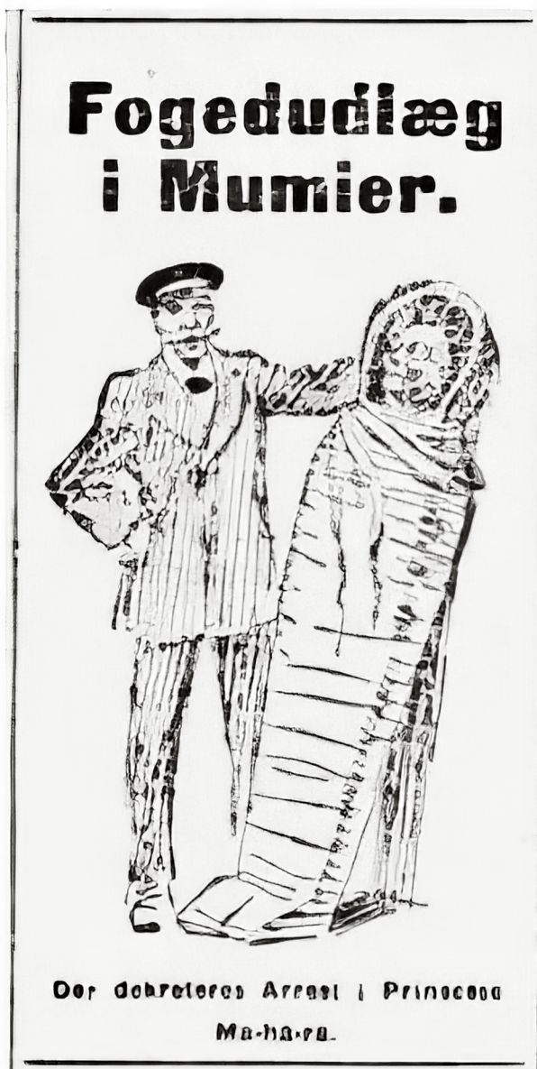
Ill. 7: Tegning bragt i Aftenbladet den 21. februar 1912.

“Der dekretes Arrest i Prinsesse Ma-ha-ra.”