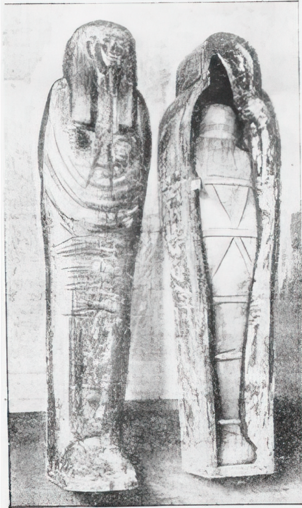
Kisten med Skrivernees Mumie (til venstre det afdagne Laag).

Ill. 1: Fotografi af Khonshotepe's kiste og mumie, som prydede forsiden af Aftenbladet den 27. april 1910.