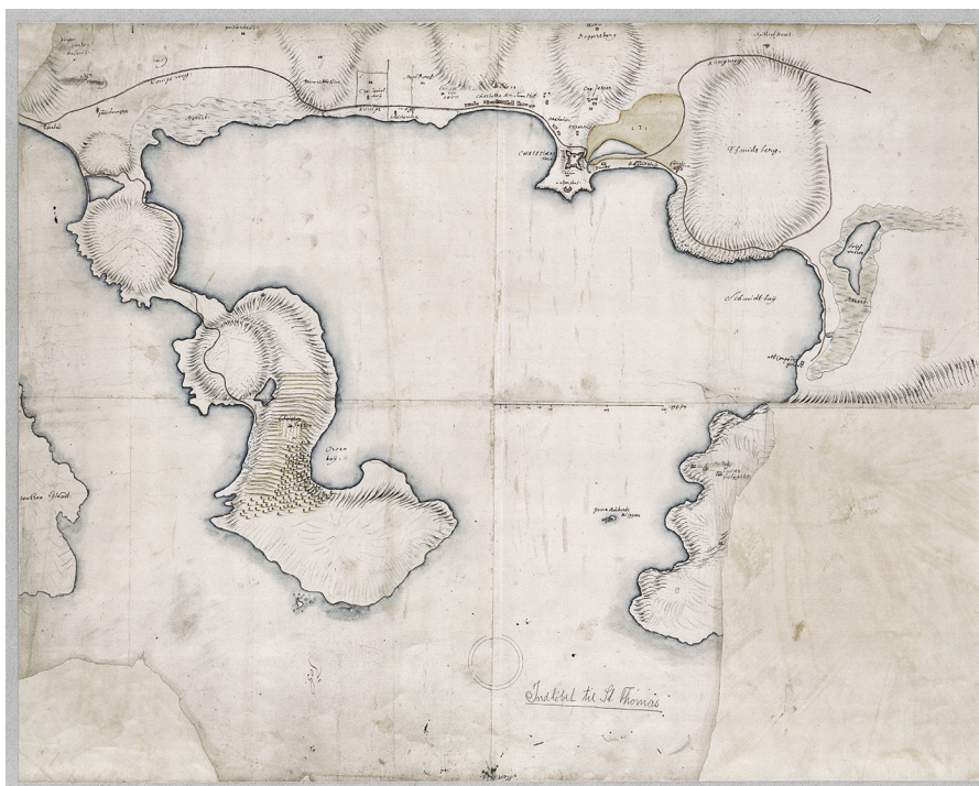
Ill. 1. Kort over indløbet til havnen på St. Thomas fra midten af 1680'erne.

datering ikke holder, men at kortet nok er på den gode side af 100 år ældre. Det betyder, at kortet faktisk er det ældste, detaljerede kort over en af kolonierne i det tidligere Dansk Vestindien, der er bevaret frem til i dag. 3