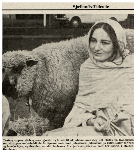
Teatergruppen »Solvognens« gjorde i går sit til at julehumøret steg lidt ekstra på Rådhuspladsen. Gruppen underholdt de forblæsnede med julealmene, julemænd på rulleskøjler for rundt og lavde lyde, og desuden var der tabletter fra juleevangeliet – som her Maria i stalden i Betlehem.