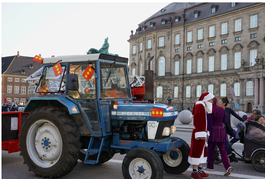
Julemand ved Christiansborg Slotsplads. En hilsen fra Solvognen i forbindelse med Christianias 50-års jubilæum i september 2021. Julemandshærens deltagelse blev i denne omgang ikke dækket af medierne.