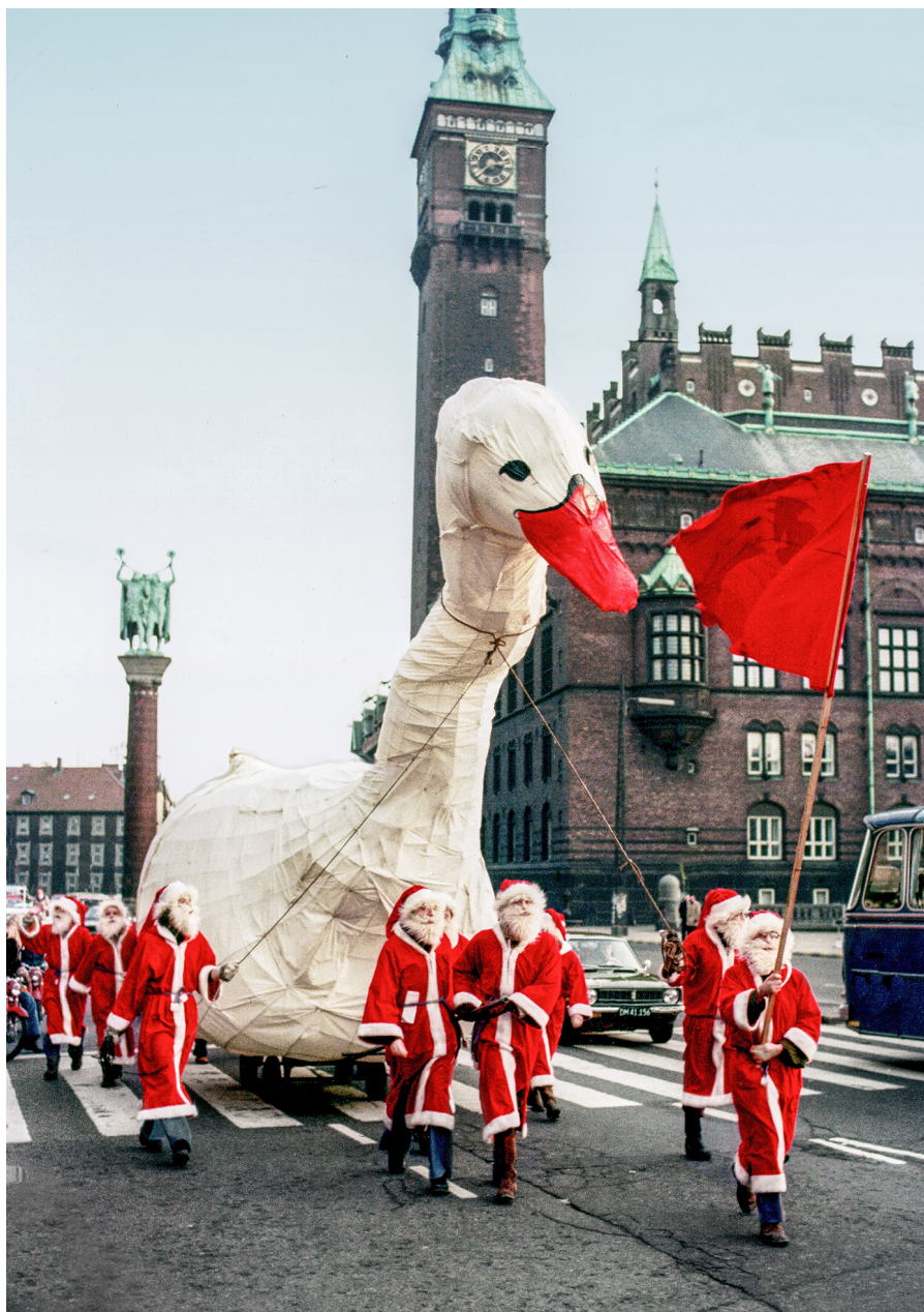
Den store julegås ankommer med Julemandshæren til Københavns Rådhus i 1974. Kritiske medier vælger at kalde gåsen for en and. Gengivet i Solvognen. Fortællinger fra vores ungdom .