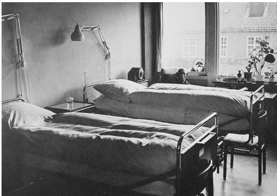
En julemand titter ind til en ældre mand i De Gamles By. Børnebogen Da julemændene kom til byen er det eneste sted, man finder billedokumentation for besøget i form af et kompositbillede.

Denne dag kan man også på forsiden af Dagbladet læse om en julemand i New York, der demonstrerer mod arbejdsløshed – noget der viser at koblingen mellem julens symbolik og kapitalismekritik også optræder i aktionsform simultant i andre lande. 21 Nogle aviser beskriver den julemands-cabaret, man kan opleve samme dag kl. 16 på Rådhuspladsen. Information skiller sig ud fra de øvrige medier ved konsekvent at lave opsøgende journalistik, hvor de myndigheder og institutioner, der konfronteres med Solvognen, interviewes. Således har de denne dag lettere humoristisk fokuseret på, at julemændene blev ledt udenom Amalienborg Slotsplads “Er det forbudt at gå på Amalienborg slotsplads, hvis man er julemand” spørger intervieweren polemisk den vagthavende på politistationen i St. Kongensgade. Den vagthavende svarer, at optog ikke må kollideres med vagtparaden