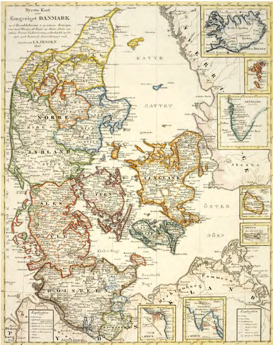
Ill. 1: Nyeste Kort over Kongeriget Danmark med Besiddelserne i og udenfor Europa, 1837. Skolekort. Øverst i højre hjørne indsatte kort over de nordatlantiske besiddelser: først Island, derefter Færøerne og endelig den sydlige spids af Grønland. Østgrønland var i 1837 kun kortlagt op til 65° nordlig bredde.

gjaldt lokalt i selve Grønland, hvor missionærer og koloniembedsmænd som hovedregel var norskfødte, ligesom de mange håndværkere og matroser der fulgte med som en uundværlig del af kolonisationsprojektet,