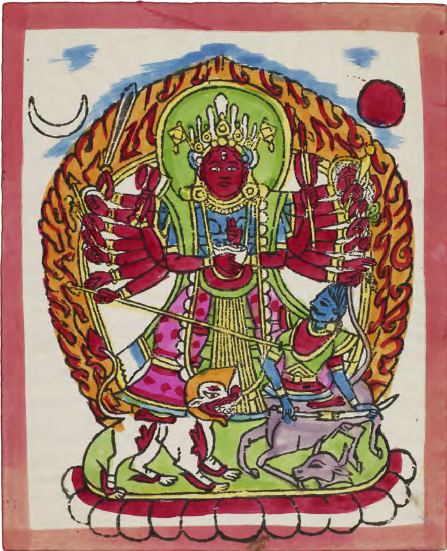
Fig. 12: 16-armet Durga. Bloktryk med håndlagte farver erhvervet i Bhaktapur i 1967. Maskinfremstillet papir 22,7 × 18,5 cm (motiv 20,2 × 15,6 cm). Nepal 197, nr. 4.

i gråbrun farve. Løven er farvet orange eller hvid og rød. Kropsglorien står i orange og rød. Grøn ses i detaljer, bl.a. i Durgas tøj og på lotustro- nen. Blå kan angive himlen og tøjstykker. Farvelægningen er som regel ens i identiske tryk, men på tre identiske tryk er der på to af dem tilføjet ildtunger til Durgas sværd, der er løftet op over hendes hovedglorie.