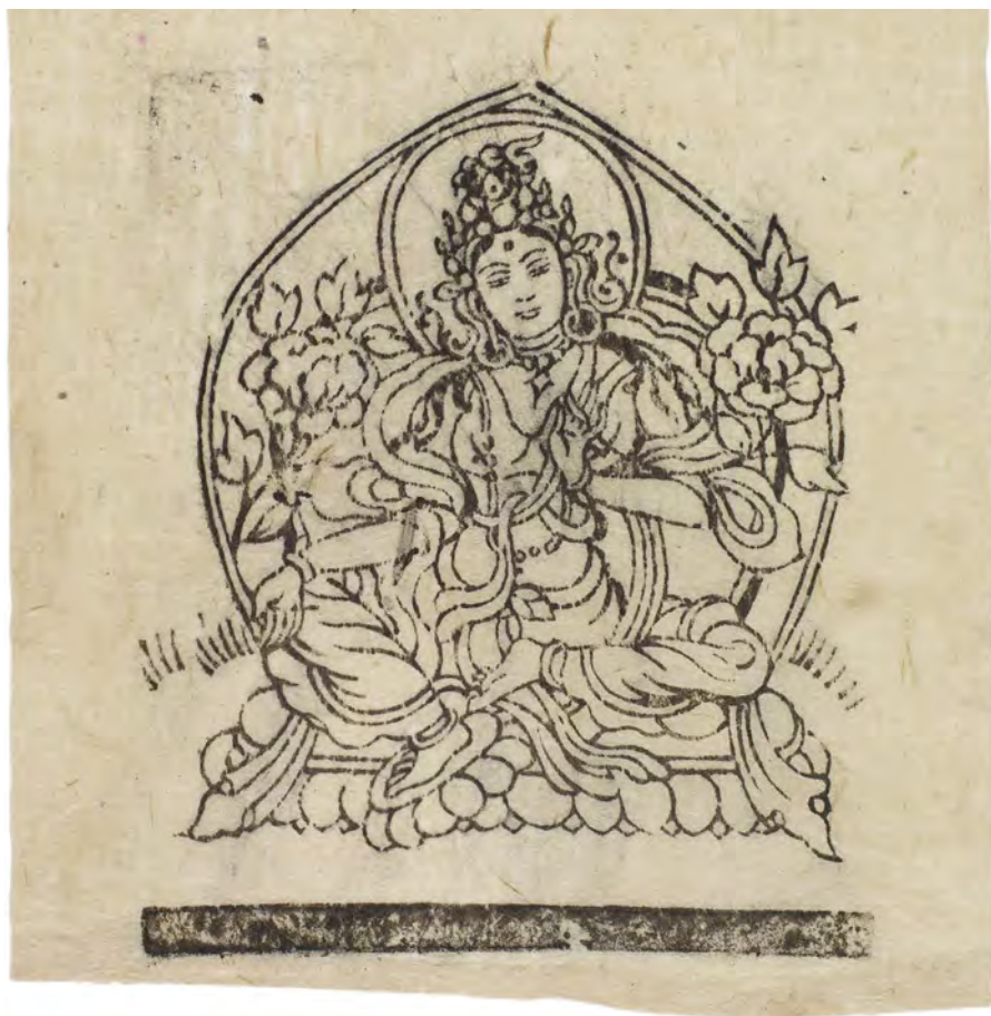
Fig. 1: Târâ i Lhasa-stil. Bloktryk på håndgjort papir erhvervet 1957-58 i Kathmandu, 12,8 × 12,5 cm (motiv 11,2 × 9,3 cm). Nepal 185, nr. 45.

af dette tryk. 18 Târâ afbildes i mange former og betragtes generelt som en frelser fra onde indflydelser. I en af de sædvanlige udformninger hviler Târâs højre fod på kanten af lotuskronen, mens den venstre fod peger ned mod hælen på højre fod, hvilket er tilfældet i fig. 1. 19