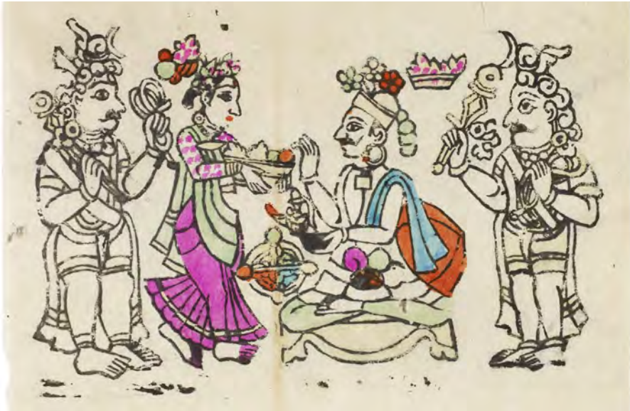
Fig. 14: Kija puja-ceremonien. Bloktryk fra en gammel trykplade formodentlig fra Kathmandu, erhvervet 1957-1959. Delvis farvelagt på håndgjort papir, 22,4 × 29 cm (motiv 17,6 × 26,4 cm). Nepal 185, nr. 43.

passer dog godt sammen med hendes status som gudinde for indlæring og kunst. 46