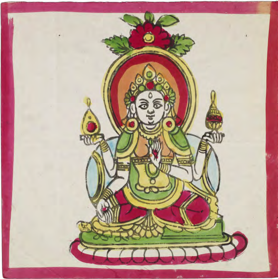
Fig. 4: Lakshmi-afbildning med typiske attributter og håndstillinger fra 1985. Bloktryk med håndlagte farver på maskinfremstillet papir, 25,1 × 25,1 cm (motiv 23,3 × 16,3 cm). Nepal 195, nr. 5.

Sædvanligvis ses en skildpadde under højre knæ og en bog under venstre knæ (fig. 4). På et tryk rider Lakshmi dog alene på en gåselignende fugl. I dette tryk holder hun to genstande op i hovedhøjde, og de ligner en klokke og en skrivepen. I det ene tryk med Lakshmi placeret i en mandala ses hun i den almindelige position uden skildpadden og bogen, og desuden er mandalaen uden den sædvanlige cirkel og kun opbygget af fire trekantede, der udgør en stjerneform.