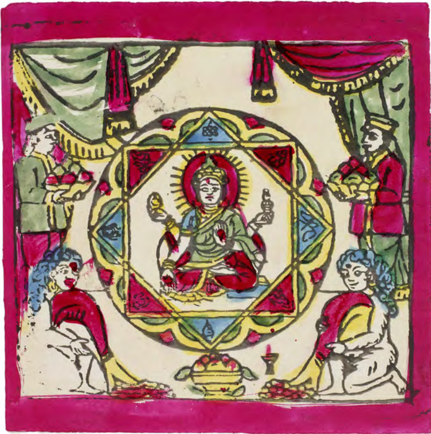
Fig. 6: Mandala Lakshmi-afbildning med fire ledsagere uden for mandalaen, erhvervet 1957-1959. Bloktryk på håndlavet papir med håndpåførte farver, 16,2 × 16,6 cm (motiv 14 × 15,4 cm). Nepal 185, nr. 23.

baggrunden i trykkene. Når Lakshmi benytter en stol, er den gerne udformet i en vesterlandsk 1800-tals troneagtig stil med svungent ryglæn og udskårne dekorative elementer, som i et tilfælde er løvehoveder. De soldaterlignende ledsagere kan være klædt i uniformer, der kan minde om engelske eller franske Napoleonsuniformer. Ligesom de kinesiske ledsagere gør det, viser de vestlige elementer også tegn på rigdom (fig. 7). I det nordlige Indien byggede englænderne deres egne vestlige bygningsværker prydet med vesterlandske møbler og kunstværker. Dette blev betragtet som luksus. Det har ganske givet fået en indflydelse på, hvad de lokale i det nordlige Indien og dermed også i Nepal anså som symboler