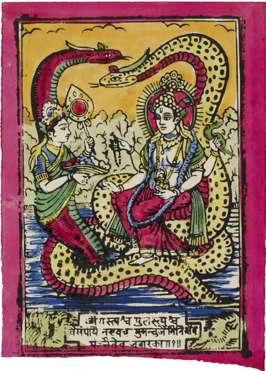
Fig. 9: Slangejomfruen (Kanya Nagini) opvarter Vishnu-lignende gud siddende på slanger med kort tekst nederst, erhvervet 1957-1959. Bloktryk med håndlagte farver på håndgjort papir, 27,9 × 22,9 cm (motiv 18,2 × 12,2 cm). Nepal 186, nr. 2.