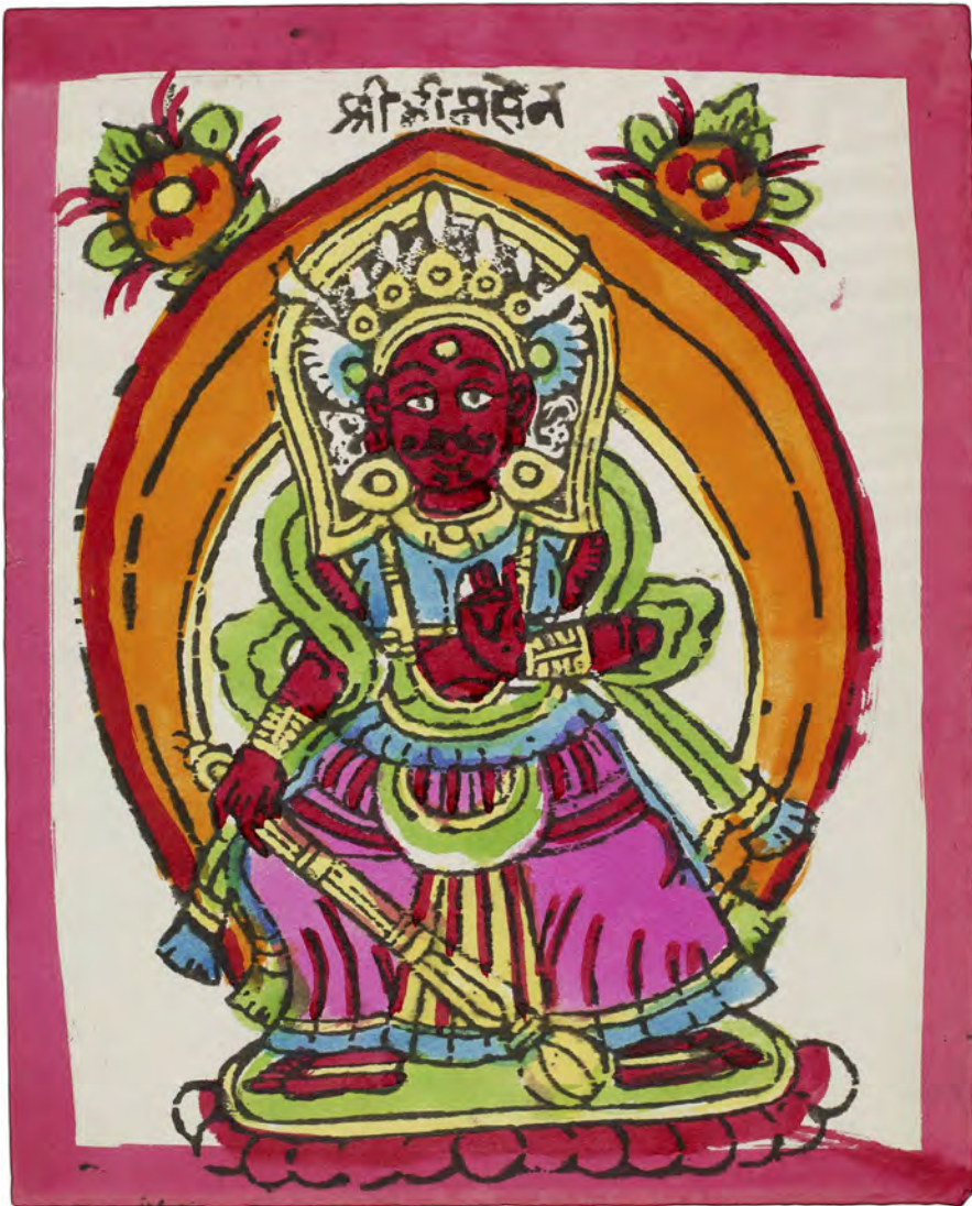
Fig. 17: Handelsguden Bhimsen. Bloktryk med håndpåførte farver, erhvervet 1967. På maskinfremstillet papir 22,8 × 18,4 cm (motiv 21,3 × 15,6 cm). Nepal 197, nr. 2.

for fremstillingen er angivet. Der er ingen tvivl om at der var forskellige fremstillere af trykblokke i byer spredt ud over Kathmandudalen. I et studie over samfundet og religionsudøvelsen i en nepalesisk by, Sankhu, angives det, at der i byen i 1997 var en familie, der tog sig af traditionelt maleri (Chitrakar-kasten), mens flere familier af Chitrakar-kasten