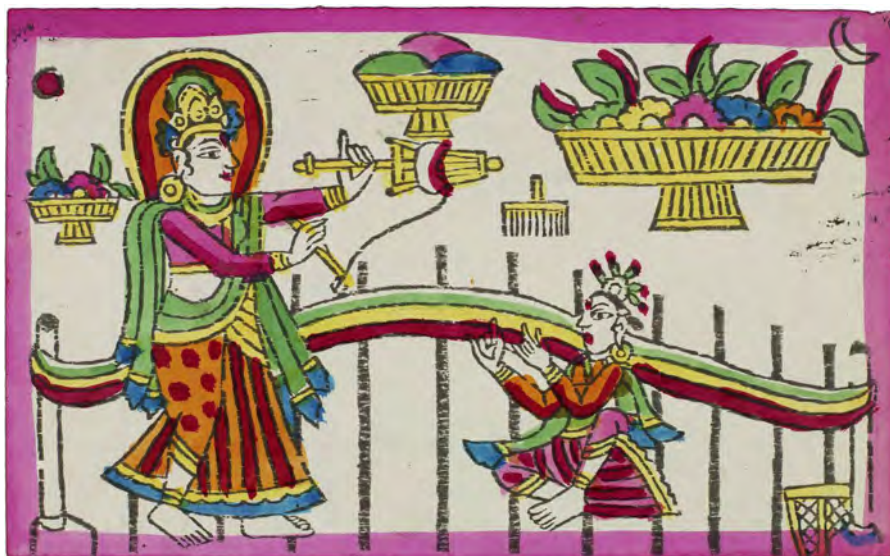
Fig. 13: Sarasvati, gudinden for indlæring og kunst. Bloktryk med håndlagte farver erhvervet i Bhaktapur i 1967. Maskinfremstillet papir 14,1 × 22,7 cm (motiv 13,2 × 21,8 cm). Nepal 197, nr. 5.

Efter Desain-festivallen fortsættes der med ofringer til Lakshmi og Sarasvati, begge meget populære i Nepal. 43 Der er kun et tryk i samlingen, der afbilder Sarasvati, og det er erhvervet i 1967 af Torkil Funder. Han skriver i sine noter til trykket, at det er købt sammen med Durga og Lakshmi-trykkene i forbindelse med Desain-festivallen 44 (fig. 13). Et identisk tryk, men med en lidt varierende farvelægning, kan ses gengivet i en bog publiceret i 1991. 45 Sarasvati er forbundet med Durga og er gudinde for indlæring og kunst. I trykket ses hun stående med en skyttel foran en væv. En assistent sidder og holder på klædet i væven. Tre kurve med juveler eller frugter og en tættekam er placeret øverst i billedfladen flankeret af en måne og en sol. Dette udtryk af Sarasvati er ikke det sædvanlige, for hun ses gerne med fire arme med et håndskrift, en lotus, et musikinstrument og en vandbeholder, men vævescenen her