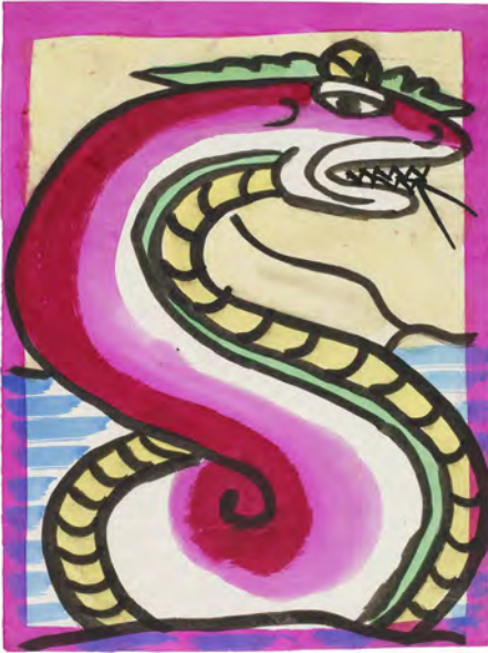
Fig. 8: Naga-konge. Akvarel på maskin-fremstillet papir, erhvervet 1957-1959; 25,3 × 19 cm (motiv 23,2 × 18,9 cm). Nepal 185, nr. 12.

kulturer som positive symboler, de er bl.a. forbundet med at styre regn og dermed frugtbarhed, ligesom slangerne er det i Nepal (se nedenfor).