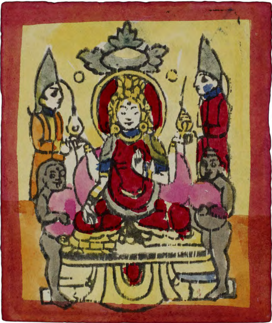
Fig. 18: Lakshmi-afbildning med to soldater og to Kyat. Bloktryk på maskingjort papir med håndlagte farver, erhvervet 1957-1959. Linjerne i trykket er af varierende tykkelse og ikke helt præcise i kanterne. 10,4 × 8,6 cm (9,4 × 6,2 cm). Nepal 199, nr. 2.