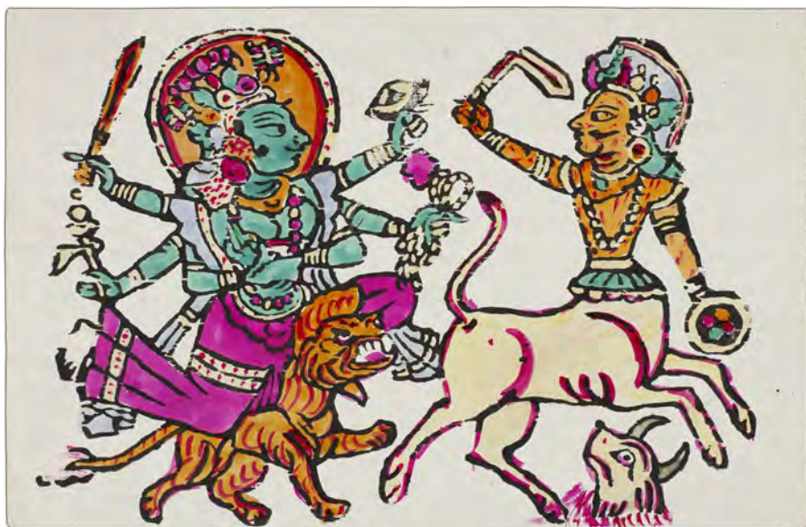
Fig. 11: Gudinden Durga jager bøffeldjævelen (Mahishasura). Bloktryk på maskinfremstillet papir med håndlagte farver, trykt fra en gammel trykplade erhvervet i Bhaktapur 1957-1959. 20,1 × 28 cm (motiv 19 × 25,5 cm). Nepal 200, nr. 15.