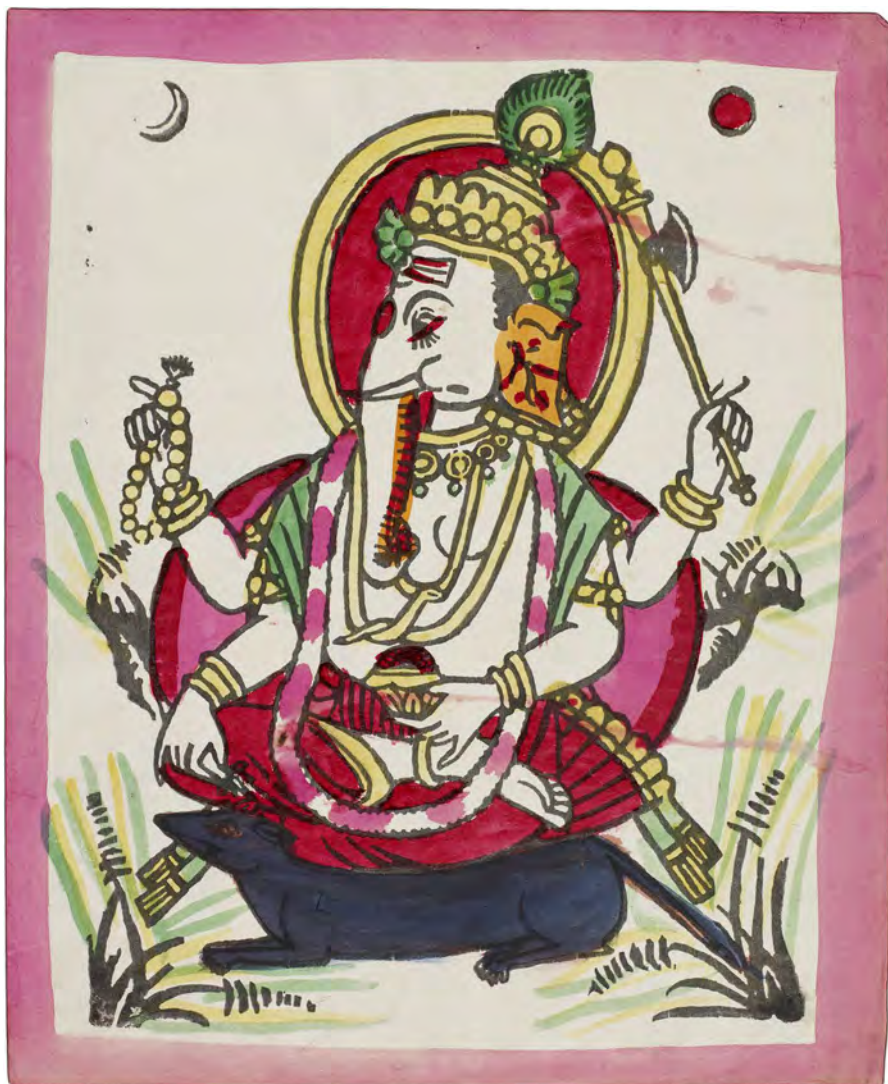
Fig. 2: Visdomsguden Ganesha i naturen. Bloktryk med håndlagte farver, erhvervet i 1985. På maskinpapir 27,3 × 22,7 cm (motiv 24,9 × 21,8 cm). Nepal 195, nr. 1.

grøntsager og frugt. De to nedre arme holder i hånden dels en delikatesse, dels en løkke. Ganesha er kendt for sin svaghed for søde sager, så derfor afbildes han gerne med forskellige delikatesser. Der findes to farvevarianter af dette motiv, dels en på hvid baggrund, dels en på gul baggrund, hvilket påvirker de andre anvendte farver, så de fremstår