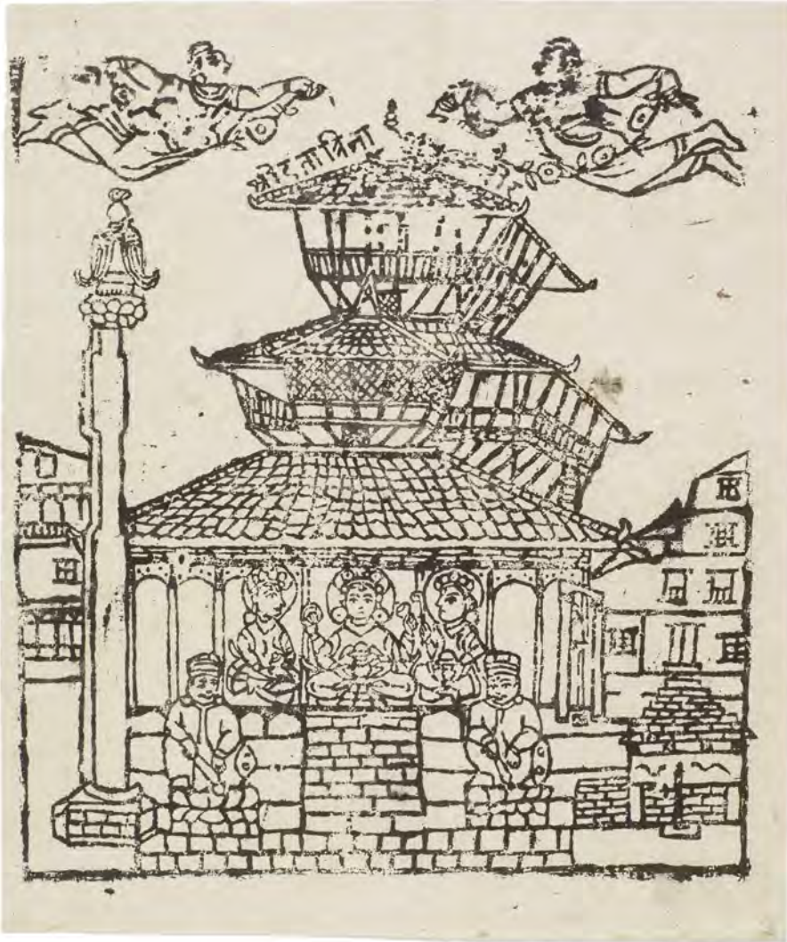
Fig. 15: Lakshmi-tempel nær Hanuman Dhoka i Kathmandu, erhvervet 1957-1959. Bloktryk på håndfremstillet papir fra ældre trykplade, 22,5 × 18,9 cm (motiv 20 × 17,5 cm). Nepal 7f.-66/2, s. [12].

enkle strøg, og der er kun angivet få detaljer i billedet. Gudinden ses med front mod tilskuerne, mens de to ledsagere er vist i trekvartprofil, hvilket også er benyttet i de senere (samtidige) tryk.