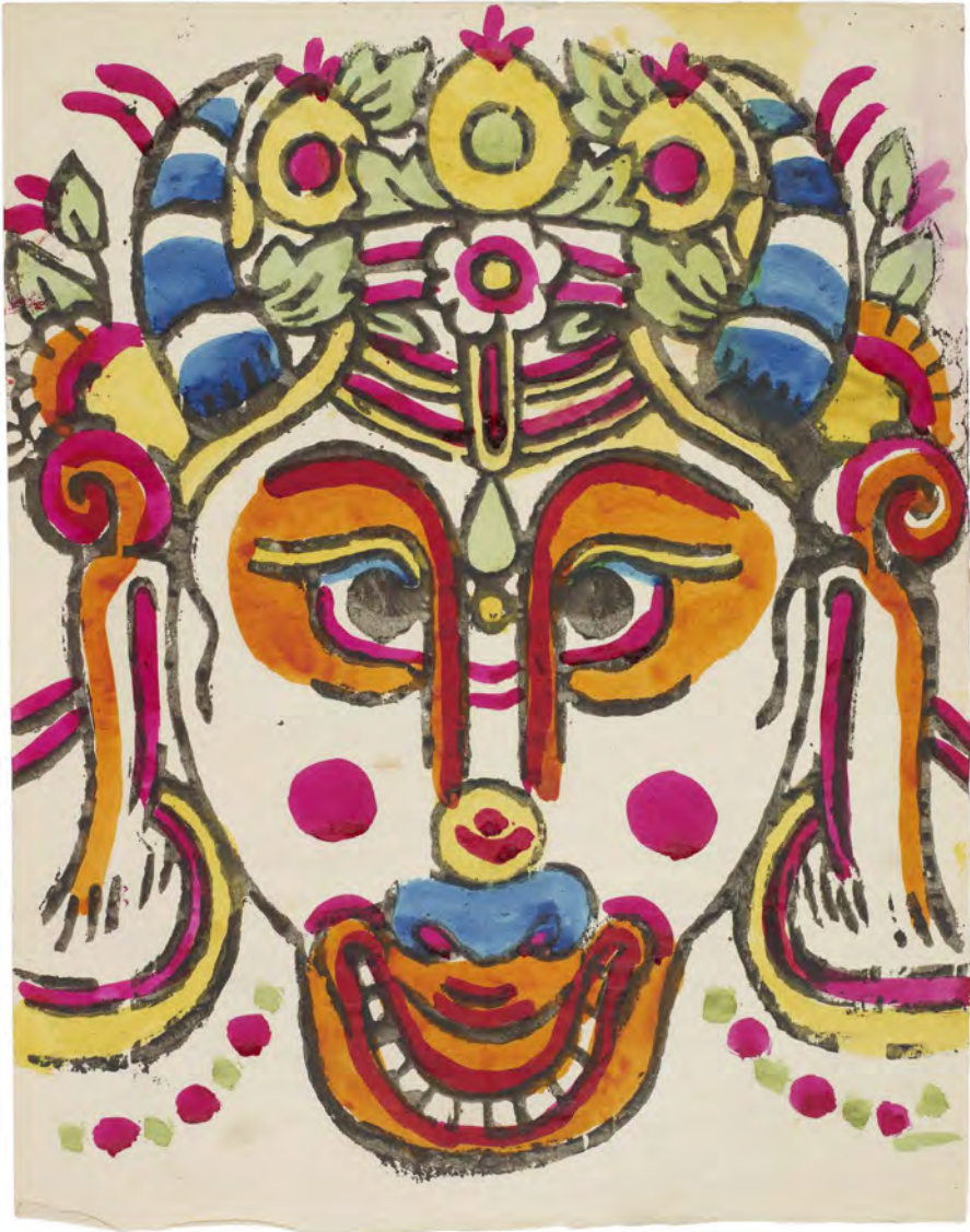
Fig. 3: Ko-hoved, type 3. Bloktryk med håndlagte farver erhvervet 1957-59 i Bhaktapur. På maskinfremstillet papir 29 × 22,7 cm (motiv 26,6 × 22,7 cm). Nepal 185, nr. 21.

få er grønne, og mange af dem har tre ringe, der inddeler hornene i fire felter. Ringene kan være enkle i form af tynde streger eller mere voluminøse med tykke, flerfarvede streger. Hovedtøjet er for det meste ornamentet med blomster og tre til fem bredbladede medaljoner. Fra