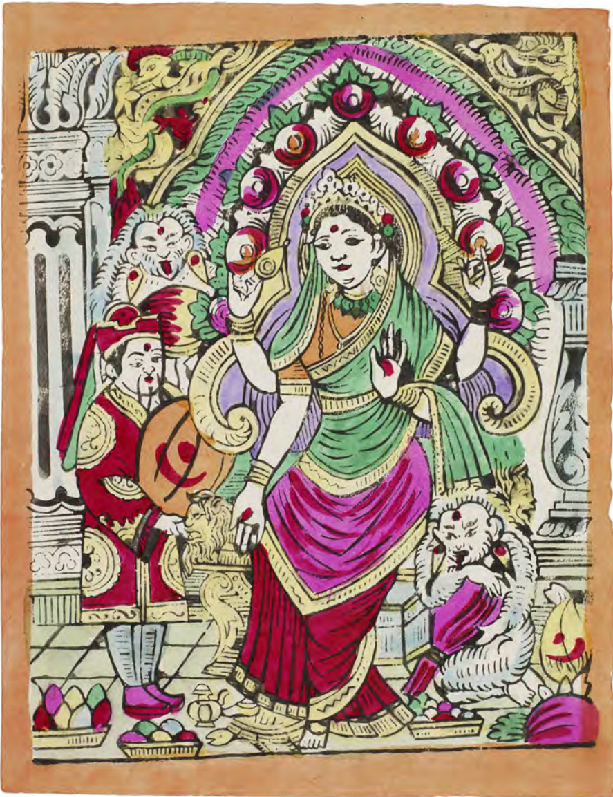
Fig. 7: Rigdomsgudinden Lakshmi med tre ledsagere, en mand i kinesisk dragt og to Kyat'er, erhvervet 1957-59 i Lalitpur. Bloktryk med håndlagte farver på maskinfremstillet papir, 22 × 17 cm (motiv 19,7 × 15,4 cm). 7f.-66/2, s. [61].

for rigdom. Andre symboler kan ligeledes flettes ind i Lakshmi-billeder som f.eks. drager og dragelignende slanger. Drager opfattes i fjernøstlige