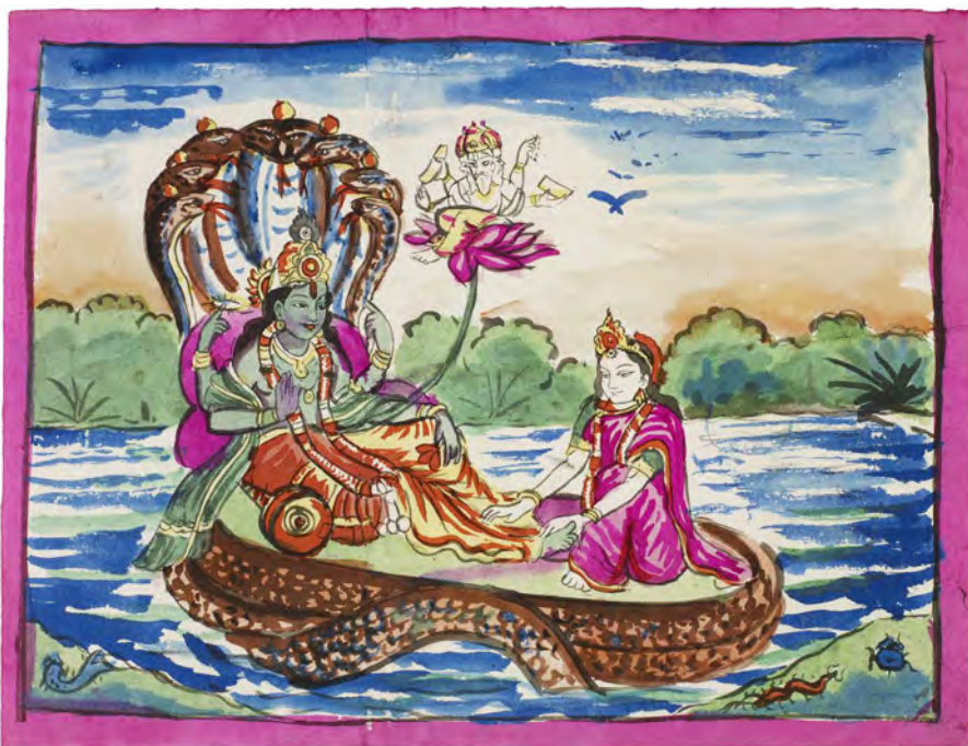
Fig. 10: Slangejomfruen (Kanya Nagini) opvarter Krishna på en trone formet af slanger. Guden Shiva sidder på en lotusblomst svævende i luften. Akvarel erhvervet 1957-59 på maskinfremstillet papir, 20,2 × 26,6 cm (motiv 18,5 × 25 cm). Nepal 185, nr. 17.

(fig. 10). Ved at inddrage Shiva i denne akvarel har kunsthåndværkeren forsøgt at gøre trykket så kraftfuldt som muligt. Et andet forsøg på at gøre trykkene mere effektfulde ses ved at inddrage Krishna, den ottende inkarnation af Vishnu. En akvarel gengiver en fløjtespillende Krishna dansende på flere slangehoveder. En ung kvinde står bag et slangehoved med hænderne i bedeposition. Slangerne og personerne er placeret i en sø med huse og skov på de bagvedliggende bredder. Et tekstbånd og de tre insekter ses i forgrunden. Krishna er desuden en central del i et tryk, der enten er trykt i sort eller rødt uden senere pålagte farver. Krishna fremstilles dansende og spillende på en fløjte omgivet af otte slanger – de otte naga-konger. De omgives af en flammeglorie og står på en lotustrone. Krishna er bl.a. kendt for at nedkæmpe dæmoner, hvor lyden fra hans fløjte er med til at fortrylle dem. 38