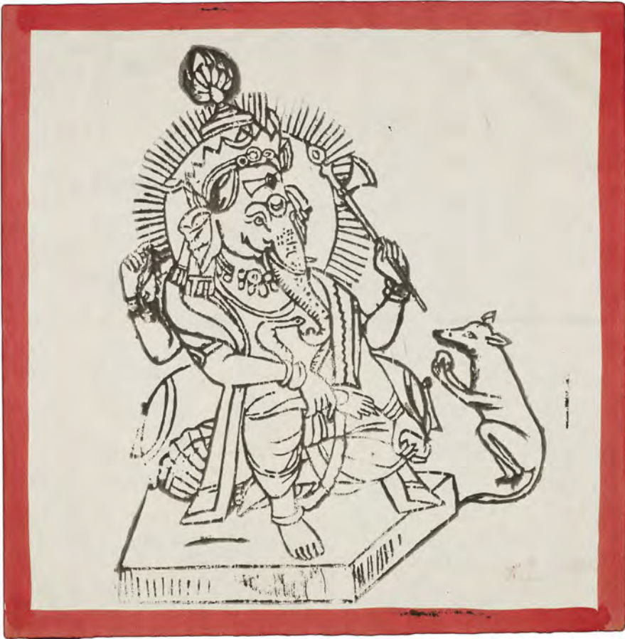
Fig. 16: Visdomsguden Ganesha. Bloktryk med håndpåført rødt kantbånd, erhvervet i 1985. På maskinfremstillet papir, 25,6 × 25,6 cm (motiv 22,5 × 17,2 cm). Nepal 195, nr. 13.

tryk er nærmest abstrakte i deres linjeføring, hvor de vigtigste dele er angivet med ret få detaljer.