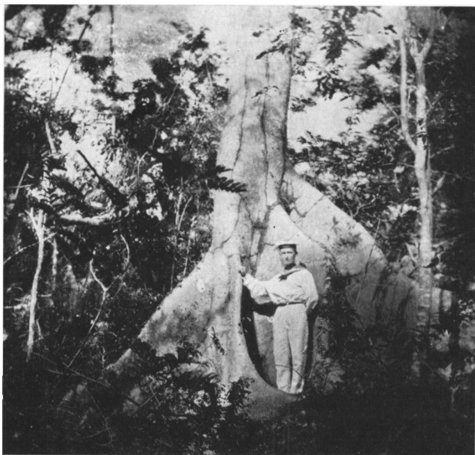
Et billede fra en tur i land, hvor vi plukkede kokosnødder.

somt, men sikkert, det var jo varmt, og snart blev vi indhentet af 3 dæksfolk. Efter en halv mils vej kom vi til et par negerhytter. Beboerne kom straks ud til os, og vi brækkede engelsk med dem, så godt vi kunne. To af dæksfolkene talte godt engelsk. Negrene kunne godt lide os, en kone, der var meget lidt eller let påklædt, fik nogle cigaretter, og hun begyndte at danse for os på rigtig negermaner, efter sin egen musik på en gammel rusten bordklokke og et trekantet stykke jern. Hun klappede mig på kinden og hentede et æg til mig og en af dæksfolkene, hun hentede også en kjole, som hun trak på. Hun snakkede, dansede og lo ustandselig og fortalte, at hun også havde en redekam, hun kunne spille på, men for tiden var den borte.