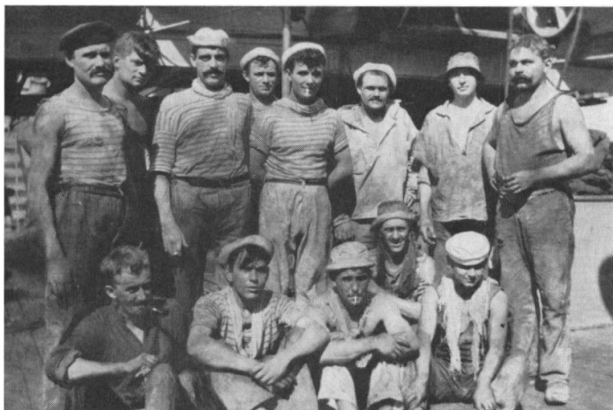
Fyrbøderbesætningen på »Valkyrien«. Artiklens forfatter er stående nummer 2 fra højre.