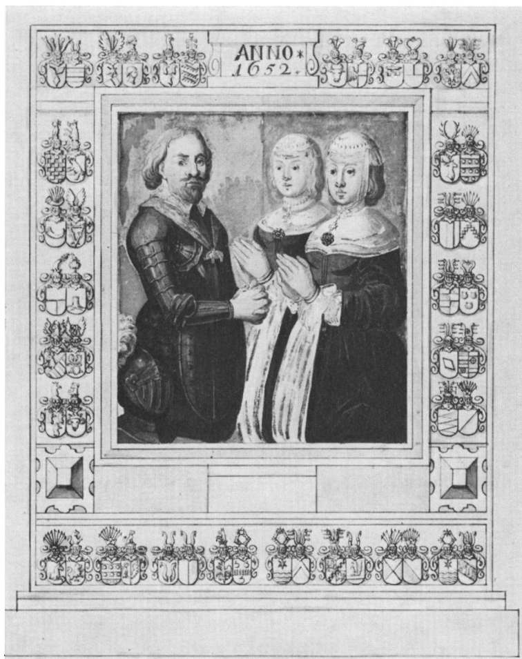
Epitafiemaleri i Tjæreborg kirke.