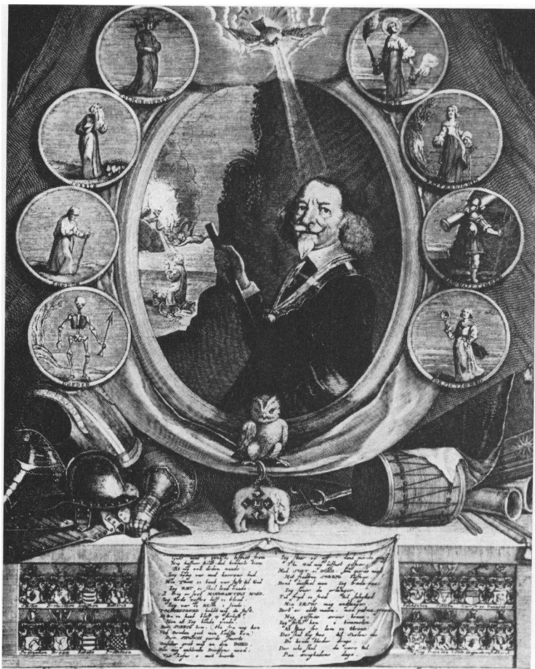
Kobberstikket. (Af Albert Haelwegh 1657).