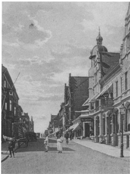
Den træbrolagte del af Kongensgade set fra Jernbanegade.

ham med kone og et par små søde børn. Han fortalte om børnene, tror jeg. Han så glad ud, og det må jeg også have gjort, for han tog mig om albuerne og sagde: »Smiling Danish boy, thank you.« En bønnedampers ankomst havde til følge, at byens drenge fik glaspusterørene frem, og så fløj soyabønnerne overalt, tværs over gaderne, fra vinduerne mod fodgængere og cyklister og undertiden gruppe mod gruppe som »gadekampe«. I skolerne blev pusterørene konfiskeret.