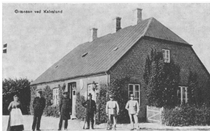
Det danske toldsted i Kalvslund.

har jeg været en ivrig lystfisker, og jeg har mange gange gennemtravet strækningen fra Foldingbro til Gredstedbro, og siden jeg i 1924 fik bil også strækningen helt ud til »Frihed«, og jeg besøger stadig åen 2-3 gange om året med fiskestangen og det på trods af de nu over 75 år.