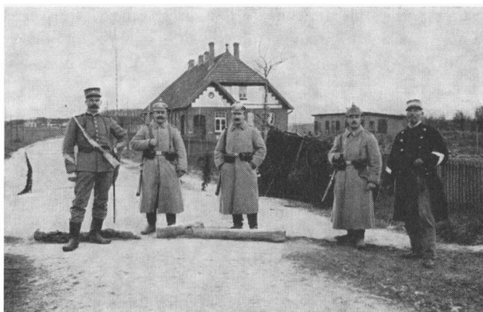
Det tyske toldsted i Baungård.

i Ribe, men desværre var Weismann blevet taget af tyskerne, inden han nåede hjem.