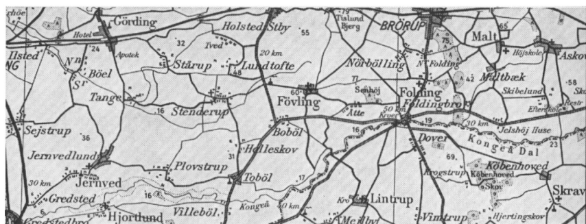
Kongeåen fra »Frihed« til Gredstedbro.