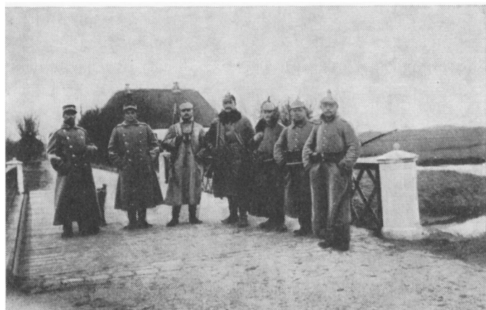
Grænsen ved Skodborghus.

Mejlby ad Rauning-vejen, og derefter med chausseen – Ribe–Kolding – til Foldingbro. De danske med en sti over min faders med fleres marker til Tobøl Østerby, og derfra med vejen gennem Åbølling, Nielsbygård til Svendstrup, og derfra med chausseen – Ribe–Kolding – til Foldingbro. Denne sidstnævnte vej går gennem Bobøl, Tobøl, Villebøl og møder den »tyske« chaussee ved Kalvslund Toldsted.