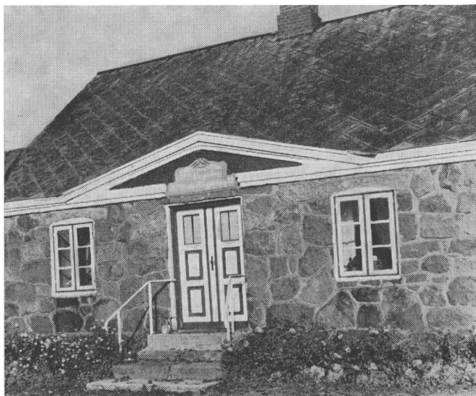
»Frihed« i Malt sogn.