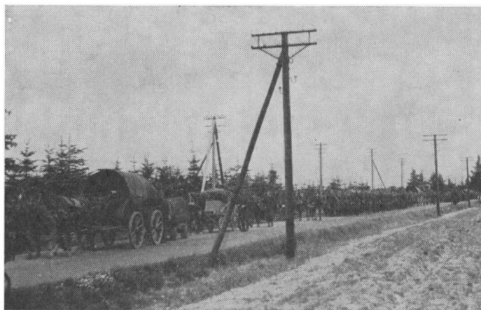
Tyske soldater drager hjem ad Grindsted-Holsted landevej.

Holdet tog så til Hejnsvig, vi fandt 6 tyskere på gården, og derfra tog vi ud til den tyske lejr på 300-400 mand. Englænderne beordrede dem til at stille op i to rækker på landevejen, så forlangte majoren at komme til at tale med den tyske kommandant, denne kom slentrende uden at gøre honnør. Englænderen så lidt på ham, tog ham så i kraven og smed ham ned i grøften med de ord: Nå, du vil ikke hilse på en engelsk officer; må jeg så se den næstkommanderende. Og han kunne gøre honnør og slå hælene sammen! Det blev så meddelt dem, at skete det oftere, at befalingen om kun at slå lejr på marken blev overtrådt, ville hver 10. officer blive skudt, og de øvrige officerer blive straffet. Han sagde det to gange til mig om at give forbindelsesofficeren i Grindsted denne ordre, denne lod den gå videre til alle de tyske tropper, som passerede Grindsted, og der var ikke mere vrøvl med dem.