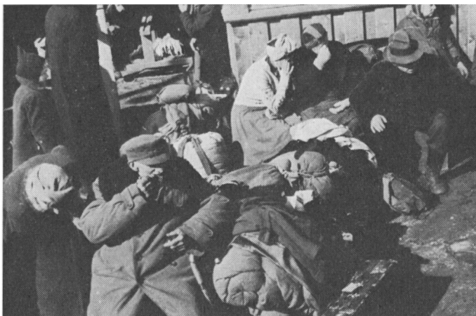
Tyske flygtninge kommer til Grindsted.

Om aftenen den 6. maj ankom et tog med 1200 flygtninge, der havde været 6 dage undervejs – fra København, disse var meget forkomne og sultne, og jeg fik byens befolkning til hver især at fremsende en god madpakke. Jeg syntes også, at vi på det tidspunkt havde råd til at være godgørende. Fra det tidspunkt kunne vi få det med den tyske kommandantur, som jeg ville have det, og alt gik nu let og uden gnidning. Derimod var der noget besvær med at holde tyskerne borte fra gårdene på deres vandring ud af landet, og vi måtte i et enkelt tilfælde have hjælp af englænderne. Jeg skal aldrig glemme den dag, der var nogle tyske soldater, som var trængt ind på en gård hos en enke; der var stjålet æg, og bagefter havde de lagt sig til at sove på høloftet med tændte cigarer, så konen var bange, og hun bad om hjælp. Jeg ringede til englænderne i Vejle om hjælp, og på en halv time (der er 42 km hertil) var der to biler derude med 6 mand, en major som leder. Her havde vi 30 mand bevæbnet med maskingeværer.