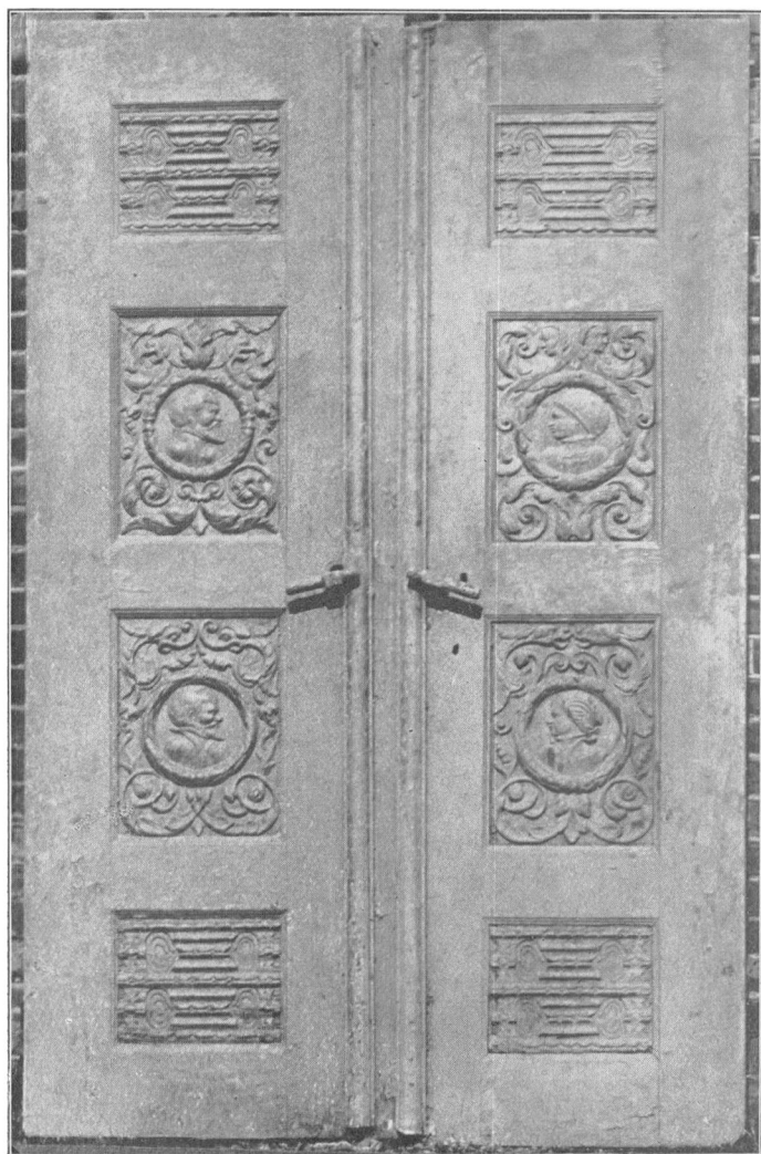
Dør fra det gamle Kærgaard.